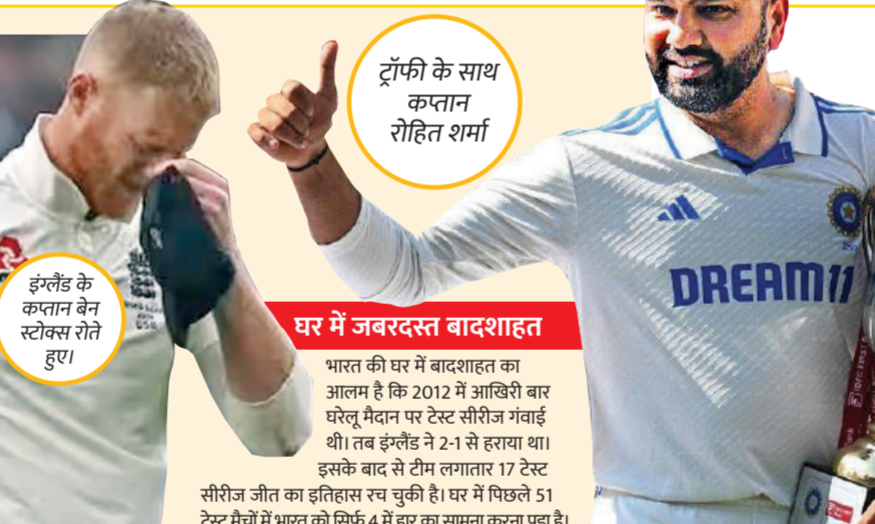
ट्रॉफी के साथ कप्तान रोहित शर्मा

एजेंसी। धर्मशाला यहां क्रिकेट टेस्ट में भारत ने इंग्लैंड को इनिंग और 64 रनों से रौंदा डाला। इस तरह टीम इंडिया ने 5 टेस्ट मैचों की 4-1 से जीती। हालांकि, इस सीरीज का आगाज इंग्लैंड ने धमाकेदार अंदाज में किया। पहले टेस्ट में अंग्रेजों ने भारत को हरा दिया, लेकिन इसके बाद लगातार चार टेस्ट में टीम इंडिया ने इंग्लैंड को आसानी से परास्त कर दिया। भारत के खिलाफ सीरीज से पहले इंग्लैंड के बैजबॉल स्ट्राइक की खूब बात हुई, लेकिन भारत के खिलाफ बैजबॉल कैसे फलाने हो गया?