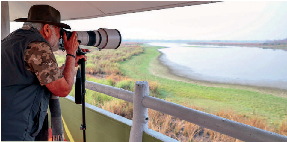
गुवाहाटी। प्रधानमंत्री नरेंद्र मोदी शनिवार को असम के काजीरंगा नेशनल पार्क में जंगल सफारी के लिए पहुंचे। यहां उन्होंने जीप से काजीरंगा की प्राकृतिक खूबसूरती को देखा। इसके बाद पीएम ने हाथी की सवारी भी की। प्रधानमंत्री ने यहां नेशनल पार्क की सुरक्षा में तैनात पुलिसकर्मियों से भी मुलाकात की।