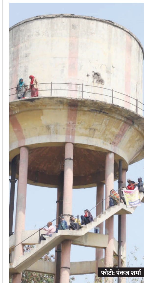
जयपुर। नेक्सा एवरग्रीन घोटाले को लोग पानी की टंकी पर चढ़ गए। उनका आरोप है कि 16 महीने से ज्यादा समय हो गया है, अभी तक अपराधी गिरफ्तार नहीं किए गए हैं। पुलिस ने बस कुछ अपराधियों को गिरफ्तार कर अपनी जिम्मेदारी से पल्ला झाड़ लिया। इन लोगों ने 14 महीने में पैसे डबल करने का लालच दिया था, जिसमें फौजी पुलिस और मध्य वर्गीय किसान गरीब सब लोगों ने पैसे इन्वेस्ट किए थे।