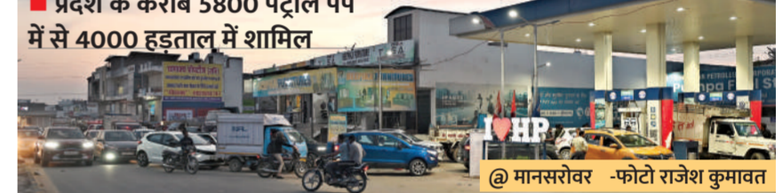
जयपुर। पेट्रोल डीलर्स की रविवार से शुरू हो रही हड़ताल के कारण शनिवार शाम लगी कतार से रोड जाम।

रविवार सुबह 6 बजे से 48 घंटे की स्ट्राइक, करेंगे सचिवालय का घेराव