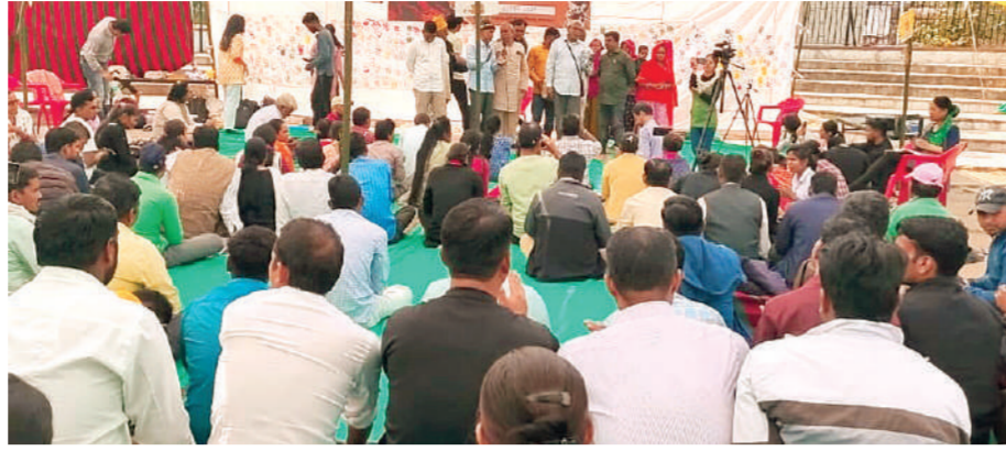
को आधी पेंशन मिलती है, वैसे ही असंगठित क्षेत्र के सभी कामगारों और किसानों को न्यूनतम मजदूरी की आधी पेंशन दी जाए। उन्होंने कहा कि देश के मजदूर और किसान का देश को बनाने में महत्वपूर्ण योगदान है इसलिए इन्हें भी सरकारी कर्मचारियों की तरह पेंशन दी जाए।