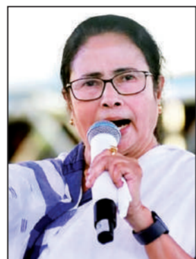
बातचीत के दौरान कहा कि प्रवर्तन निदेशालय (ईडी) ने जनवरी में