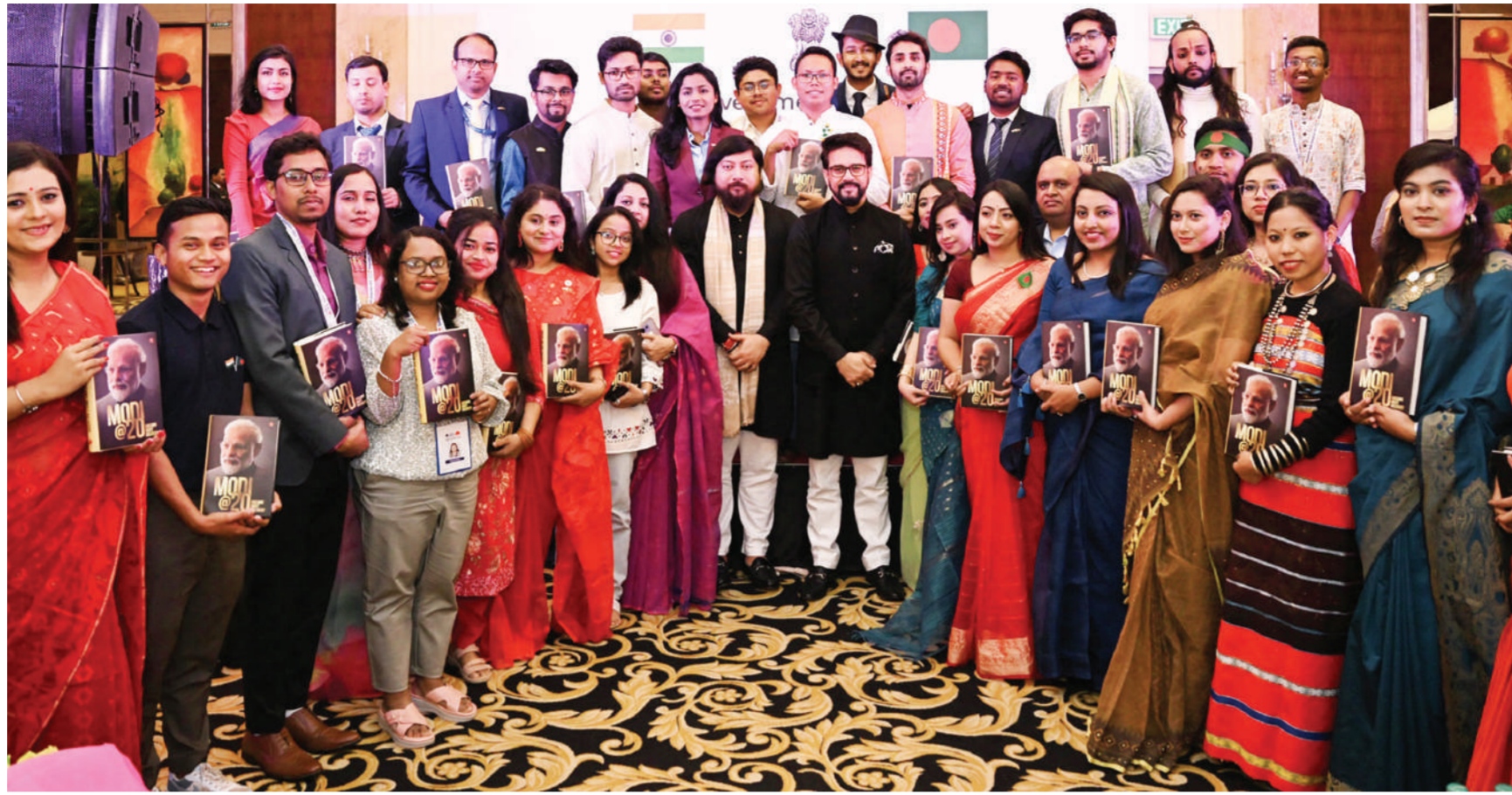
नई दिल्ली। बांग्लादेश से भारत की यात्रा पर आए युवाओं के 100 सदस्यीय प्रतिनिधिमंडल ने रविवार को नई दिल्ली में सूचना एवं प्रसारण व युवा मामलों के मंत्री अनुराग ठाकुर से भेंट की।