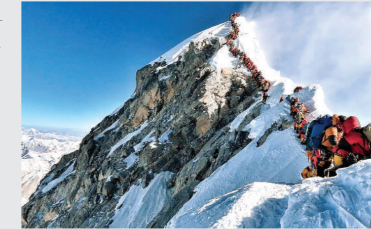
लोगों द्वारा सागरमाथा के नाम से जाना जाता है, जिसका अर्थ स्वर्ग का शीर्ष होता है। नेपाल के इतिहासविद रहे बाबूराम आचार्य द्वारा 1930 में यह नाम रखा गया था।

सस्ता है परमिट माउंट एवरेस्ट के जिस शिखर पर चढ़ाई करनी होती वो रास्ता नेपाल से होकर जाता है। खास बात ये है कि माउंट एवरेस्ट का नेपाल की अर्थव्यवस्था में भी योगदान है। यहां स्थानीय लोगों को रोजगार भी मिलता है। नेपाल सरकार भारतीय नागरिकों को 1500 नेपाली रुपए में एंटी परमिट दे देती है लेकिन इसकी चढ़ाई करने में लाखों रुपए का खर्च आ जाता है। अब आपको बता दें कि दुनियाभर में माउंट एवरेस्ट के नाम से जाना जाने वाले एवरेस्ट पर्वत को नेपाल में स्थानीय