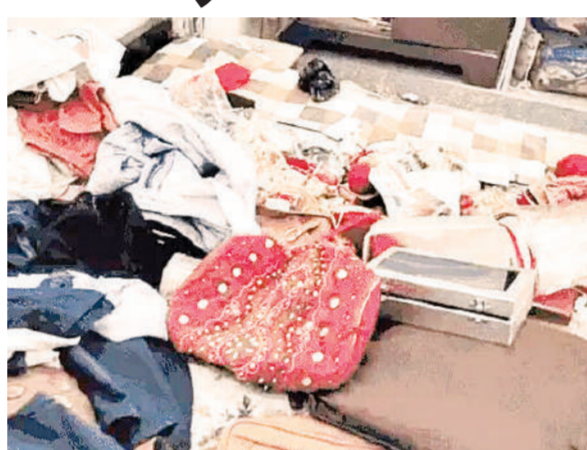
पुलिस सीसीटीवी व लोगों से पूछताछ में जुटा रही है जानकारी

चोर मकान के ताले तोड़ कर अंदर घुसे और चोरी की वारदात को अंजाम दिया। चोर मकान के अंदर बने कमरों के ताले तोड़ कर अलमारी में रखे 18 लाख रुपए के सोने-चांदी के जेवर व 60 हजार का कैश चोरी कर भाग गए।