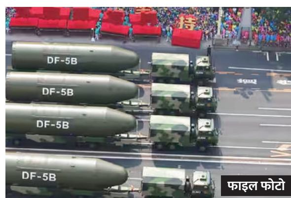
तक 1 हजार से अधिक परमाणु हथियार बनाने का लक्ष्य है। इनमें से अधिकांश की तैनाती भी जल्द ही सुनिश्चित की जाएगी। चीन

एजेंसी। नई दिल्ली। दुनिया की सबसे बड़ी महाशक्ति बनने की दौड़ में जुटा चीन अपने परमाणु जखीरे को तेजी से बढ़ा रहा है। इसके साथ ही वह अपनी सेना पीएलए को मजबूत बनाने में जुटा है। मीडिया रिपोर्टों के अनुसार चीन के पास वर्तमान में करीब 500 परमाणु हथियार हैं। यही नहीं चीनी सेना भविष्य में परमाणु हथियारों के और अधिक का उत्पादन करने पर जोर दे रही है। हाल ही में जारी हुई बुलेटिन ऑफ द एटॉमिक साइंटिस्ट्स की एक रिपोर्ट में इन बातों का खुलासा हुआ है। एक रिपोर्ट के अनुसार अनुमान है कि चीन का वर्ष 2030