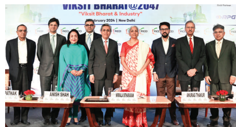
नई दिल्ली। केंद्रीय वित्त मंत्री निर्मला सीतारमण और सूचना व प्रसारण मंत्री अनुराग ठाकुर मंगलवार को नई दिल्ली में विकसित भारत@2047-विकसित भारत और उद्योग विषय पर अयोजित राष्ट्रीय सम्मेलन में शामिल हुए।