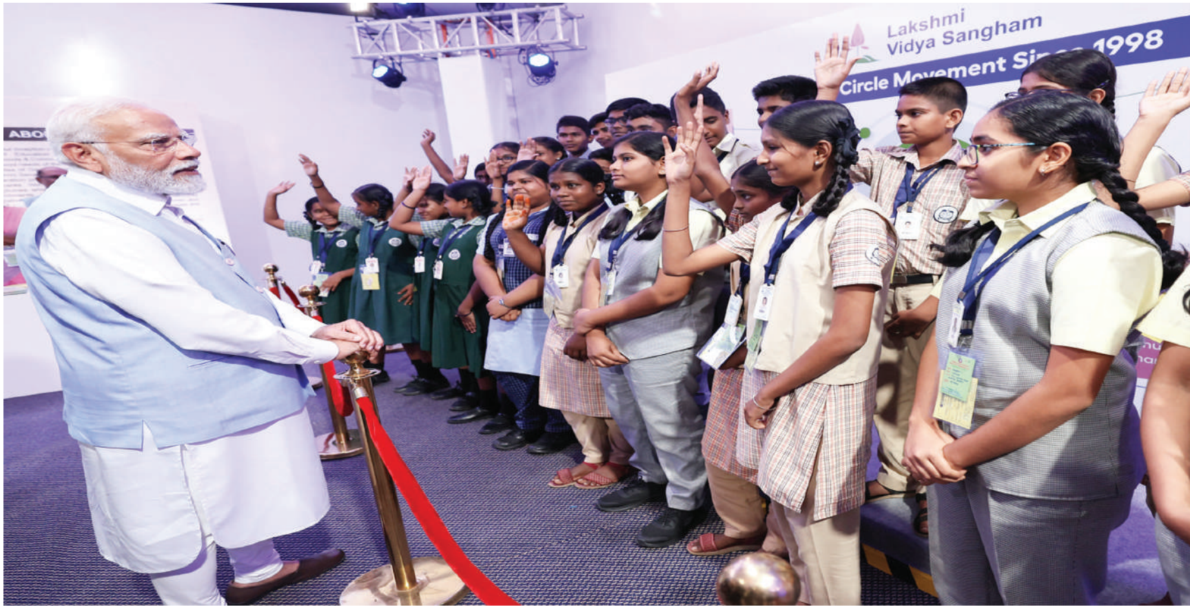
मदुरै। प्रधानमंत्री नरेंद्र मोदी मंगलवार को तमिलनाडु के मदुरै में 'क्रिएटिंग द फ्यूचर - डिजिटल मोबिलिटी फॉर ऑटोमोटिव एमएसएमई एंटरप्रेन्योर' कार्यक्रम में शामिल हुए। इस दौरान प्रधानमंत्री ने स्कूली विद्यार्थियों से बातचीत की।