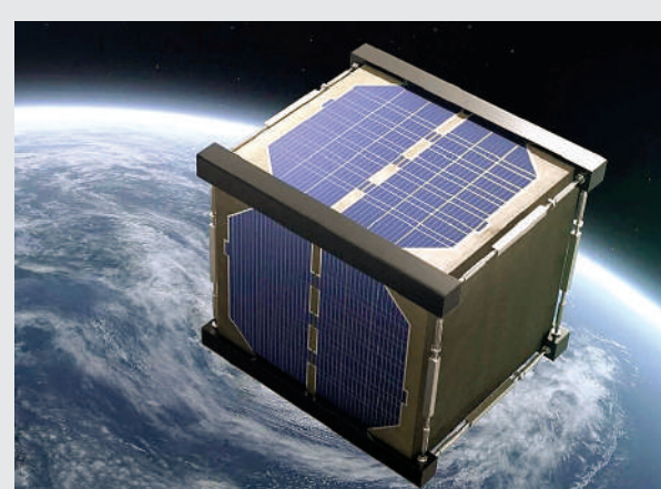
जाना थी जो लॉन्चिंग के दबाव को भी झेल पाए और पृथ्वी के चक्कर लगाते समय बदलते तापमान में भी खराब ना हो।

बायोडिग्रेडेबल होने की वजह से लकड़ी पर्यावरण के अनुकूल है। बायोडिग्रेडेबल चीजें नेचुरल तरीके से प्रकृति में मिलकर नष्ट हो जाती हैं और पर्यावरण को खराब नहीं करती। इसी आइडिया पर क्योटो के शोधकर्ता काफ़ी समय से लकड़ी की सैटेलाइट पर काम कर रहे हैं। इस तरह के स्पेसक्राफ्ट में सही लकड़ी का चयन करना बेहद जरूरी है। इसके लिए अलग-अलग किस्म की लकड़ियों को जांचा गया। एक ऐसी लकड़ी को चुना