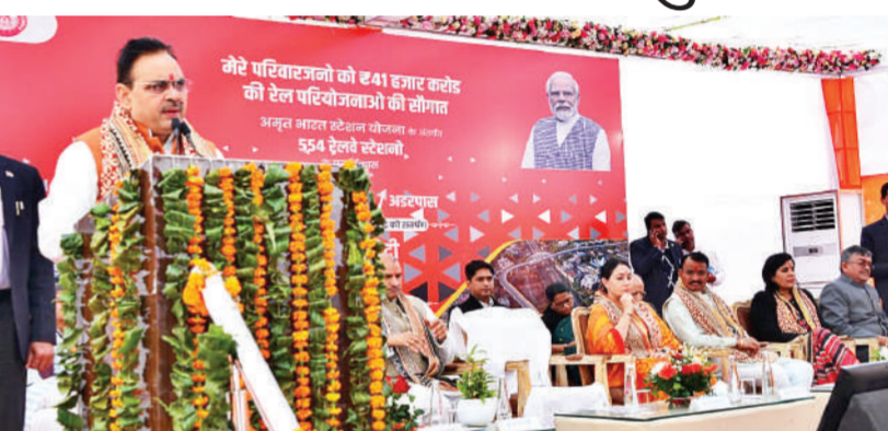
बेधड़क | जयपुर