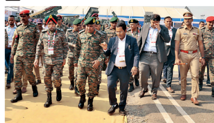
पुणे। सेना अध्यक्ष जनरल मनोज पांडे ने सोमवार को पुणे में अंतरराष्ट्रीय प्रदर्शनी सेंटर में आयोजित डिफेंस एक्सपो-2024 का दौरा कर वहां प्रदर्शित हथियार प्रणाली का अवलोकन किया।