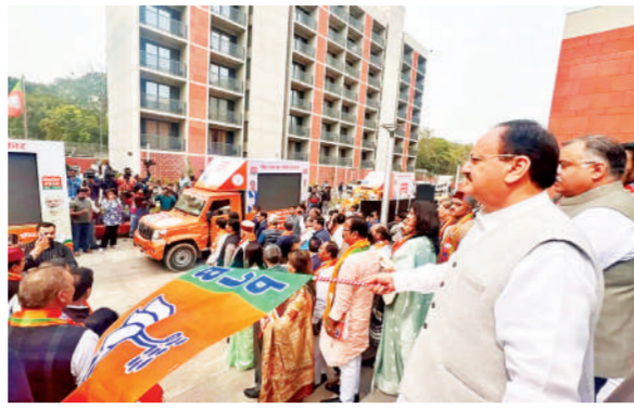
देश की प्रगति के लिए प्रधानमंत्री नरेंद्र मोदी द्वारा किए गए कार्यों और भारत को एक विकसित देश बनाने के लिए इस 'अमृत काल' में किए

सुझाव इकट्ठा करेगी। उन्होंने इस बात पर जोर दिया कि लोकतांत्रिक प्रक्रिया में नागरिकों की भागीदारी सुनिश्चित करना भाजपा का दृष्टिकोण है। वे वैन प्रधानमंत्री नरेंद्र मोदी द्वारा किए गए कार्यों और भारत को एक विकसित देश बनाने के उनके दृष्टिकोण को उजागर करेंगे। नहुवा ने दिल्ली में पार्टी मुख्यालय में भाजपा संकल्प समिति की बैठक की अध्यक्षता की। नहुवा ने कहा कि वीडियो वैन के माध्यम से, भाजपा ने लोगों को