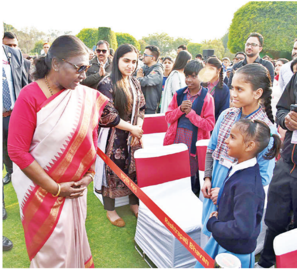
नई दिल्ली। राष्ट्रपति द्रौपदी मुर्मू ने सोमवार को राष्ट्रपति भवन के अमृत उद्यान में दिव्यांगजनों के लिए 'परपल उत्सव' का उद्घाटन किया। 10 हजार से अधिक दिव्यांगजन अपने अनुरक्षकों के साथ कार्यक्रम में शामिल हुए। राष्ट्रपति ने दिव्यांग जनों से बातचीत की। वहीं, दिव्यांगजनों की ओर से सांस्कृतिक कार्यक्रम प्रस्तुत किए गए।