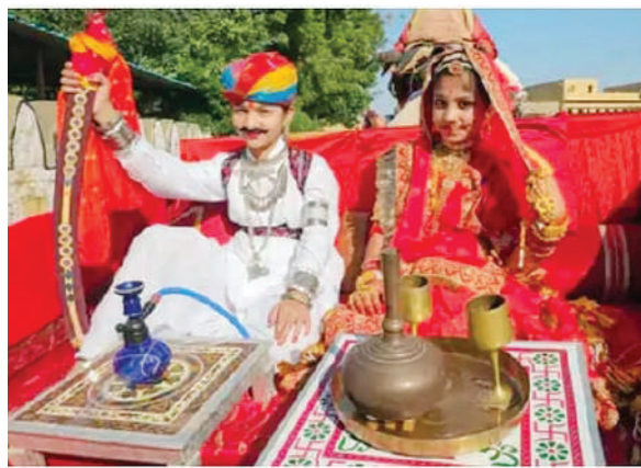
लेकर स्वर्णनगरी जैसलमेर में मनमोहक सजावट की गई है।

बेधड़क। जैसलमेर जिले में इंटरनेशनल डेजर्ट फेस्टिवल की शुरुआत गुरुवार को शोभायात्रा के साथ हुई। सुबह 8.30 बजे सोनार दुर्ग स्थित नगर आराध्य भगवान लक्ष्मीनाथजी के मंदिर में आरती की गई। इसके बाद 9.30 बजे गड़ीसर झील से सोनार दुर्ग होते हुए पूनम सिंह स्टेडियम तक शोभायात्रा निकाली गई।