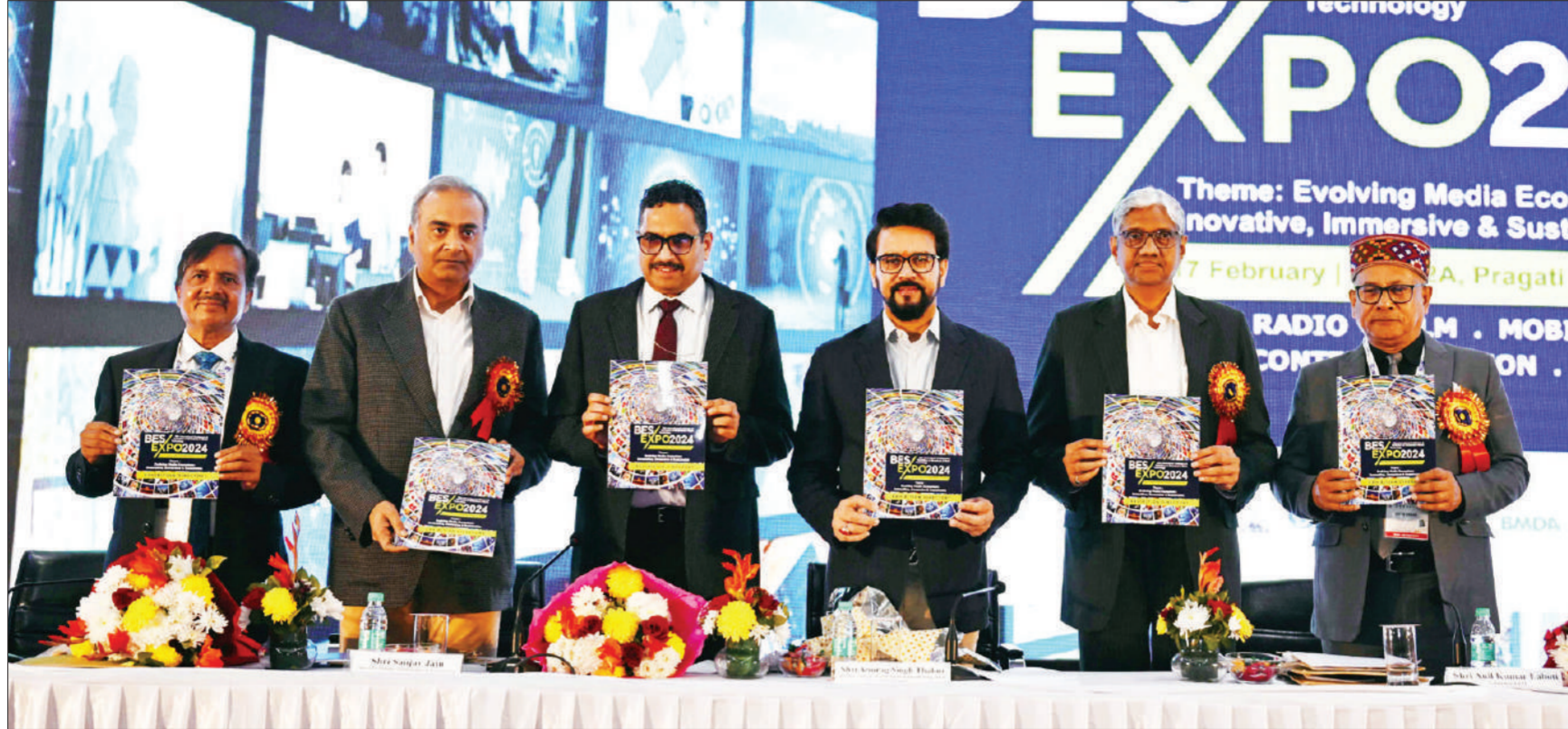
नई दिल्ली। केंद्रीय सूचना एवं प्रसारण मंत्री अनुराग ठाकुर ने गुरुवार को नई दिल्ली में प्रसारण और मीडिया प्रौद्योगिकी पर आयोजित 28वें अंतरराष्ट्रीय सम्मेलन एवं प्रदर्शनी का उद्घाटन किया। उद्घाटन सत्र के दौरान दर्शकों को संबोधित करते हुए केंद्रीय मंत्री अनुराग ठाकुर ने कहा कि सूचना एवं प्रसारण मंत्रालय देश के प्रसारण उद्योग का एक दृढ़ संरक्षक रहा है, जिसने इसे परिवर्तन की बयारों के बीच समझदारी और दूरदर्शिता के साथ संचालित किया है। इसने सार्वजनिक सेवा प्रसारण को बढ़ावा देने, समावेशी नीतियों को डिजाइन व लागू करने, मीडिया से जुड़ी जागरूकता पहल और प्रसारण एवं मीडिया उद्योग में निजी भागीदारी को प्रोत्साहित करने में अहम भूमिका निभाई।