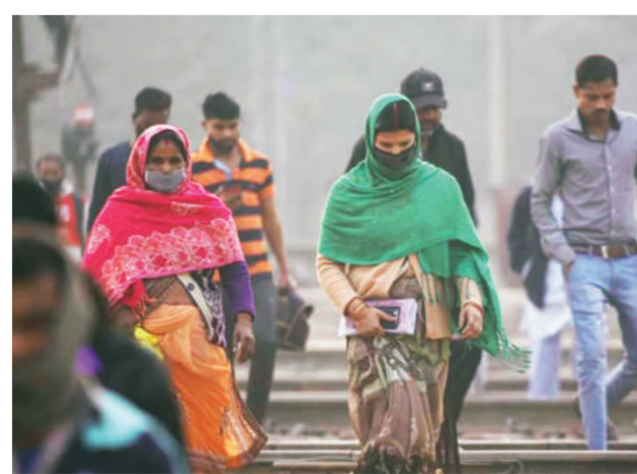
के वैज्ञानिकों का मानना है कि इस दौरान एक बार फिर से तापमान में गिरावट दर्ज हो सकती है। यह मौसम शुक्रवार से पश्चिम विक्षोभ की सक्रियता के चलते बदलने जा रहा है। इसी बदलने वाले मौसम के अनुमान पर पूरे उत्तर भारत में ऑरेंज अलर्ट जारी कर दिया गया है।

एजेंसी। नई दिल्ली। अगले 36 से 48 घंटे के भीतर उत्तर भारत में मौसम एक बार फिर तेजी से बदलने जा रहा है। मौसम विभाग के अनुमान के मुताबिक पंजाब, हरियाणा, हिमाचल प्रदेश, जम्मू कश्मीर, चंडीगढ़ और उत्तर प्रदेश समेत दिल्ली एनसीआर के हिस्सों में न सिर्फ तेज बारिश होने वाली है, बल्कि पहाड़ों पर भी भारी बर्फबारी होने का अनुमान लगाया जा रहा है। मौसम विभाग