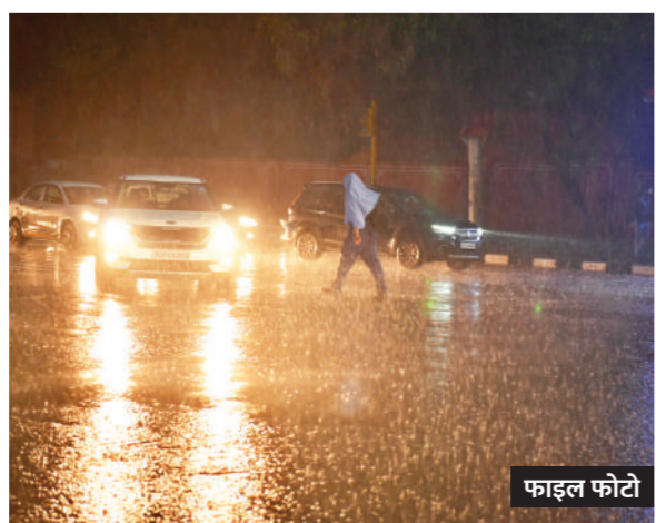
हघटनाक्रम पर करीब से नजर रख रहे भारत के मौसम वैज्ञानिकों ने

एजेंसी। नई दिल्ली। पिछले साल अल- नीनो का जबरदस्त असर दिखा था। हालांकि, इस साल जून तक अल नीनो की स्थिति खत्म हो जाएगी। इस साल काफी अच्छी बारिश होने की उम्मीद जताई जा रही है। कम से कम दो वैश्विक जलवायु एजेंसियों ने पिछले सप्ताह घोषणा की थी कि अल नीनो की स्थिति कमजोर बनती जा रही है।