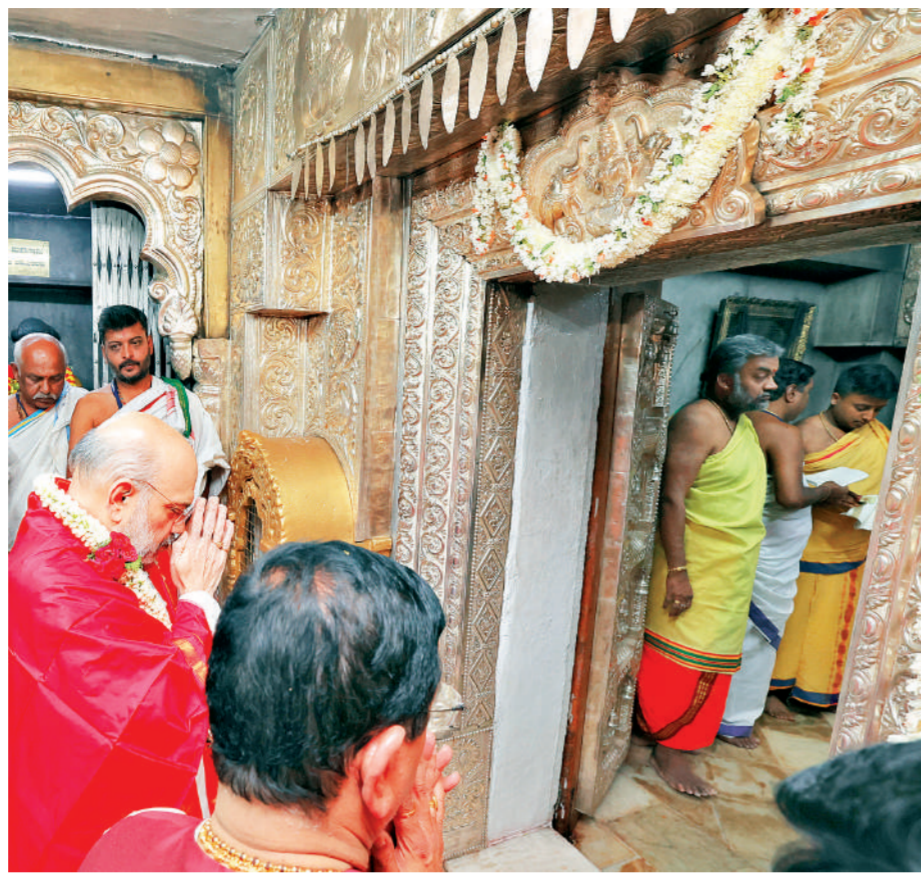
मैसूरु केंद्रीय गृह मंत्री अमित शाह ने रविवार को कर्नाटक के दौरे के दौरान मैसूरु में मां चामुंडा के मंदिर में पूजा अर्चना की। शाह ने अपनी यात्रा के दौरान कई कार्यक्रमों में हिस्सा लिया और बच्चों से भी मुलाकात की।