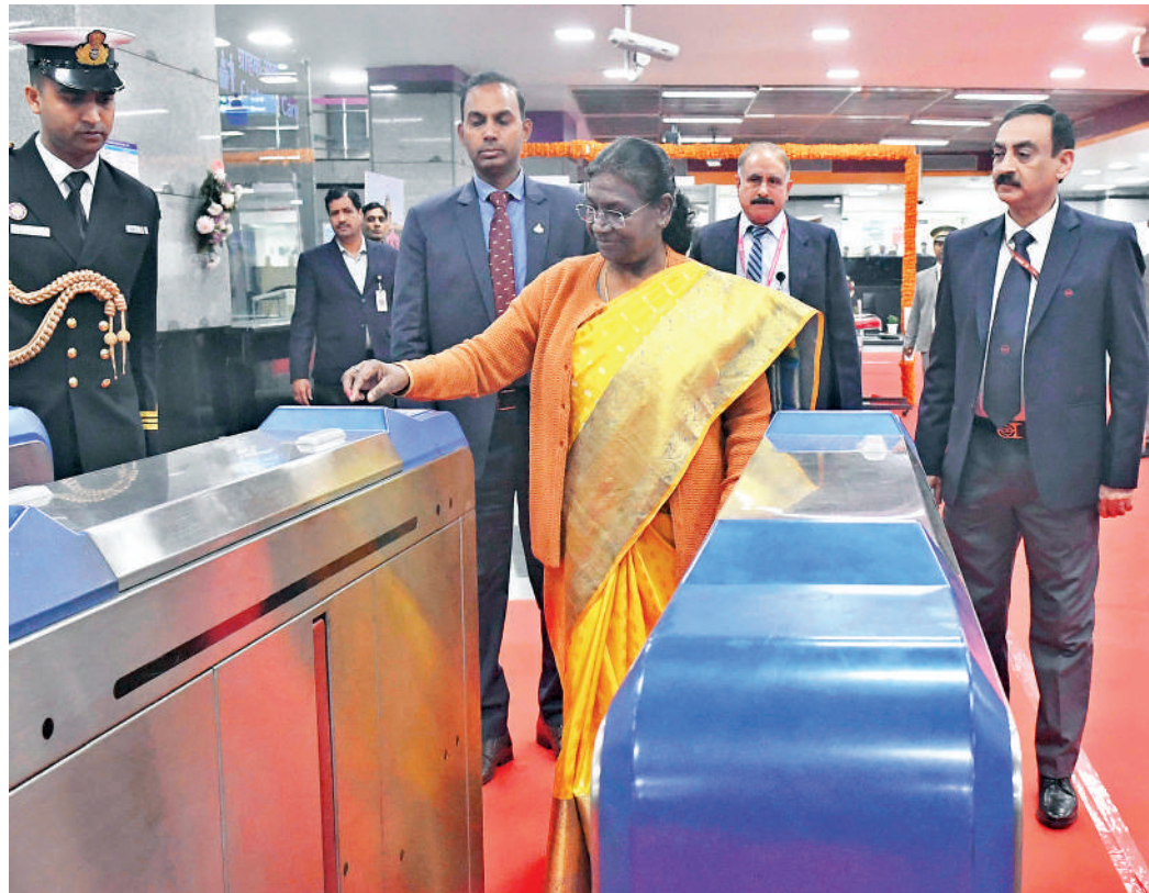
नई दिल्ली। राष्ट्रपति द्रौपदी मुर्मू ने बुधवार को दिल्ली मेट्रो में यात्रा की। राष्ट्रपति केन्द्रीय सचिवालय से मेट्रो में सवार हुईं। उन्होंने मेट्रो से नेहरू प्लेस तक का सफर तय किया। इस दौरान उन्होंने विद्यार्थियों से बातचीत भी। इससे पहले, राष्ट्रपति ने केन्द्रीय सचिवालय पर मेट्रो के परिचालन का जायजा भी लिया। चित्र में मेट्रो में सफर के लिए जाती राष्ट्रपति और सफर के दौरान छात्राओं से चर्चा।