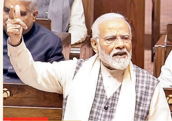
अंग्रेजों से प्रभावित रही कांग्रेस

आए हैं, लेकिन मेरी आवाज को आप दबा नहीं सकते हैं। देश की जनता ने इस आवाज को ताकत दी है। देश की जनता के आशीर्वाद से यह आवाज निकल रही है। आप पिछली बार तैयारी से आए थे, इसलिए मैं भी इस बार पूरी तैयारी से आया हूँ। मल्लिकार्जुन खरगे की ओर देखते हुए पीएम ने कहा कि आप पिछली बार भी इतनी शांति से रहे होते तो कितना मजा आता। पीएम मोदी ने राहुल गांधी पर तीखा तंज करते हुए कहा कि कांग्रेस ने अपने युवराज को एक स्टार्टअप बनाकर दिया है, अभी वो नॉन स्टार्टर है। न तो लिफ्ट हो रहा है, न लॉन्च हो रहा है।