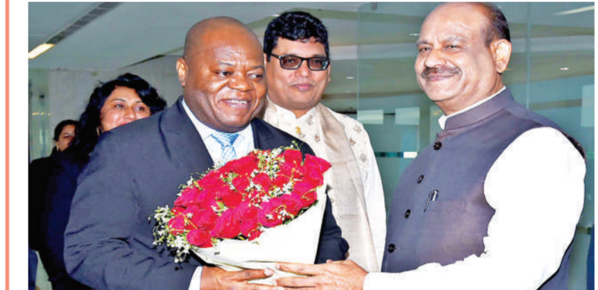
नई दिल्ली। सूरीनाम की नेशनल असेंबली के अध्यक्ष मारिनस बी के नेतृत्व में वहां का एक संसदीय प्रतिनिधिमंडल भारत के दौरे पर आया हुआ है। प्रतिनिधिमंडल ने सोमवार को नई दिल्ली में लोकसभा अध्यक्ष ओम बिरला से मुलाकात की।