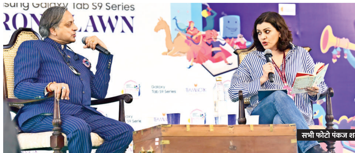
सरकार में आएं तब बताएं-विपक्ष का नेता कौन?

बेधड़क | जयपुर कांग्रेस के चरिष्ठ नेता शशि थरूर ने कहा कि मीडिया मूल मुद्दों और जनता की समस्याओं से भटक गई है। मीडिया सिर्फ सरकार के लिए नेरेटिव सेट करने का काम कर रही है। न्यायपालिका में भी हालत खराब हो गए हैं। वे लिटरेचर फेस्ट में आयोजित सेशन में बोल रहे थे।