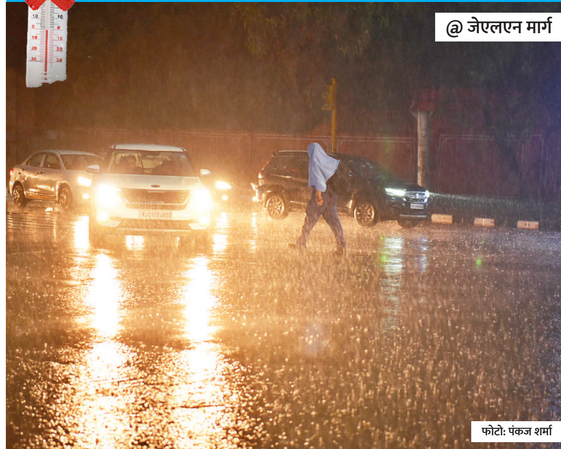
@ जेलएन मार्ग