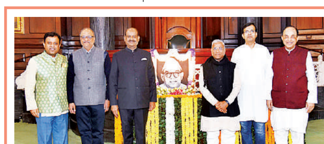
नई दिल्ली। लोकसभा के पूर्व अध्यक्ष एमए अयंगर को रविवार को उनकी जयंती के अवसर पर नई दिल्ली में पुराने संसद भवन में लोकसभा अध्यक्ष ओम बिरला व अन्य नेताओं ने नमन किया और उनके कार्यों को याद किया

नई दिल्ली। मेघालय में रविवार को भूकंप के तेज झटके महसूस किए गए। राष्ट्रीय भूकंप विज्ञान केंद्र के अनुसार रविवार दोपहर 2:37 बजे मेघालय के पूर्वी गारो हिल्स में भूकंप आया। रिक्टर स्केल पर इसकी तीव्रता 3.5 मापी गई।