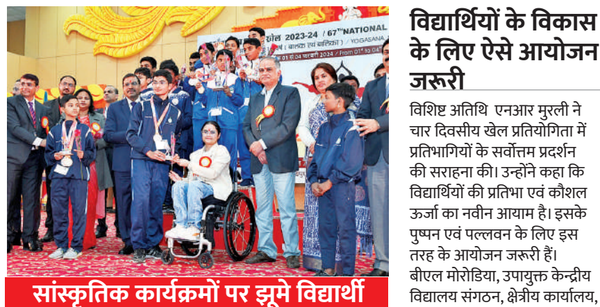
सांस्कृतिक कार्यक्रमों पर झूमे विद्यार्थी