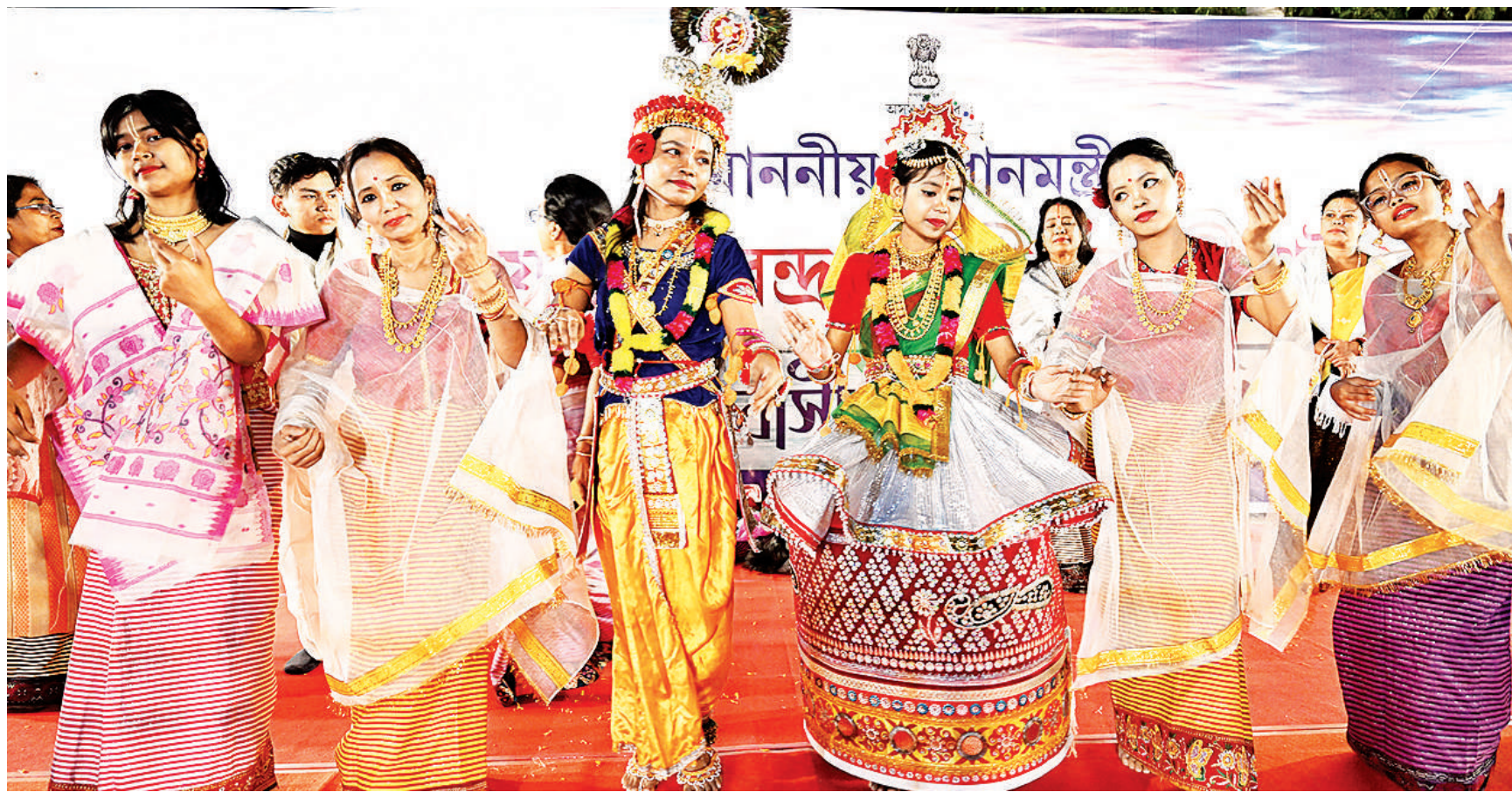
गुवाहाटी। प्रधानमंत्री नरेंद्र मोदी शनिवार और रविवार को दो दिन असम के दौरे पर रहे जहां उन्होंने कई कार्यक्रमों में भाग लिया। वे शनिवार शाम गुवाहाटी पहुंचे थे। इस मौके पर उनका शानदार स्वागत किया गया। पीएम ने स्वागत कार्यक्रम में नृत्य की प्रस्तुति देते कलाकार।