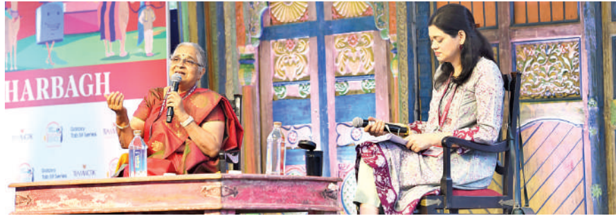
मैं बरसात आ जाने के बाद भी लोग हिले नहीं, भीगते हुए उन्हें तल्लीनता से सुनते रहे। इंसोसिस के फाउंडर नारायण मूर्ति की पत्नी और अब तक 25 किताबें लिख चुकीं सुधा मूर्ति ने कहा कि कहीं पर लोग झगड़ रहे

बेधड़क | जयपुर जानी-मानी लेखिका और समाज सेवी सुधा मूर्ति ने कहा कि मुझे लोगों और उनकी जिंदगी के बारे में जानने में बहुत ज्यादा दिलचस्पी है। इसके पीछे मेरा मानना है कि कोई व्यक्ति सिर्फ एक व्यक्ति नहीं है, बल्कि पूरी किताब है। उन्होंने कहा कि मैं खुश या उदास होने पर नहीं लिखती हूँ। मैं इसलिए लिखती हूँ कि मैं कहानियां बताना चाहती हूँ। सुधा मूर्ति जयपुर लिटरेचर फेस्टिवल के चौथे दिन रविवार को कॉमन येट अन कॉमन सत्र में बात कर रही थीं। इस दौरान सुधा मूर्ति को सुनने-देखने के लिए लोगों की लाइन लगी रही। चलते सेशन