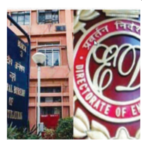
(4) के तहत दायर की गई है। इस धारा के तहत एजेंसी को किसी व्यक्ति को बुलाने का अधिकार मिला है। शिकायत में भारतीय दंड संहिता की धारा 174 का भी उल्लेख

एजेंसी। नई दिल्ली दिल्ली के मुख्यमंत्री अरविंद केजरीवाल के कथित शराब नीति घोटाले में पांचवें समन पर भी हाजिर न होने के एक दिन बाद शनिवार को प्रवर्तन निदेशालय ने अदालत का दरवाजा खटखटाया। ईडी ने शिकायत की है कि केजरीवाल पृष्ठताछ के लिए उपस्थित नहीं हुए। नई दिल्ली का राउज एवेन्यू कोर्ट 7 फरवरी को इस मामले की सुनवाई करेगा। दिल्ली की राऊज एवेन्यू अदालत में शनिवार को ईडी की शिकायत मनी लॉन्ड्रिंग एक्ट की धारा 63