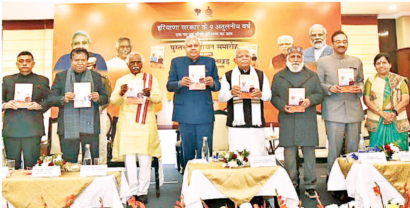
फरीदाबाद। उपराष्ट्रपति जगदीप धनखड़ ने शनिवार को फरीदाबाद जिले में सूरजकुंड मेले में ब हरियाणा सरकार के अतुल्य नौ वर्ष नामक पुस्तक का लोकार्पण किया। मगर किताब में ये भी बताया गया है कि कैसे हरियाणा सरकार ने इन चुनौतियों से पार पाकर विकास की राह पर आगे बढ़ी है।