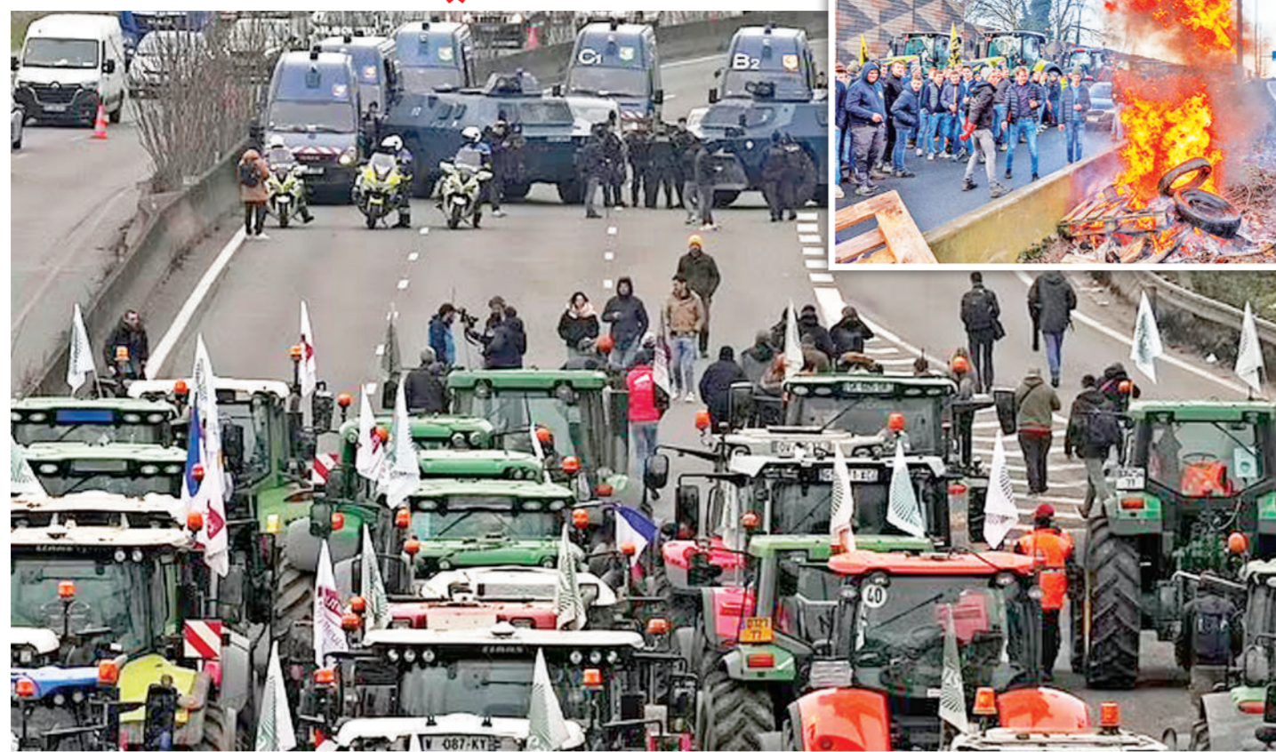
पेरिस। फ्रांसीसी किसानों का विरोध प्रदर्शन अब पेरिस तक पहुंच चुका है। किसानों के कोहराम के कारण चारों तरफ अराजकता मची है। किसान फसलों की कम कीमतों, हरित विनियमन और फ्री ट्रेड एग्रीमेंट पर तत्काल कार्रवाई की मांग कर रहे हैं। (इनसेट) बेल्जियम में राजमार्ग जाम कर टायर जलाते हुए किसान।