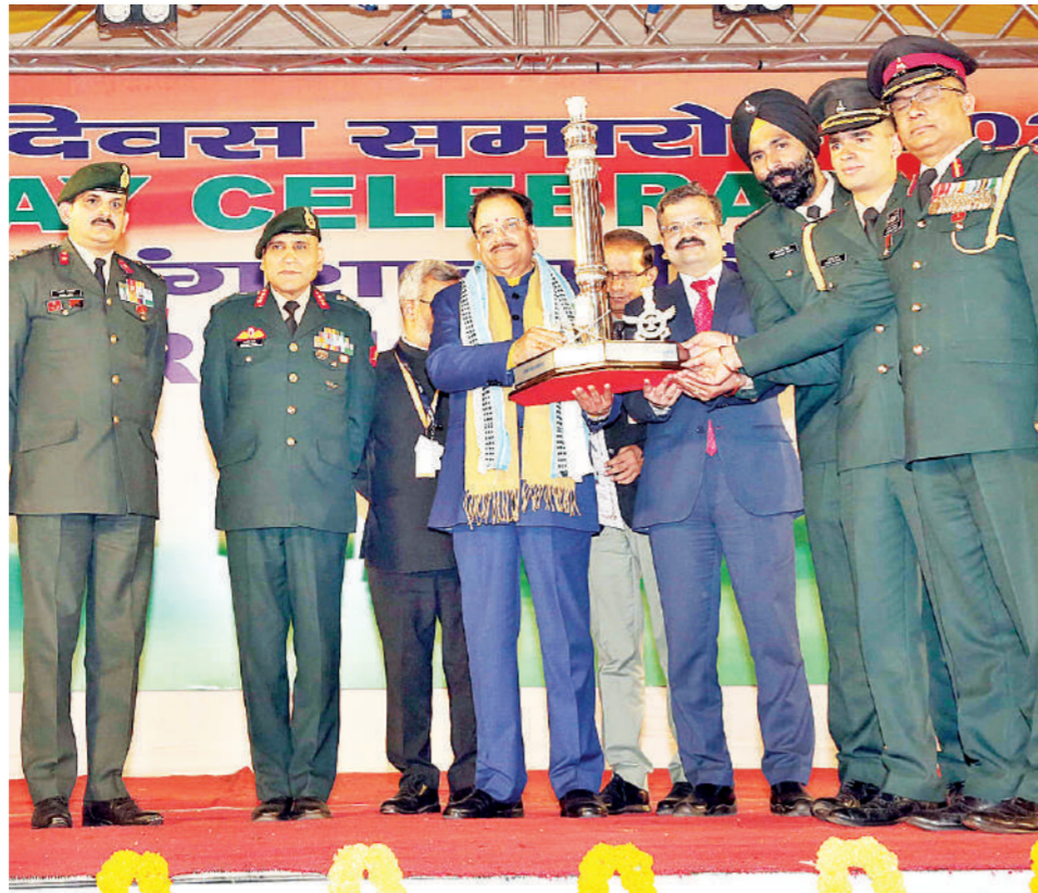
नई दिल्ली। रक्षा राज्य मंत्री अजय भट्ट ने मंगलवार को नई दिल्ली में आयोजित एक समारोह में गणतंत्र दिवस परेड के लिए बेस्ट मार्चिंग टुकड़ी और झांकी के पुरस्कार प्रदान किए। चित्र में अलग अलग वर्ग के विजेताओं को पुरस्कृत करते भट्ट। ओडिशा में महिला सशस्त्रिकरण के साथ ही राज्य के समृद्ध हस्तशिल्प और हथकरघा क्षेत्र को प्रदर्शित करने वाली राज्य की रंग-बिरंगी झांकी को पहला पुरस्कार मिला है।