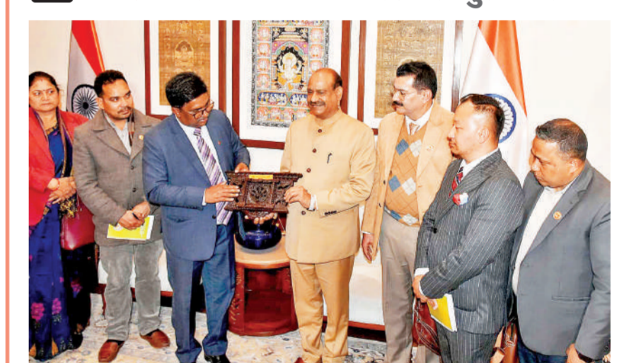
नई दिल्ली। नेपाल के एक संसदीय प्रतिनिधिमंडल ने बुधवार को नई दिल्ली में लोकसभा के अध्यक्ष ओम बिरला से मुलाकात की और विभिन्न मसलों पर चर्चा की।