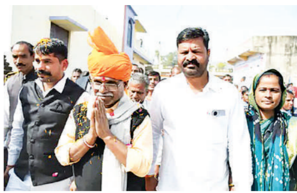
रहा है कि मंत्री खराड़ी रविवार को उदयपुर जिले की फलासिया पंचायत समिति के राजकीय उच्च माध्यमिक स्कूल के वार्षिकोत्सव समारोह में मुख्य अतिथि के तौर पर गए थे। इस अवसर पर बच्चों

बेधड़क। उदयपुर प्रदेश में भाजपा सरकार बनने के बाद जनजाति मंत्री बाबूलाल खराड़ी यूं तो अपने बयानों को लेकर चर्चा में रहे हैं, लेकिन इस बार उनकी चर्चा उनके अलग अंदाज को लेकर हो रही है। उनका एक वीडियो सोशल मीडिया पर सामने आया है। इसमें मंत्री खराड़ी राजकीय विद्यालय के वार्षिकोत्सव में चारपाई पर बैठकर डांस करते नजर आ रहे हैं। चारपाई के चारों तरफ पारंपरिक वेशभूषा पहने बच्चे भी डांस कर रहे हैं। बताया जा