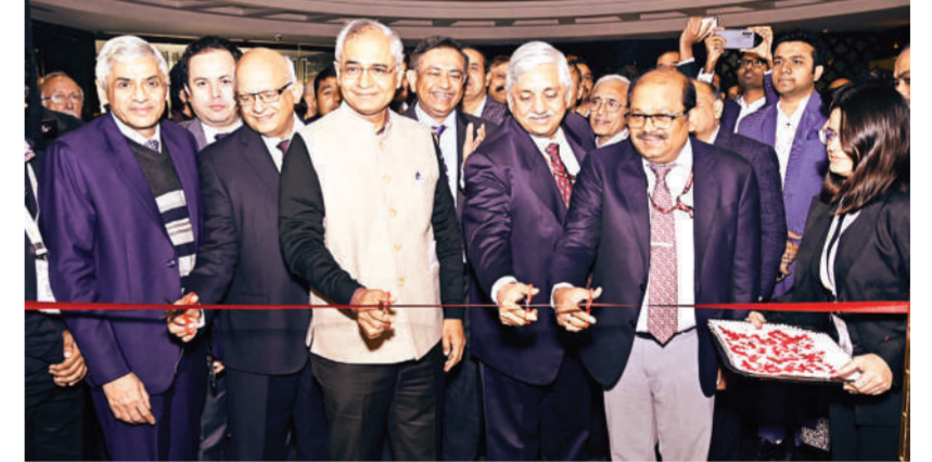
नई दिल्ली। राष्ट्रीय राजधानी दिल्ली में सोमवार को दो दिवसीय एक्सक्लूसिव इंटरनेशनल बिजनेस एक्सपो भारत टेलीकॉम 2024 का आयोजन किया गया। संचार मंत्रालय में सचिव डॉ. नीरज मित्तल ने इसका उद्घाटन किया।