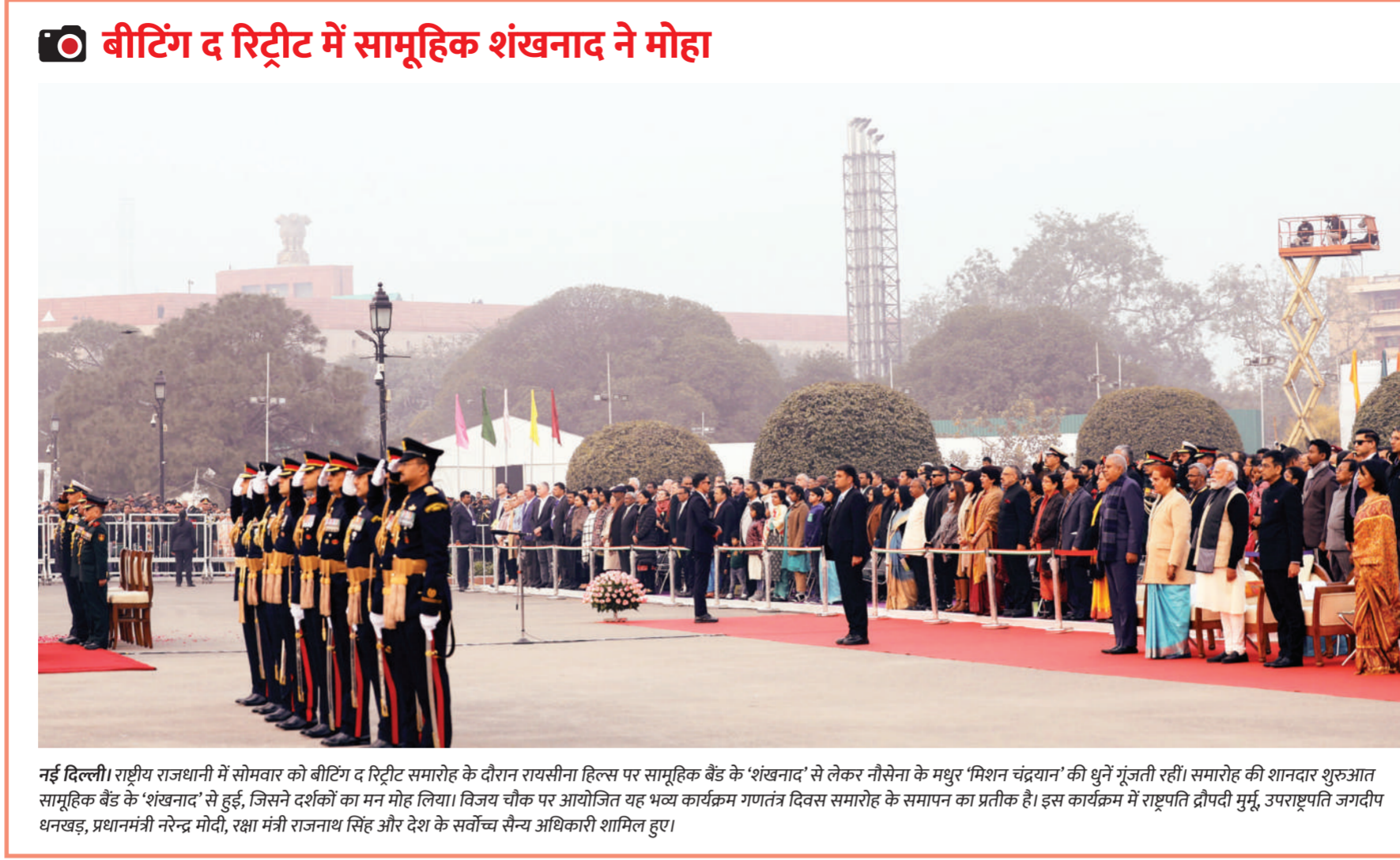
नई दिल्ली। राष्ट्रीय राजधानी में सोमवार को बीटिंग द रिट्रीट समारोह के दौरान रायसीना हिल्स पर सामूहिक बैंड के 'शंखनाद' से लेकर नौसेना के मधुर 'मिशन चंद्रयान' की धुनें गूंजती रही। समारोह की शानदार शुरुआत सामूहिक बैंड के 'शंखनाद' से हुई, जिसने दर्शकों का मन मोह लिया। विजय चौक पर आयोजित यह भव्य कार्यक्रम गणतंत्र दिवस समारोह के समापन का प्रतीक है। इस कार्यक्रम में राष्ट्रपति द्रौपदी मुर्मू, उपराष्ट्रपति जगदीप धनखड़, प्रधानमंत्री नरेन्द्र मोदी, रक्षा मंत्री राजनाथ सिंह और देश के सर्वोच्च सैन्य अधिकारी शामिल हुए।

नई दिल्ली। सेना प्रमुख जनरल मनोज पांडे ने सोमवार को कहा कि वास्तविक नियंत्रण रेखा (एलएसी) पर स्थिति स्थिर और संवेदनशील बनी हुई है। बीते एक साल में एलएसी के आसपास और अधिक टकराव के बिंदु नहीं देखे गए हैं। हमने मजबूत और संतुलित तैनाती की हुई है। जनरल पांडे ने एक साक्षात्कार में कहा, चीन के साथ सैन्य स्तर के साथ-साथ राजनयिक स्तर पर भी वार्ता और संवाद जारी है। अप्रैल, 2020 के बाद से दोनों देशों के बीच 20 उच्चस्तरीय सैन्य वार्ताएं और भारत-चीन सीमा मामलों पर वर्किंग मैकेनिज्म फार कंसल्टेशन एंड कोऑर्डिनेशन की 14 बैठकें हो चुकी हैं।