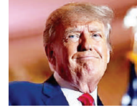
यौन उत्पीड़न और मानहानि के एक मामले में मैनहटन संघीय

न्यूयॉर्क में एक कोर्ट ने अमेरिका के पूर्व राष्ट्रपति डोनाल्ड ट्रंप के खिलाफ यौन उत्पीड़न व मानहानि के मामले में फैसला सुनाते हुए एक लेखिका को 692 करोड़ रुपए देने का आदेश दिया है। ये रकम लेखिका ई जीन कैरोल को मुआवजे के तौर पर दी जाएगी।