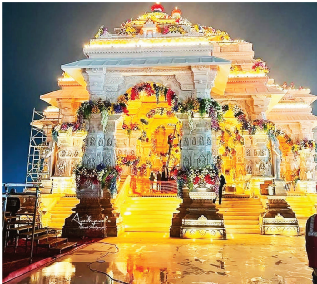
अयोध्या। अयोध्या में 22 जनवरी को राम मंदिर की प्राण प्रतिष्ठा से पूर्व मंदिर को सजाया जा रहा है। मंदिर को अंदर से फूलों से सुसज्जित किया गया है। वहीं, अलग-अलग तरह की प्रकाश व्यवस्था मंदिर को दर्शनीय बना रही है। मंदिर के भीतर के भव्य दृश्य।