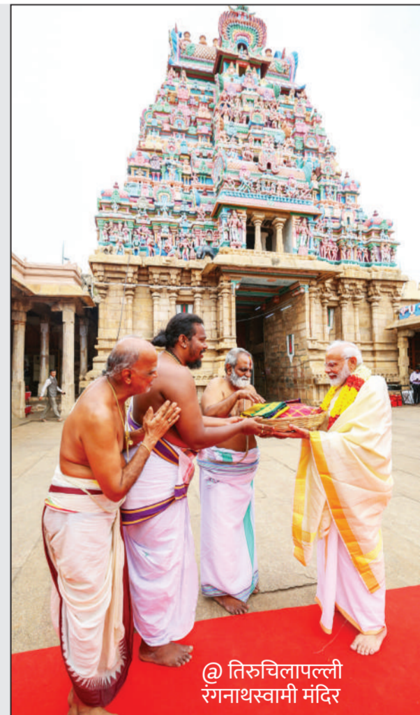
@ तिरुचिलापल्ली रंगनाथस्वामी मंदिर