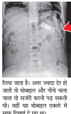
लिया जाता है। अगर ज्यादा देर हो जाती तो मोबाइल और नीचे चला जाता तो सर्जरी करनी पड़ सकती थी। वहीं यह मोबाइल एक्सरे में साफ दिखाई दे रहा था।