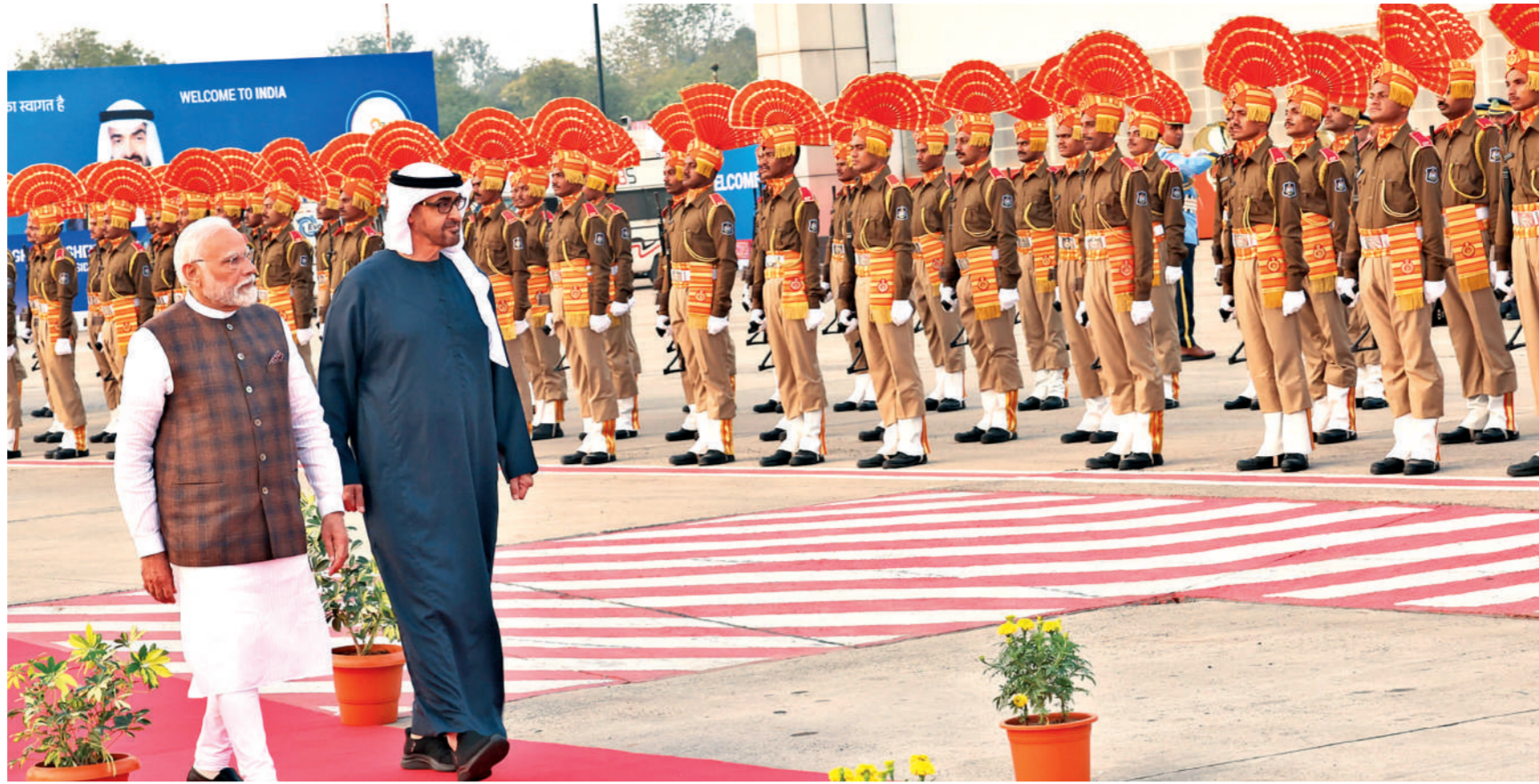
अहमदाबाद। प्रधानमंत्री ने मंगलवार को संयुक्त अरब अमीरात के राष्ट्रपति मोहम्मद बिन जायद अल नाहयान के अहमदाबाद पहुंचने पर उनका स्वागत किया। नाहयान वाइब्रेट गुजरात सम्मेलन में भाग लेने आए हैं। वे सम्मेलन में मुख्य अतिथि होंगे।