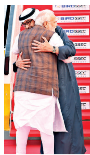
पर पहुंचने पर यूएई के राष्ट्रपति का गर्मजोशी से स्वागत किया। इससे पहले प्रधानमंत्री नरेंद्र मोदी

एजेंसी। अहमदाबाद गुजरात की राजधानी अहमदाबाद में बुधवार से शुरू हो रहे वाइब्रेट गुजरात समिट में भाग लेने के लिए संयुक्त अरब अमीरात के राष्ट्रपति शेख मोहम्मद बिन जायद अल नाहयान मंगलवार शाम अहमदाबाद पहुंचे। पीएम नरेंद्र मोदी ने यूएई के राष्ट्रपति की आगवानी की। बाद में दोनों नेता एक रोड शो में शामिल हुए।