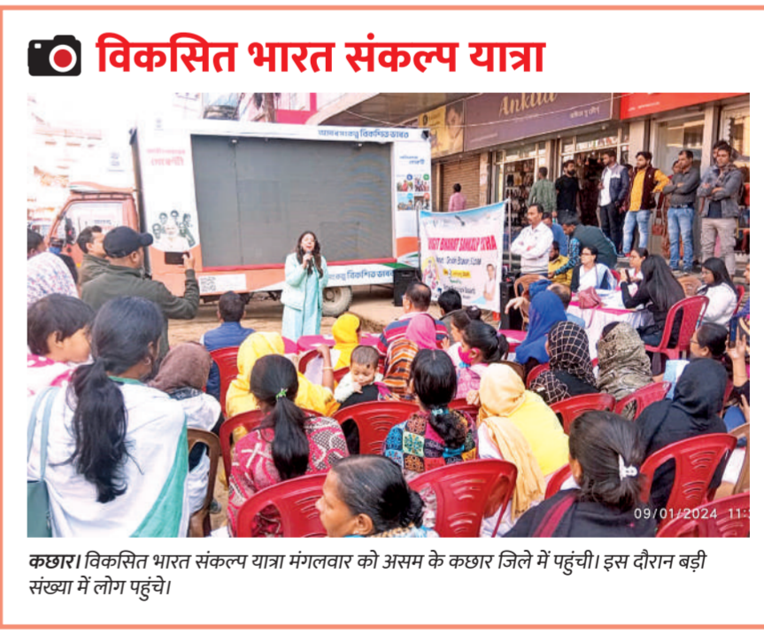
कछार। विकसित भारत संकल्प यात्रा मंगलवार को असम के कछार जिले में पहुंची। इस दौरान बड़ी संख्या में लोग पहुंचे।

आरोप है कि 2004 से 2009 तक कई लोगों को भारतीय रेल के विभिन्न जों में 'गुप्त डी' के पदों पर नियुक्त किया गया और इसके बदले में इन लोगों ने अपनी भूमि तत्कालीन रेल मंत्री लालू प्रसाद एवं ए.के. इंदोरासिस्टम्स प्राइवेट लिमिटेड को हस्तांतरित की थी।