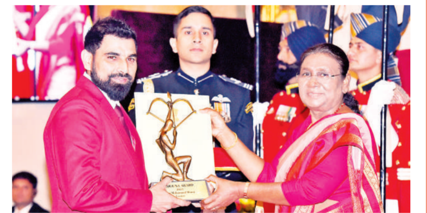
नई दिल्ली। साल 2023 में उत्कृष्ट प्रदर्शन करने वाले खिलाड़ियों को मंगलवार को खेल रत्न और अर्जुन अवॉर्ड से सम्मानित किया गया। राष्ट्रपति द्रौपदी मुर्मू ने क्रिकेट खिलाड़ी मोहम्मद शमी को अर्जुन अवॉर्ड से सम्मानित किया। उन्होंने अन्य खिलाड़ियों व कोच को भी पुरस्कार प्रदान किए।