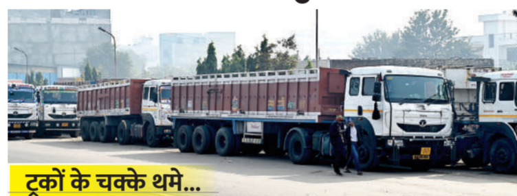
ट्रकों के चक्के थमे...