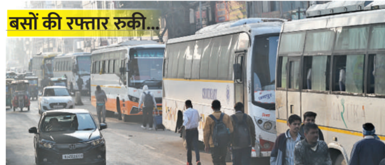
बसों की रफ्तार रुकी...