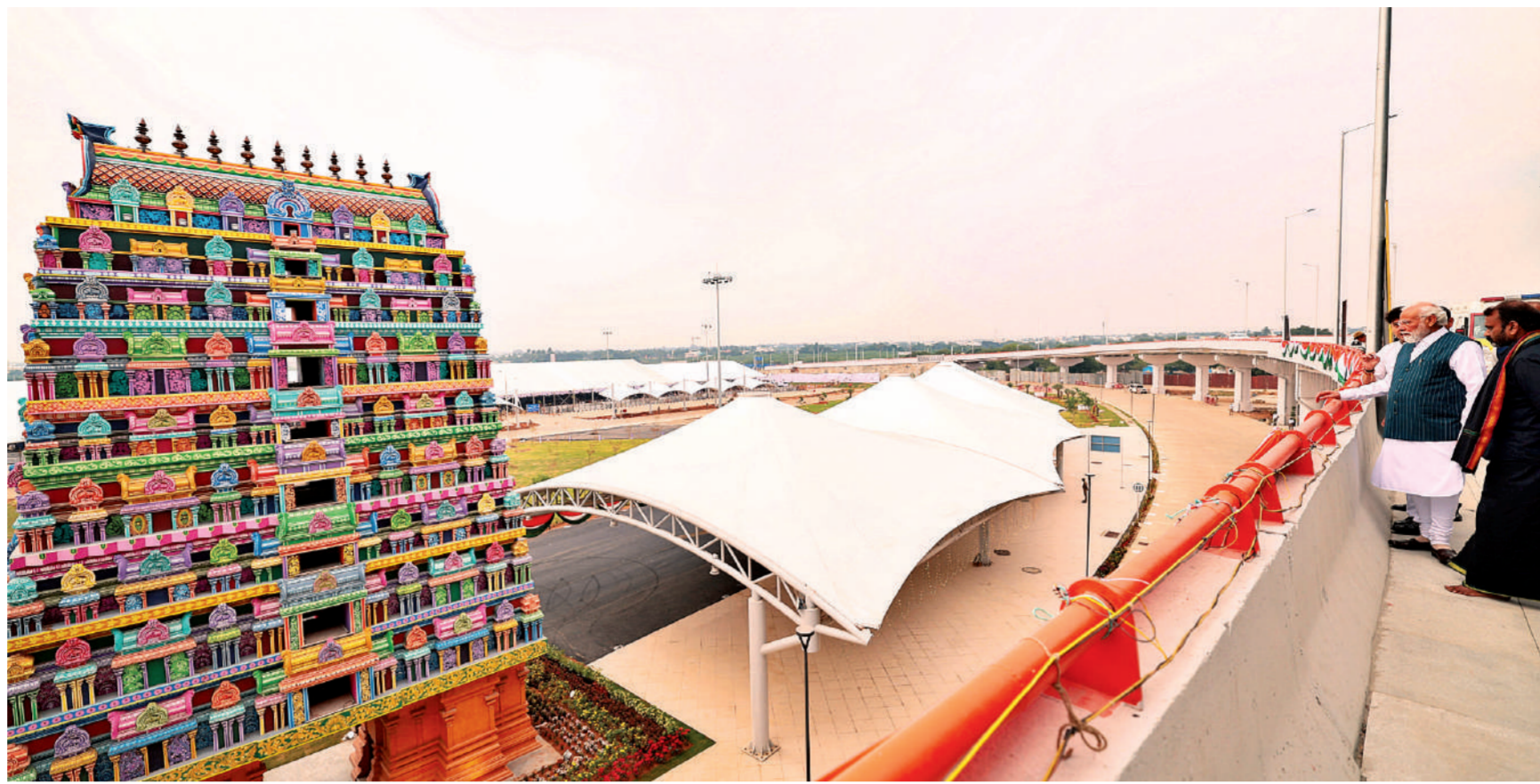
तिरुचिरापल्ली। चित्र में नजर आ रही यह इमारत किसी मंदिर की नहीं, तमिलनाडु के तिरुचिरापल्ली में अंतरराष्ट्रीय हवाई अड्डे के नए टर्मिनल भवन की है। प्रधानमंत्री नरेंद्र मोदी ने मंगलवार को इसका उद्घाटन और उसका अवलोकन किया।