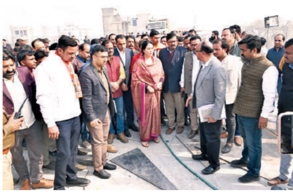
और निर्माण कार्य को दुरुस्त करने के निर्देश दिए। वहीं राज्यवर्धन ने अंडरपासों में पानी भरने पर जेडीए अधिकारियों को लताड़ लगाई।

मंगलवार को उपमुख्यमंत्री दीपा कुमारी और मंत्री राज्यवर्धन सिंह राठौड़ अपने-अपने क्षेत्र के दौरे पर रहे। डिप्टी सीएम ने जहां निर्माणधीन झोटवाड़ा एलिवेटेड का निरीक्षण किया, वहीं मंत्री राठौड़ ने जेन सी बाईपास के अंडरपासों का दौरा किया। दीपा कुमारी ने निरीक्षण के दौरान मौके पर ही अधिकारियों को घटिया निर्माण करने पर फटकार लगाई