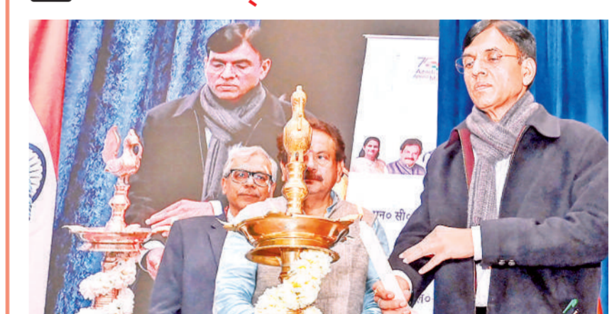
नई दिल्ली। केंद्रीय स्वास्थ्य मंत्री मनसुख मांडविया मंगलवार को नई दिल्ली में एनसीडीसी के विभिन्न प्रोजेक्ट्स का उद्घाटन व शिलान्यास किया। इस मौके पर उन्होंने दीप प्रज्वलित कर कार्यक्रम की शुरुआत की। स्वास्थ्य राज्यमंत्री एसपी सिंह बघेल भी इस अवसर पर मौजूद थे।