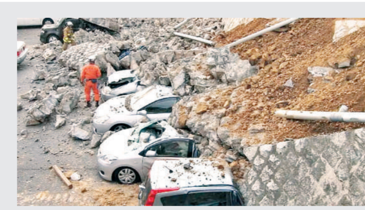
प्लेट हर साल कुछ सेकेंड ही बढ़ती हैं, लेकिन जब भूकंप आता है तो ये कई मीटर तक बढ़ जाती हैं। रिंग ऑफ फायर में आने वाले भूकंप की जद में अकेले जापान ही नहीं है, बल्कि रूस, इंडोनेशिया, न्यूजीलैंड, अंटार्कटिका, कनाडा, फिलीपींस, मैक्सिको, कोस्टा रिका, पेरू, इक्वाडोर, चिली बोलिविया भी भूकंप की जद में हैं।

क्या होती हैं टेक्टोनिक प्लेट्स जब धरती के कोर से कोई ऊर्जा निकलती है तो उससे टेक्टोनिक प्लेटें हिलने को मजबूर हो जाती हैं। रिंग ऑफ फायर टेक्टोनिक प्लेटों का जंक्शन है, इसीलिए यहां प्लेटों में घर्षण की संभावना ज्यादा रहती है। इसीलिए यहां आने वाला भूकंप तीव्र होता जाता है। टेक्टोनिक प्लेटों से निकली ऊर्जा जब तक भूकंप बना रहता है। यदि इसका केंद्र समुद्र में हो तो विनाशकारी सुनामी आती है। खास बात ये है कि ये टेक्टोनिक