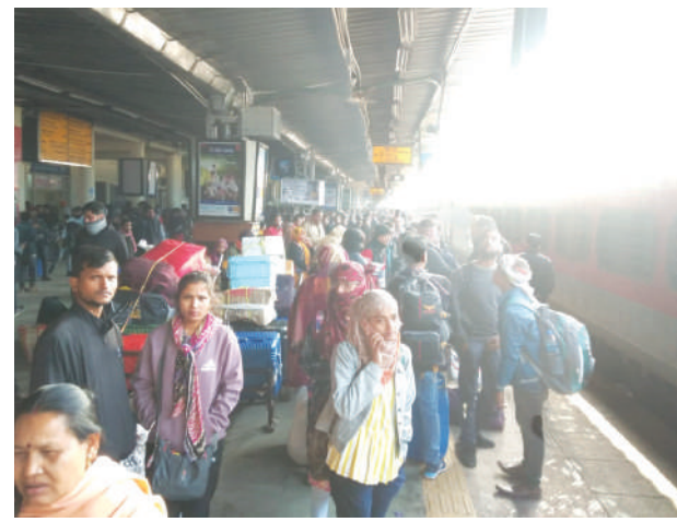
कोहरे का सबसे ज्यादा असर ट्रेनों पर पड़ा है। राजधानी के जयपुर जंक्शन पर ट्रेनें कई घंटे विलंब से पहुंची। इसके

सुबह-शाम के अलावा दिन में भी कोल्ड-डे की कंडीशन रहेगी। मौसम विभाग ने सोमवार को अलवर, भरतपुर, भीलवाड़ा, दौसा, धौलपुर, झुंझुनू और हनुमानगढ़ के लिए अलर्ट जारी किया है। इसी तरह मंगलवार को चूरू, बीकानेर, हनुमानगढ़, टोंक, सीकर, सवाई माधोपुर, करली, कोटा, धौलपुर, भरतपुर, भीलवाड़ा, अलवर में भी कोहरा रहने की संभावना जताते हुए इन जिलों के लिए यलो अलर्ट जारी किया है। वहीं कोहरे से ट्रेनें, बस और फ्लाइट्स का संचालन प्रभावित हुआ है। इसके चलते नव वर्ष मनाते आए सैलानियों को भारी परेशानी का सामना करना पड़ा। कोहरे का सबसे ज्यादा असर ट्रेनों पर पड़ा है। राजधानी के जयपुर जंक्शन पर ट्रेनें कई घंटे विलंब से पहुंची। इसके