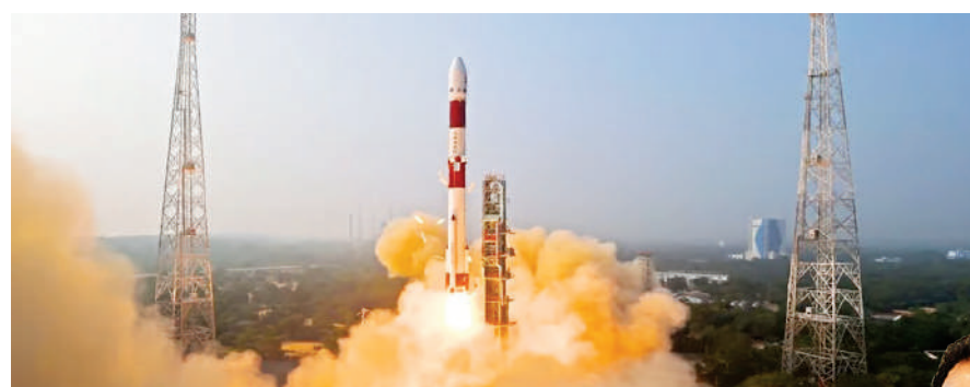
एस सोमनाथ ने कहा कि 2024 गगनयान की तैयारियों का साल रहेगा। इसके साथ ही हम हेलिकॉप्टर से ड्रॉप टेस्ट भी करेंगे। इसमें पैराशूट सिस्टम की जांच की जाएगी। इनके अलावा कई वैल्यूएशन परीक्षण भी किए जाएंगे। साथ ही हम इस साल जीएसएलवी को भी लॉन्च करेंगे। इसरो चीफ ने कहा कि 2024 में हमने कम से कम 12 मिशन लॉन्च करने का लक्ष्य तय किया है।

मिशन लॉन्च किया गया। मिशन की लॉन्चिंग के साथ ही भारत दुनिया का दूसरा ऐसा देश बन गया है, जिसने ब्लैक होल और न्यूट्रॉन स्टार की स्टीडी के लिए स्पेसलाइज्ड एस्ट्रोनामि ऑब्जर्वेट्री को स्पेस में भेजा है। एक्सपोसैट एक तरह से रिसर्च के लिए एक ऑब्जर्वेट्री है, जो अंतरिक्ष से ब्लैक होल और न्यूट्रॉन स्टार के बारे में ज्यादा जानकारी जुटाएगी।