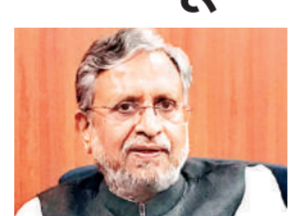
भाजपा के खिलाफ ललन सिंह ने ही भड़काया था। सुशील मोदी ने शनिवार को जारी बयान में कहा कि भले ही ललन सिंह सच से इनकार करें, लेकिन मोदी सरकार के दूसरे कार्यकाल में केंद्रीय मंत्री नहीं बन पाने की

एजेंसी। पटना बिहार के पूर्व डिप्टी सीएम व भाजपा सांसद सुशील कुमार मोदी ने आरोप लगाया है कि केंद्र में मंत्री नहीं बनाए जाने के गुस्से में बदला लेने के भाव से ललन सिंह ने आरजेडी सुप्रिमो लालू प्रसाद यादव से नजदीकियां बढ़ाईं। उन्होंने भाजपा से जेडीयू का गठबंधन तुड़वाया, आरसीपी सिंह को पार्टी से निकलवाया और मुख्यमंत्री नीतीश कुमार की पार्टी को लाभान्वित कर दिया। उन्होंने कहा कि नीतीश कुमार को