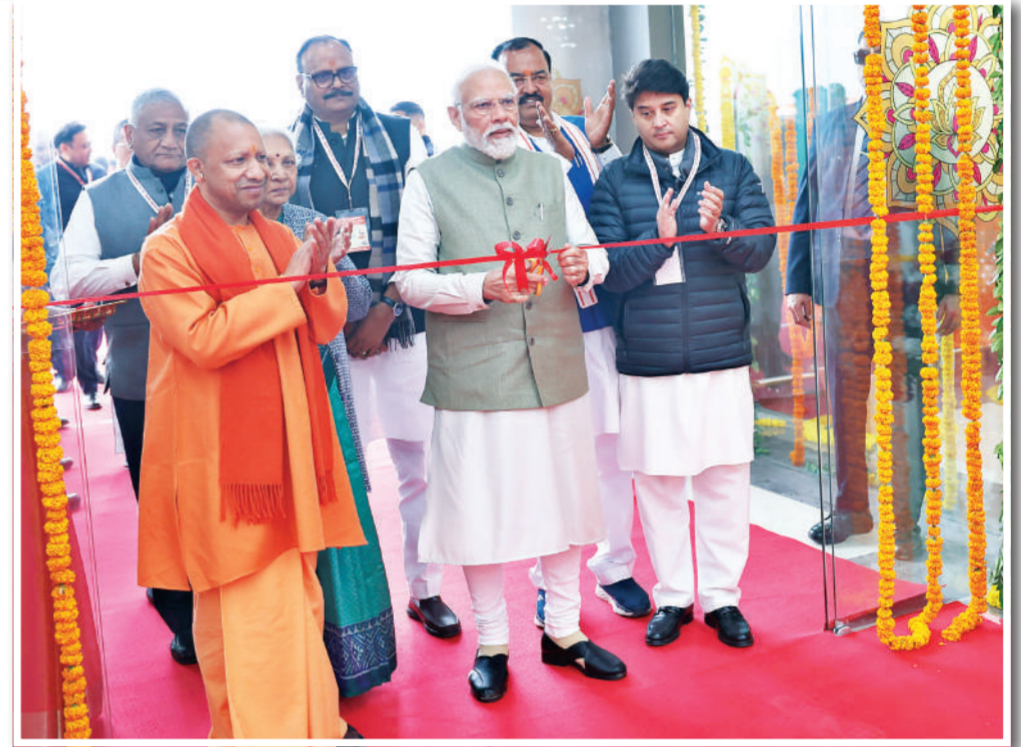
अयोध्या। प्रधानमंत्री नरेंद्र मोदी शनिवार को अयोध्या के दौरे पर पहुंचे जहां उनका भव्य स्वागत किया गया। मोदी के रोड शो के दौरान लोगों ने उन पर फूल बरसाए। संतों - महात्माओं ने भी उनका स्वागत किया। पीएम मोदी ने अपनी यात्रा के दौरान अयोध्या में कई विकास परियोजनाओं का लोकार्पण किया। महर्षि वाल्मीकि हवाई अड्डे व पुनर्विकसित रेलवे स्टेशन का उद्घाटन किया तथा वंदे भारत और अमृत भारत ट्रेनों को हरी झंडी दिखाई।