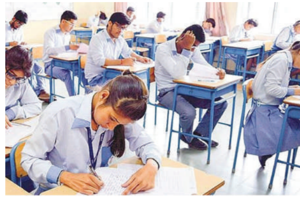
के साथ रणनीतिक साझेदारी और प्रभावी होगा। गौरतलब है कि परख का सबसे जरूरी लक्ष्य राज्य बोर्ड

GRE आयोजित करने के लिए जाना जाता है। परामर्श शुल्क के रूप में ईटीएस को एनसीईआरटी की ओर से 30 करोड़ रुपए दिए जाएंगे। ईटीएस बोर्ड परीक्षाओं पर नीतियां बनाने, राज्य और केंद्र दोनों के शिक्षकों और स्कूल शिक्षा प्रणालियों के मूल्यांकन, व्यावसायिक शिक्षा के लिए मूल्यांकन सहित विभिन्न कार्यक्रमों के मूल्यांकन के साथ ही गैर-लाभकारी संस्थानों, अन्य सार्वजनिक और निजी संस्थानों