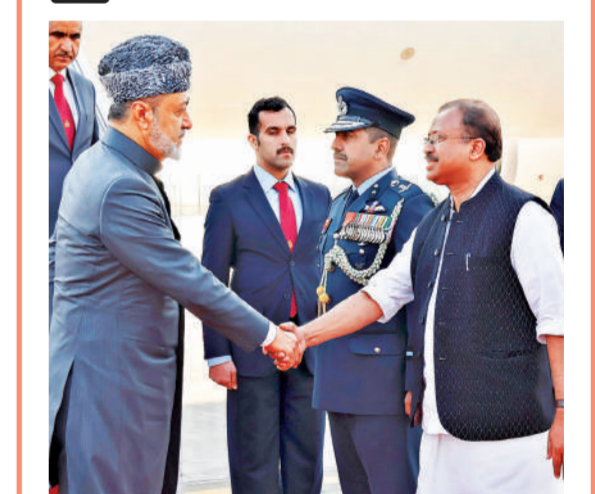
नई दिल्ली। ओमान के सुल्तान हैथम बिन तारिक शुक्रवार को भारत की यात्रा पर नई दिल्ली पहुंचे। इस दौरान हवाई अड्डे पर उनका स्वागत करते विदेश राज्य मंत्री वी मुरलीधरन।