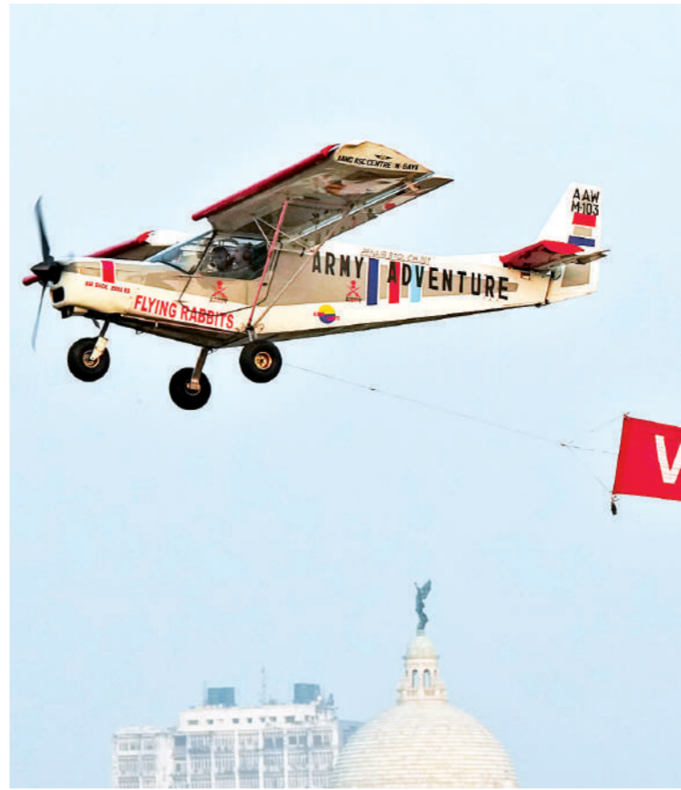
कोलकाता। विजय दिवस समारोह के तहत शुक्रवार को कोलकाता में सेना की ओर से मिलिट्री टैटू शो आयोजित किया गया। इस दौरान हेलिकाप्टर से उतरने के अपने कौशल का प्रदर्शन करते सैनिक तथा विक्टोरिया मेमोरियल के ऊपर से उड़ान भरता एक हेलिकाप्टर।