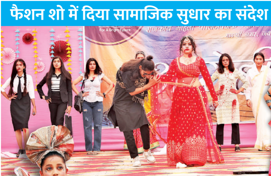
फैशन शो में दिया सामाजिक सुधार का संदेश

गांधी नगर स्थित राजकीय महिला पॉलिटेक्निक कॉलेज का कैंपस शुक्रवार को छात्राओं के टैलेंट से गुलजार रहा। कॉलेज के यूथ फेस्टिवल 'आरोही-2023' के दूसरे दिन शुक्रवार को कॉलेज की छात्राओं ने फैशन शो में जहां अपने अनूठे फैशन सेंस और रचनात्मकता का प्रदर्शन किया। इसके साथ ही सोलो डांस परफॉर्मेंस से कैंपस में उल्लास का संसार रचा। प्राचार्य एवं विभागाध्यक्षों ने गत वर्ष विभिन्न अकादमिक परीक्षाओं में प्रथम तथा द्वितीय रहीं छात्राओं को प्रमाण पत्र एवं स्मृति चिन्ह देकर सम्मानित किया। कॉलेज के कॉमर्सियल आर्ट विभाग की छात्राओं ने 'बो बोल्ड फॉर चेन्ज', ब्यूटी कल्चर विभाग की छात्राओं ने 'लाइफ जर्नी' एवं टेक्सटाइल डिजाइन विभाग की छात्राओं ने 'मदर ऑफ अर्थ' के संदेश के साथ मंच पर अपनी रचनात्मकता का प्रदर्शन किया। मॉडर्न ऑफिस मैनेजमेंट विभाग की छात्राओं ने 'डोमेस्टिक वॉलेंट' पर सवाल उठाए तो कॉस्ट्यूम डिजाइन एण्ड ड्रेस मैकिंग विभाग की स्टूडेंट्स ने 'लव योर सेल्फ' थीम पर लाउड म्यूजिक के साथ फैशन शो की प्रस्तुति रम्य पर दी। दर्शकों की तालियों की गड़गड़हट ने पार्टिसिपेंट छात्राओं को प्रोत्साहित किया। कॉलेज के पांचों डिप्लोमा तथा डिग्री कोर्स की चारों ब्रांचेज की छात्राओं ने 1990 के फिस्की गीतों पर डांस प्रस्तुतियों से समां बांध दिया। सोलो सॉन्ग व ग्रुप डांस पेश कर दर्शकों की तालियां बटोरें।