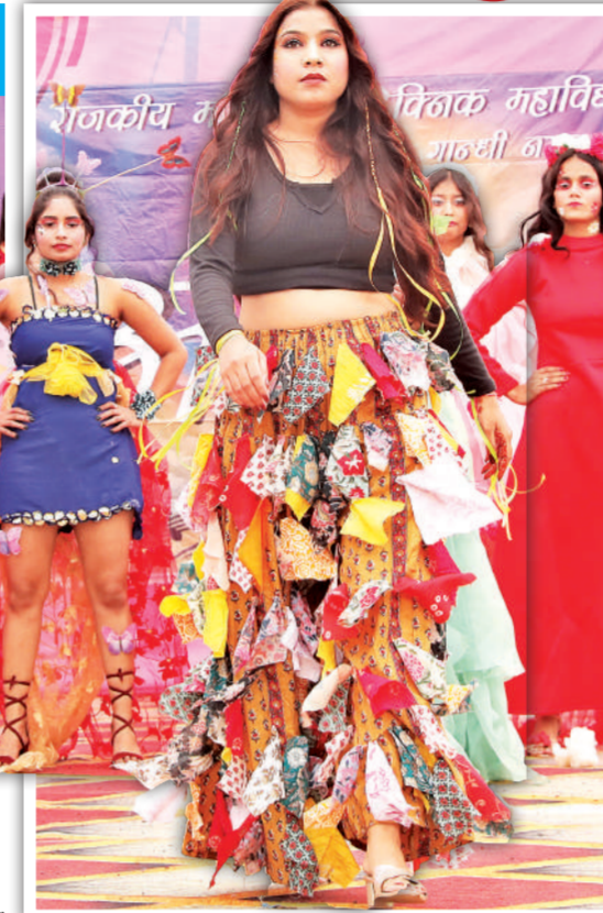
क्रिएटिव एक्टिविटीज में दिखी प्रतिभा

फेस्टिवल के पहले दो दिन में स्टूडेंट्स ने मेहंदी, फेस पेंटिंग, फोटोग्राम मेकिंग, ज्वेलरी मेकिंग, हैंगिंग प्लांट्स, डिबेट, बेस्ट आउट ऑफ वेस्ट, पोएट्री, कुकिंग विड आउट फ्यूल, नेल आर्ट, रंगोली व स्ट्रीट प्ले जैसी क्रिएटिव एक्टिविटीज में अपनी प्रतिभा दिखाई। छात्राओं ने इन एक्टिविटीज को जमकर एंजॉय किया। शनिवार को फेन्सी ड्रेस प्रतियोगिता, फ्रेशर वॉक तथा विभिन्न विभागों की मिस फ्रेशर-2023 प्रतियोगिता का आयोजन किया जाएगा।