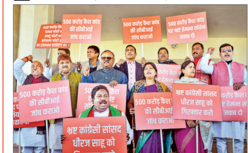
रांची। झारखंड विधानसभा के शीतकालीन सत्र के दौरान शुक्रवार को कांग्रेस सांसद धीरज साहू के खिलाफ प्रदर्शन करते विपक्ष के विधायक।