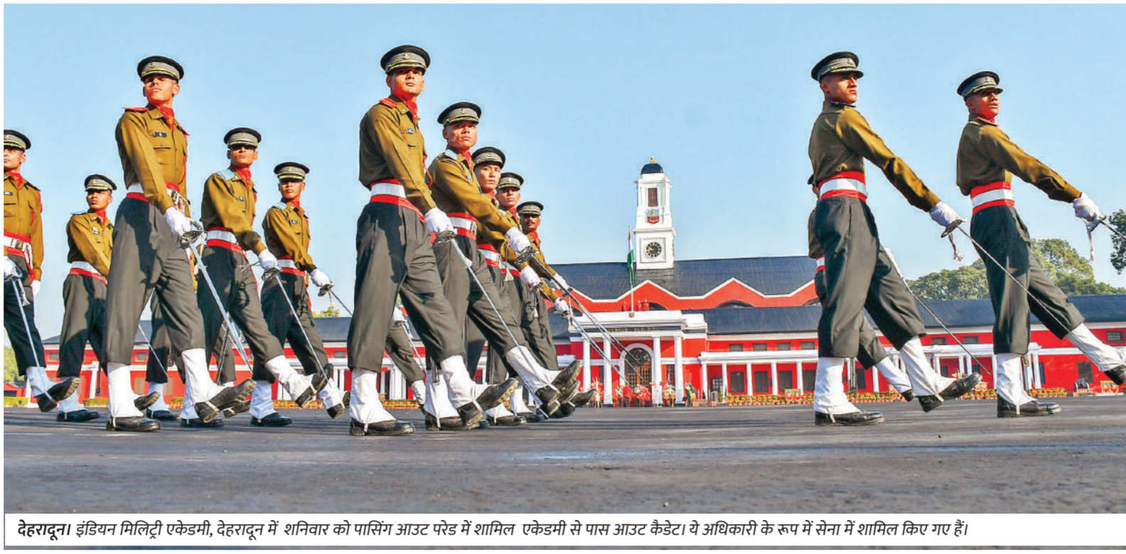
देहरादून। इंडियन मिलिट्री एकेडमी, देहरादून में शनिवार को पांसिंग आउट परेड में शामिल एकेडमी से पास आउट कैडेटों के रूप में सेना में शामिल किए गए हैं।