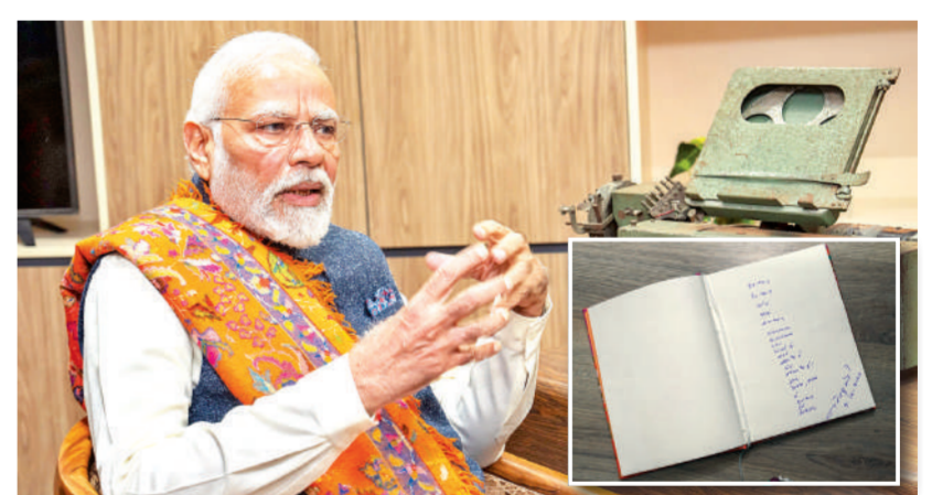
नई दिल्ली। प्रधानमंत्री नरेन्द्र मोदी शनिवार को यहां पीटीआई के मुख्यालय पहुंचे और समाचार एजेंसी की इस साल शुरू हुई वीडियो सेवा के बारे में करीब से जाना। मोदी ने एक आंगतुक पुस्तिका पर भी हस्ताक्षर किए और एक कविता के माध्यम से 'आचार, विचार और समाचार' की बात की।