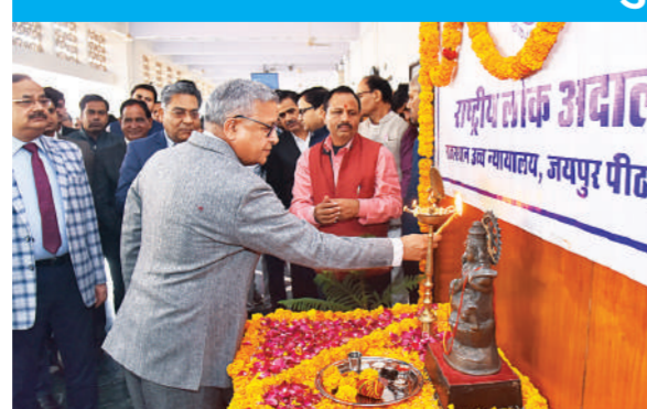
न्यायालय (नई बिल्डिंग) के परिसर में वर्ष-2023 की चतुर्थ