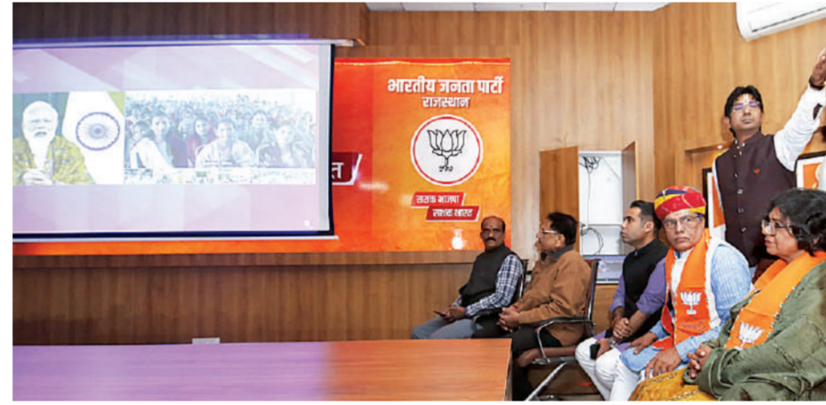
भाजपा मुख्यालय में पीएम मोदी को संदेश सुनते पदाधिकारी व कार्यकर्ता।