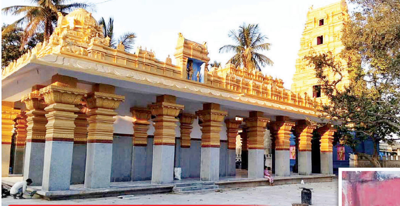
दीपावली पर केवल 10 दिन के लिए खुलता है हसनंबा मंदिर