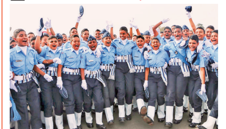
बेलगावी। बेलगावी जिले के एयरमैन ट्रेनिंग स्कूल में पासिंग आउट परेड के दौरान अग्निवीर वायु प्रशिक्षु।