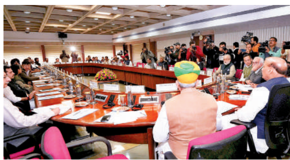
ये नेता मौजूद थे बैठक में

एजेंसी। नई दिल्ली। लोकसभा से टीएमसी सदस्य महुआ मोइत्रा का आसन निष्कासन, आपराधिक कानूनों को बदलने के लिए तीन विधेयक और चुनाव आयुक्तों की नियुक्ति के लिए एक प्रस्तावित कानून जैसे मुद्दे छापे रहने की उम्मीद है। वहीं, सरकार ने विपक्ष से सदन में चर्चा के लिए अनुकूल माहौल सुनिश्चित करने का आग्रह किया है। ज्ञात रहे कि सरकार ने संसद के शीतकालीन सत्र के लिए 19 विधेयक और दो विधेयक एजेंडा सूचीबद्ध किए हैं। शीतकालीन सत्र के सिलसिले में शनिवार को सर्वदलीय बैठक हुई। इसमें, टीएमसी नेताओं ने मोइत्रा को सदन से निष्कासित करने का कोई भी निर्णय लेने से पहले लोकसभा में चर्चा कराने की मांग की।