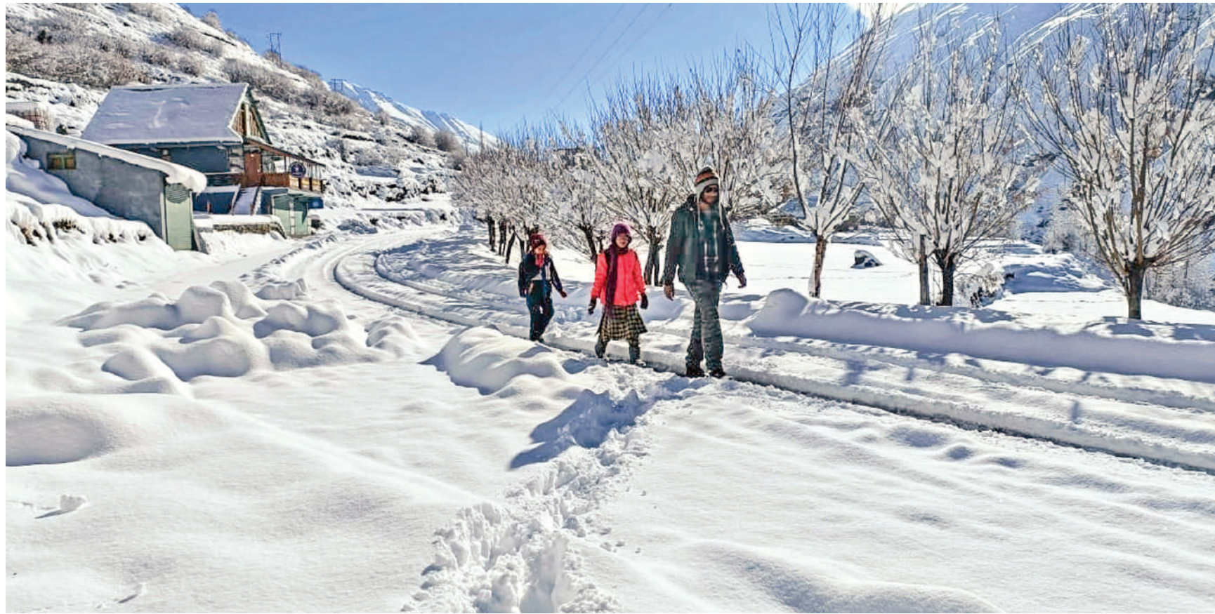
लाहौल और स्पीति। हिमाचल प्रदेश के पर्वतीय इलाकों में इन दिनों बर्फबारी हो रही है। जनजातीय लाहौल-स्पीति जिले के कई इलाकों ताजा हिमपात की खबर है। इसके बाद लाहौल के कई इलाके बर्फ की सफेद चादर से ढक गए हैं। स्पीति के शूलिंग गांव में बर्फबारी के बाद बर्फ से ढकी सड़क से गुजरते पैदल यात्री।