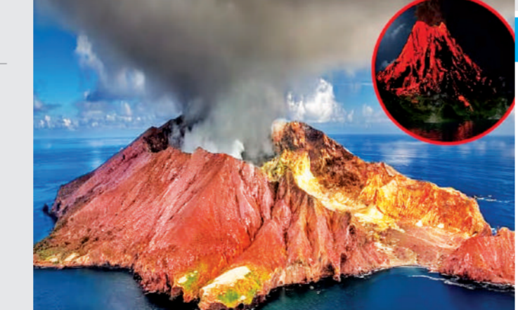
उत्पन्न होने वाली एनर्जी से पत्थर पिघलने लगते हैं, फिर यही पिघले हुए पत्थर और गैस ऊपर की ओर दबाव पैदा करते हैं जिससे पहाड़ फट जाता है और ज्वालामुखी में बदल जाता है।

क्यों फटते हैं ज्वालामुखी ज्वालामुखी एक तरह का पहाड़ होता है जिसके नीचे ढेर सारा पिघला हुआ लावा होता है। दरअसल, पृथ्वी के भीतर जियोथर्मल एनर्जी भारी मात्रा में होती है। ऐसे में इस एनर्जी के कारण पत्थर पिघल कर लावा में बदल जाता है। यही लावा जब ऊपर की ओर दबाव बनाता है तो पहाड़ फट जाता है और वह ज्वालामुखी कहलाता है। विज्ञान की भाषा में इसे समझना चाहते हैं तो इसे ऐसे समझिए कि पृथ्वी के भीतर जब टेक्टोनिक प्लेट्स आपस में घर्षण करते हैं तो उससे