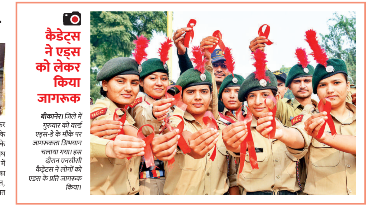
कैडेट्स ने एड्स को लेकर किया जागरूक। बीकानेर। जिले में गुरुवार को वर्ल्ड एड्स-डे के मौके पर जागरूकता अभियान चलाया गया। इस दौरान एनसीसी कैडेट्स ने लोगों को एड्स के प्रति जागरूक किया।