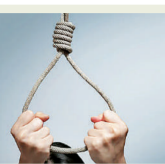
अवसाद में है। इसकी काउंसिलिंग संस्थान द्वारा की जा रही थी। इसके बावजूद संस्थान ने इसकी सूचना प्रशासन को नहीं दी।