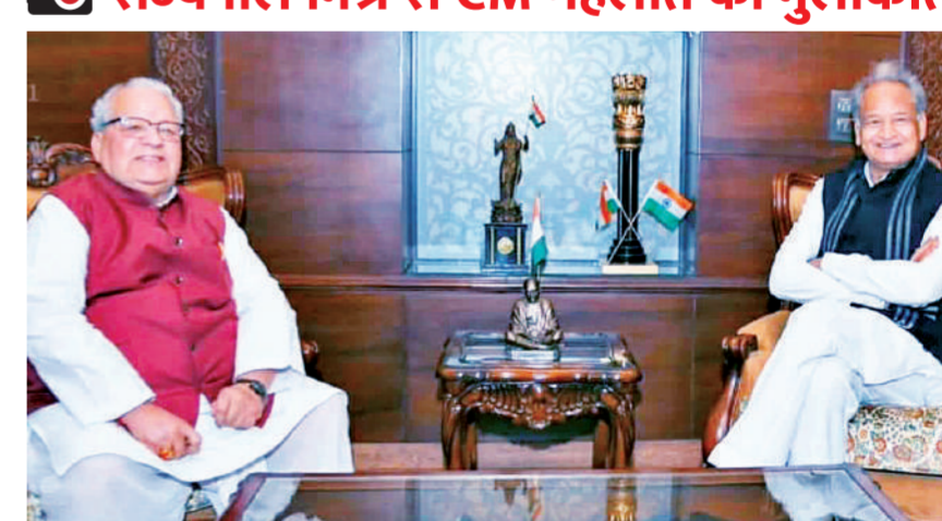
जयपुर। मुख्यमंत्री अशोक गहलोत ने गुरुवार को राजभवन पहुंचकर राज्यपाल कलराज मिश्र से मुलाकात की। इसे सामान्य शिष्टाचार भेंट बताया जा रहा है, लेकिन सियासी गलियारों में इस मुलाकात के अलग-अलग मायने निकाले जा रहे हैं।