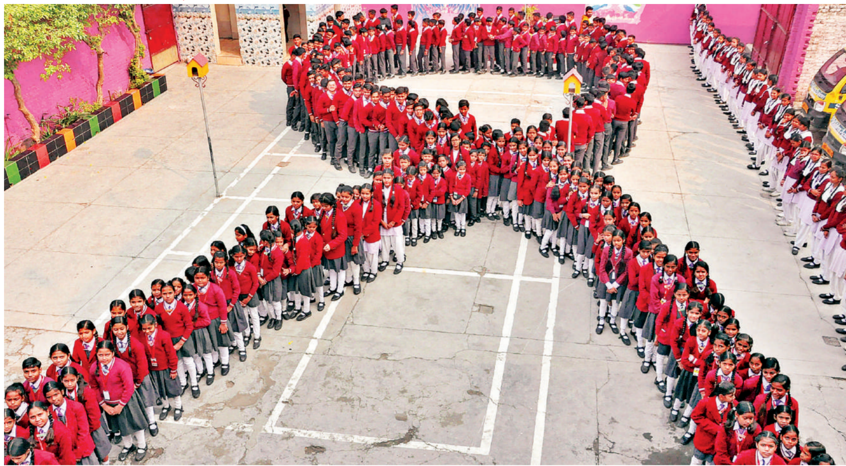
मुरादाबाद। विश्व एड्स दिवस से एक दिन पहले गुरुवार को स्कूली छात्र 'लाल रिबन' बनाकर खड़े हैं, जो एचआईवी से पीड़ित लोगों के लिए जागरूकता और समर्थन का सार्वभौमिक प्रतीक है।