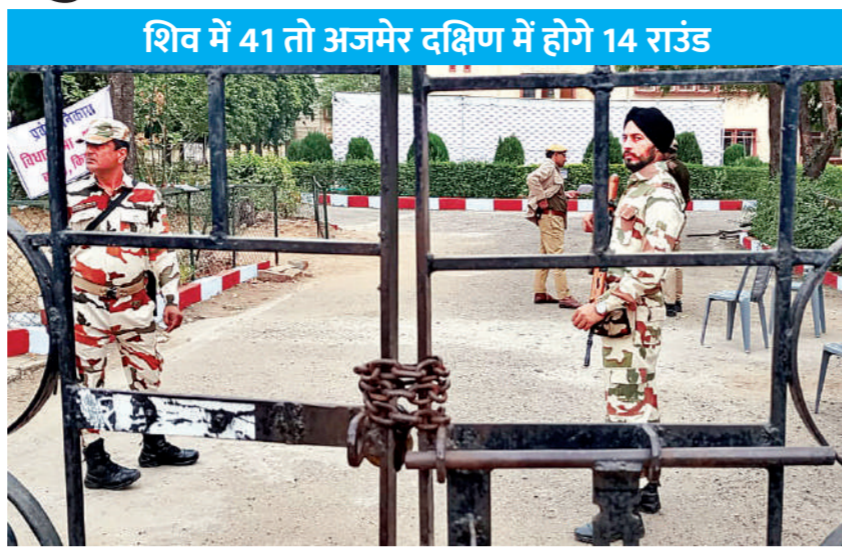
शिव में 41 तो अजमेर दक्षिण में होंगे 14 राउंड

बेधड़क। जयपुर विधानसभा चुनाव के परिणाम तीन दिसंबर को आए रहे हैं। ऐसे में लोकतंत्र के मंदिर में जाने के लिए भाग्य आजमा रहे सभी प्रत्याशियों की धड़कनें भी तेज होने लग गई हैं। वहीं वोटिंग की गणना के लिए चुनाव आयोग की तैयारियां लगभग पूरी हो चुकी हैं। तीन दिसंबर को 199 सीटों के लिए मतगणना होगी। जिला मुख्यालय पर जिले की विधानसभा की वोटों की काउंटिंग की जाएगी। सबसे पहले रिजल्ट अजमेर जिले की दक्षिण सीट का आ सकता है, जबकि सबसे देरी से रिजल्ट बाड़मेर की शिव सीट पर आने की संभावना है।