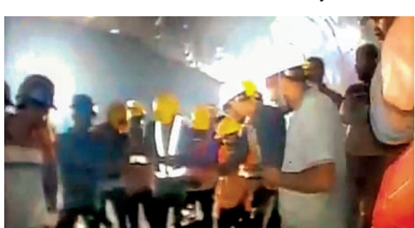
उत्तरकाशी। सुरंग में कैमरे में नजर आए श्रमिक और राउटरकेला से जरूरी सामान लेकर उड़ान की तैयारी में विमान।

अधिकारियों ने बताया कि छह इंच की पाइपलाइन के जरिए श्रमिकों तक खिचड़ी भेजने के कुछ घंटों बाद बचावकर्मियों ने उसी पाइप से तड़के उन तक एंडोस्कोपिक फ्लैस्को कैमरा भेजा जिससे उनके सकुशल होने का वीडियो मिला। यह कैमरा सोमवार देर शाम दिल्ली से सिलक्यारा पहुंचा। इससे पहले सोमवार को