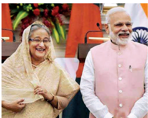
के रामपाल में 'मैत्री सुपर थर्मल पावर प्लांट' की दूसरी इकाई शामिल है। करीब 15 किलोमीटर लंबे अगरतला-अखोरा क्रॉस बॉर्डर रेल संपर्क से सीमा पर व्यापार को बढ़ावा मिलने की उम्मीद है

एजेंसी। अगरतला। प्रधानमंत्री नरेन्द्र मोदी ने बुधवार को बांग्लादेश की अपनी समकक्ष शेख हसीना के साथ डिजिटल माध्यम से तीन विकास परियोजनाओं का उद्घाटन किया और कहा कि दोनों देशों के संबंध निरंतर नई ऊंचाइयां छू रहे हैं तथा पिछले नौ वर्षों में दोनों ने मिलकर जितना काम किया है, उतना काम कई दशकों में भी नहीं हुआ।