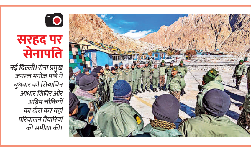
नई दिल्ली। सेना प्रमुख जनरल मनोज पांडे ने बुधवार को सियाचिन आधार शिविर और अग्रिम चौकियों का दौरा कर वहां परिचालन तैयारियों की समीक्षा की।

तिपा (मिजोरम)। रक्षामंत्री राजनाथ सिंह ने बुधवार को मणिपुर में एक दूसरे से लड़ रहे मेइती और कुकी समुदायों से अपील की कि वे एक-दूसरे के प्रति बने अविश्वास के माहौल को खत्म करने के लिए साथ बैठें और दिल से बात करें। सिंह ने प्यामा सीमा के नजदीक एक चुनावी रैली को संबोधित करते हुए यह बात कही।