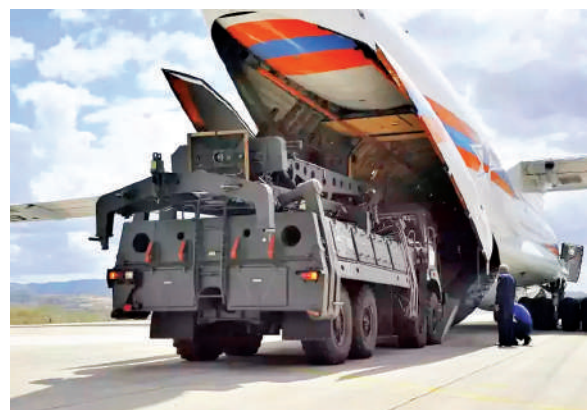
किमी तक की दूरी पर आने वाले स्टील्थ फाइटर जेट, मिसाइल, ड्रोन और टारगेट गाइडेड हथियारों का पता लगाकर समय रहते डेर

भारत अगले पांच सालों में अपनी लंबी दूरी की एयर डिफेंस सिस्टम तैनात करने के लिए तैयारी कर रहा है। 'प्रोजेक्ट कुश' के तहत विकसित हो रही स्वदेशी लंबी दूरी की सतह से हवा में मार करने वाले इस डिफेंस सिस्टम की क्षमता रूस के एयर डिफेंस सिस्टम S-400 के बराबर क्षमता होगी। भारत ने 2028-29 तक अपनी लंबी दूरी के एयर डिफेंस सिस्टम को सक्रिय रूप से तैनात करने की योजना बनाई है। ये स्वदेशी एयर डिफेंस सिस्टम 350