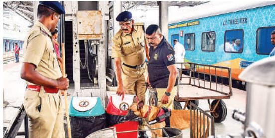
तिरुवनंतपुरम में एक ट्रेन में जांच करता आरपीएफ का दस्ता।

एजेंसी। नई दिल्ली। केरल के एक कन्वेंशन सेंटर में रविवार को हुए धमाके के मद्देनजर केरल के साथ ही राष्ट्रीय राजधानी में गिरजाघरों के आसपास और मेट्रो स्टेशनों पर सुरक्षा कड़ी कर दी गई है। पुलिस के एक वरिष्ठ अधिकारी ने नाम नहीं प्रकाशित करने की शर्त पर बताया कि मुख्य बाजारों, गिरजाघरों, मेट्रो स्टेशनों, बस स्टैंड, रेलवे स्टेशनों और अन्य सार्वजनिक स्थानों पर सुरक्षा कड़ी कर दी गई है। उत्तर प्रदेश और हरियाणा की सीमा से सटे इलाकों पर पुलिस दलों को नाकाबंदी करने के लिए सूचित किया गया है। हम भीड़भाड़ वाले बाजारों में पहले से ही बारीकी से नजर रखे हुए हैं।