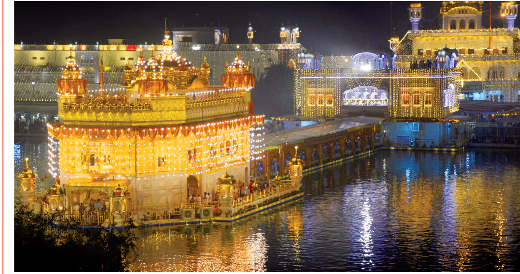
अमृतसर। सिख गुरु राम दास के प्रकाश पर्व की पूर्व संध्या पर रविवार को रोशनी में नहाया अमृतसर स्थित स्वर्ण मंदिर। पंजाब में गुरु रामदास के प्रकाश पर्व पर नगर कीर्तन समेत विभिन्न आयोजन किए जा रहे हैं।