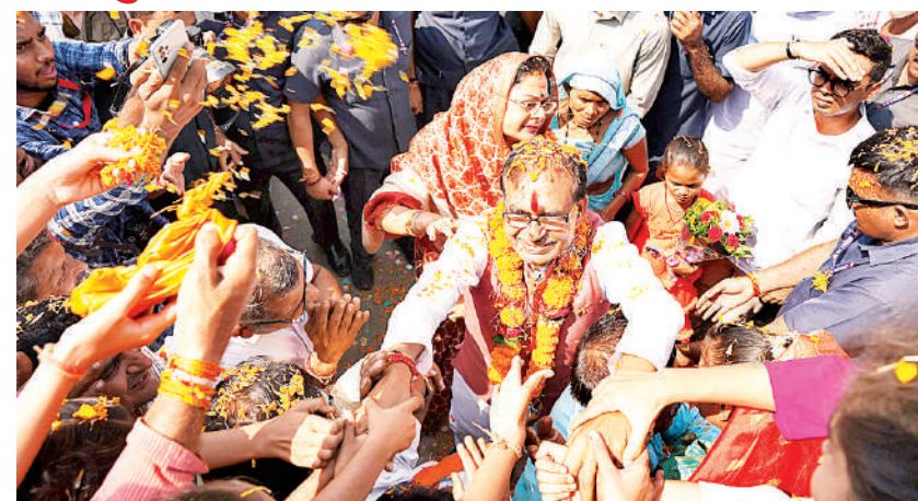
सिहोरा। मध्य प्रदेश में विधानसभा चुनाव के लिए रविवार को सिहोरा जिले में चुनाव प्रचार के दौरान राज्य के सीएम शिवराज सिंह चौहान व उनकी पत्नी साधना सिंह।