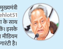
अशोक गहलोत, मुख्यमंत्री

@RahulGandhi छत्तीसगढ़ के किसानों के लिए कांग्रेस सरकार के 5 सबसे बेहतरीन काम, जिन्होंने उन्हें भारत में सबसे खुशहाल बनाया।