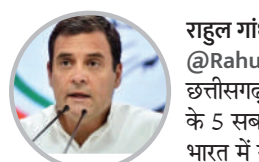
राहुल गांधी, कांग्रेस नेता

‘किस छाते में जाऊँ असमंजस में है भोलाभाला/ किस पथ पर मैं कदम बढ़ाऊँ/ कौन मुझे नहीं धोखा देगा, कौन नहीं ठगने वाला/ कौन मुझे पैसा देगा, कौन पिलाएगा हाला/ कौन मुझे दुःख देगा आखिर, कौन देगा सुख का प्याला/ कौन प्रेम देगा का सीधा मामला है। हाँ, तुम्हें लुभाने-समझाने के लिए, तुम्हारी जब में एक-दो रेवड़ी डाल देगा। हाथ में एक घटिया लालीपाँप पलड़ा देगा। तुम सालों