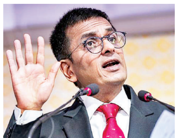
सोसाइटी फॉर डेमोक्रेटिक राइट्स (एसडीआर), नई दिल्ली द्वारा आयोजित तीसरी तुलनात्मक

भारत के प्रधान न्यायाधीश (सीजेआई) डी वाई चंद्रचूड़ ने कहा कि न्यायाधीश यद्यपि निर्वाचित नहीं होते हैं, लेकिन उनकी भूमिका बहुत महत्वपूर्ण है, क्योंकि न्यायापालिका के पास प्रौद्योगिकी के साथ तेजी से बदल रहे समाज के विकास में 'प्रभाव को स्थिर' करने की क्षमता होती है। वह सामान्य तौर पर की जाने वाली उस आलोचना का जवाब दे रहे थे कि निर्वाचित नहीं होने वाले न्यायाधीशों को कार्यपालिका के कार्यक्षेत्र में हस्तक्षेप नहीं करना चाहिए। सीजेआई चंद्रचूड़ ने यह बात जॉर्जटाउन यूनिवर्सिटी लॉ सेंटर, वाशिंगटन और