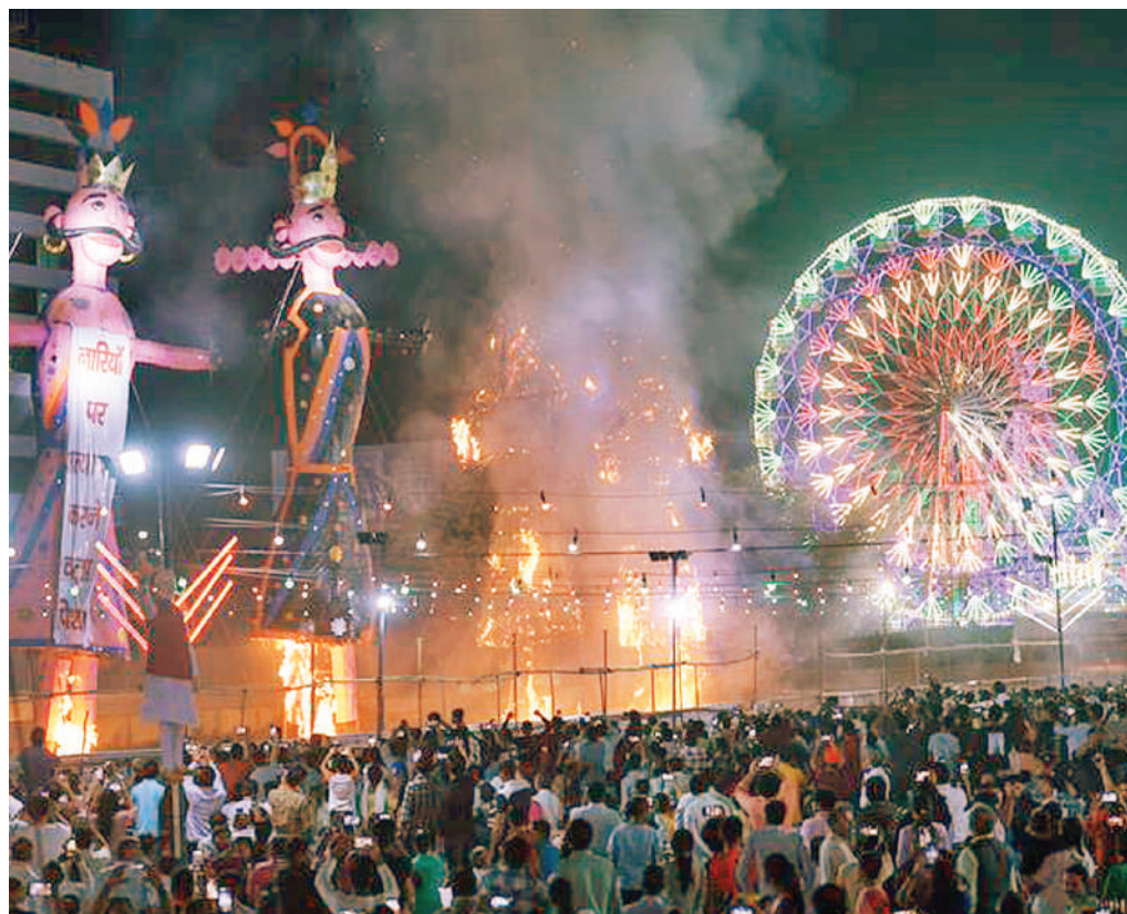
नई दिल्ली। देशभर में मंगलवार को बुराई पर अच्छाई की जीत के प्रतीक विजयादशमी पर्व को धूमधाम और हर्षोल्लास के साथ मनाया गया। देश के अलग-अलग राज्यों में रावण दहन किया गया। राष्ट्रीय राजधानी दिल्ली में राष्ट्रपति द्रौपदी मुर्मू लाल किला मैदान में धार्मिक लीला समिति की ओर से आयोजित दशहरा समारोह में शामिल हुईं और रावण दहन किया। दिल्ली के द्वारका सेक्टर 10 स्थित डीडीए ग्राउंड में रावण दहन को देखने उमड़ा जन सैलाब।