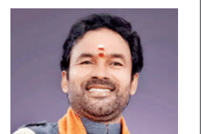
नारा चंद्रबाबू नायडू

हैदराबाद। तेलंगाना विधानसभा चुनाव के लिए प्रमुख विपक्षी पार्टी भाजपा की दूसरी सूची जल्द आने की उम्मीद है। पार्टी ने सोमवार को 52 प्रत्याशियों की पहली सूची जारी की थी। भाजपा प्रदेश अध्यक्ष और केंद्रीय मंत्री किशन रेड्डी ने बताया शेष निर्वाचन क्षेत्रों के लिए उम्मीदवारों की घोषणा दशहरा के बाद की जाएगी। उन्होंने कहा कि पार्टी के केंद्रीय नेतृत्व ने टी राजा सिंह के स्पष्टीकरण से आश्चर्य नहीं होने के बाद ही उन्हें चुनाव मैदान में उतारने का फैसला किया था। सिंह को उनकी अल्पसंख्यकों को आहत करने वाली एक टिप्पणी को लेकर पार्टी से निर्वासित कर दिया गया था। उन्होंने दावा किया कि बीआरएस और कांग्रेस राजनीति में भ्रष्टाचार और परिवारवाद के शासन के उदाहरण हैं। उन्होंने राज्य के मतदाताओं से भाजपा को वोट देकर चुनाव जिताने की अपील की।