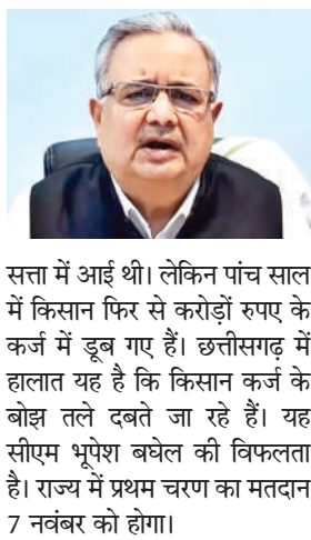
नारा चंद्रबाबू नायडू

एजेसी | रायपुर छत्तीसगढ़ विधानसभा चुनाव के प्रथम चरण के मतदान में अब दो सप्ताह से भी कम समय रह गया है। इस बीच, मुख्यमंत्री भूपेश बघेल द्वारा पार्टी की सत्ता में वापसी पर किसानों का कर्ज माफ करने के वादे पर सियासत शुरू हो गई है।