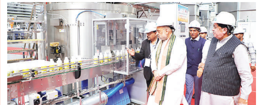
कलोल (गुजरात)। केंद्रीय गृह मंत्री अमित शाह ने गुजरात के कलोल में लिक्विड डीएपी के पहले प्लांट का उद्घाटन किया। प्लांट का अवलोकन करते हुए शाह।