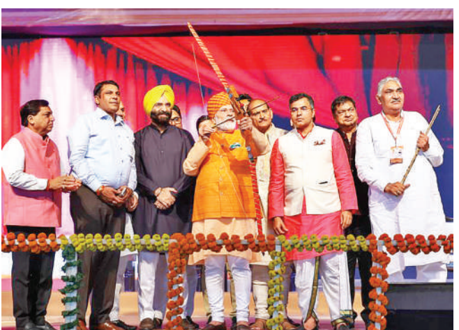
दशहरा उत्सव पर प्रधानमंत्री नरेंद्र मोदी के साथ अन्य अधिकारियों का समूह।

प्रधानमंत्री नरेंद्र मोदी ने मंगलवार को लोगों से समाज में जातिवाद और क्षेत्रवाद जैसे विकृतियों को जड़ से खत्म करने का आह्वान करते हुए कहा कि दशहरा उत्सव को देश में हर बुराई पर देशभक्ति की जीत का प्रतीक भी बनाना चाहिए। पीएम मोदी दशहरा समारोह के उपलक्ष्य में मंगलवार को राष्ट्रीय राजधानी दिल्ली में द्वारका में आयोजित एक कार्यक्रम में लोगों को संबोधित करते हुए यह बात कही। उन्होंने कहा कि यह हर किसी का सौभाग्य है कि वे सदियों के इंतजार के बाद अब अयोध्या में एक भव्य राम मंदिर के निर्माण का गवाह बन रहे हैं। यह कुछ महीनों में पूरा हो जाएगा।