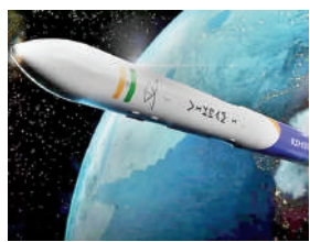
के नए मुख्यालय 'द मैक्स-क्यू कैम्प' का भी उद्घाटन किया। सिंह ने कहा कि भारत अब अंतरिक्ष क्षेत्र में अन्य देशों का नेतृत्व करने की स्थिति में है। अब इसे ऐसे देश के रूप में नहीं देखा

भारतीय स्टार्टअप स्काईरूट ने मंगलवार को दक्षिण हैदराबाद के ममीडिपल्ली में जीएमआर एयरोस्पेस और औद्योगिक पार्क में विक्रम-1 रॉकेट का अनावरण किया। विक्रम-1 का निर्माण भारत में किया गया है।