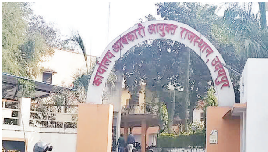
आयोग ने भी आबकारी विभाग को अवैध शराब पर निगरानी कर उस पर कार्रवाई करने के निर्देश

विधानसभा चुनावों को लेकर आबकारी विभाग ने भी सख्ती करना शुरू कर दिया है। विधानसभा चुनावों में अवैध शराब को लेकर आबकारी विभाग ने क्षेत्र में संचालित शराब की दुकानों का निरीक्षण कर शराब ठेकेदारों को रात आठ बजे बाद होने वाली शराब बिक्री पर रोक लगाने के लिए निर्देश दिए हैं। इस संबंध में सभी आबकारी निरीक्षकों को इलाकों में रात 8 बजे बाद गश्त करके डिकॉय ऑपरेशन करने के निर्देश दिए हैं। शराब की दुकानों का रात आठ बजे बाद औचक निरीक्षण किया जाएगा। दरअसल पुलिस की कार्रवाई के बाद आबकारी विभाग ने यह कदम उठाया है। चुनाव