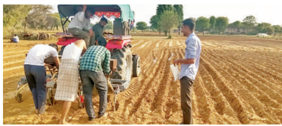
वह बहुत ही अच्छा है। सरसों की फसल की बुवाई के लिए 30 से 32 डिग्री तापमान उपयुक्त माना गया है। इस समय किसान सरसों की फसल की बुवाई कर सकते हैं और माह के अंत तक