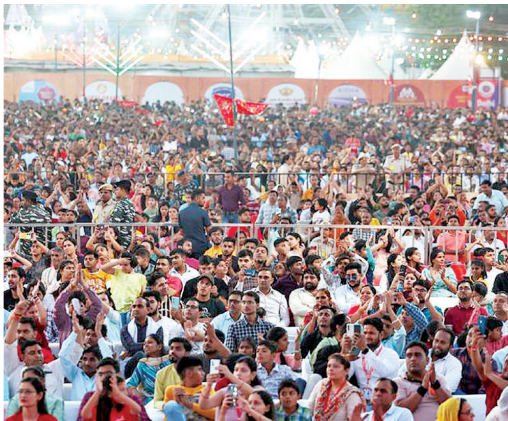
नई दिल्ली। देशभर में मंगलवार को बुराई पर अच्छाई की जीत के प्रतीक विजयादशमी पर्व को धूमधाम और हर्षोल्लास के साथ मनाया गया। देश के अलग-अलग राज्यों में रावण दहन किया गया। राष्ट्रीय राजधानी दिल्ली में राष्ट्रपति द्रौपदी मुर्मू लाल किला मैदान में धार्मिक लीला समिति की ओर से आयोजित दशहरा समारोह में शामिल हुईं और रावण दहन किया। दिल्ली के द्वारका सेक्टर 10 स्थित डीडीए ग्राउंड में रावण दहन को देखने उमड़ा जन सैलाब।