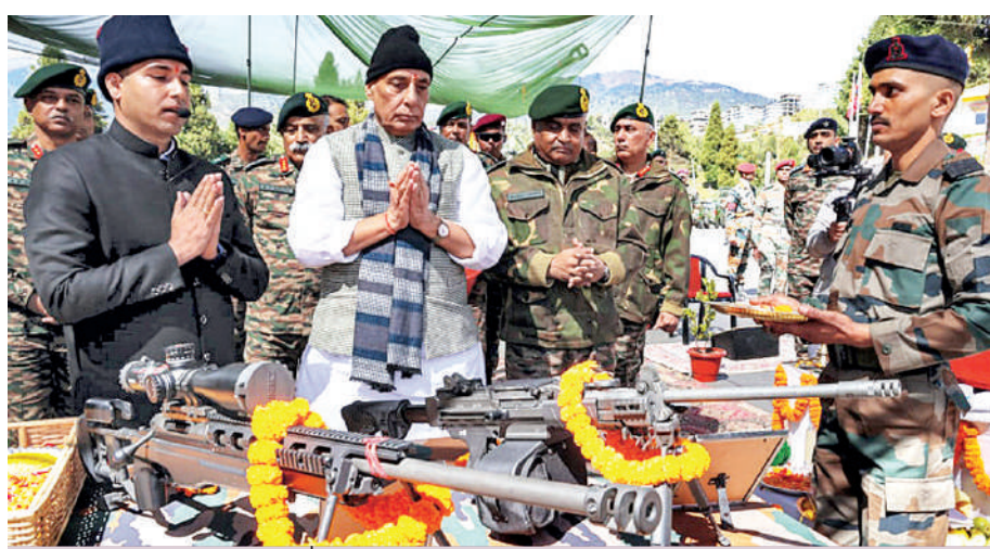
पूर्वी लद्दाख में कई जगहों पर 3 साल से बना है गतिरोध

रक्षा मंत्री राजनाथ सिंह ने मंगलवार को अरुणाचल प्रदेश के तवांग में शस्त्र पूजन किया और चीन के साथ सीमा के पास रणनीतिक रूप से महत्वपूर्ण क्षेत्र में सेना के जवानों के साथ दशहरा पर्व मनाया। उन्होंने कहा कि मौजूदा वैश्विक परिदृश्य के मद्देनजर देश के सुरक्षा तंत्र को मजबूत करने के अलावा कोई विकल्प नहीं है। सिंह ने सेना प्रमुख जनरल मनोज पांडे के साथ एलएसी पर भारत की सैन्य तैयारियों की व्यापक समीक्षा भी की और अटूट प्रतिबद्धता और अद्वितीय साहस के साथ सीमा की रक्षा करने के लिए सैनिकों की सराहना की। रक्षा मंत्री सिंह ने बुम-ला और कई अन्य अग्रिम चौकियों का निरीक्षण भी किया। इसके बाद उन्होंने सैनिकों के साथ बातचीत की। सिंह ने कहा कि रक्षा उपकरणों के स्वदेशी उत्पादन के जरिए देश के सैन्य कौशल को