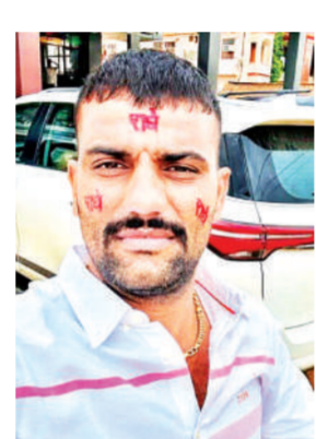
डीएसटी टीम कर रही थी पीछा

बेधड़क। पाली जिले के खिवाड़ा थाना क्षेत्र में दीवरे नाल का इलाका गोलियों की गूंज से दहल उठा। आगे-आगे तस्कर और उनके पीछे सरपट दौड़ती डीएसटी (डिस्ट्रिक्ट स्पेशल टीम) की गाड़ी को देखकर एक बारगी हर कोई सकते में आ गया। इस दौरान तस्करों ने डीएसटी टीम पर ताबड़तोड़ गोलियां दाग दीं। जवाबी कार्रवाई में टीम की ओर से भी फायरिंग की गई।