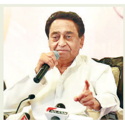
को टिकट दिया है। वहीं, तीन विधायकों के टिकट काट दिए हैं।