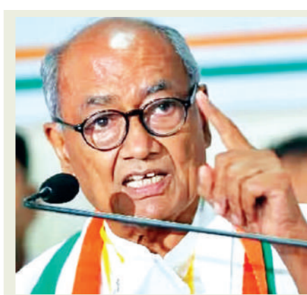
प्रत्याशी बनाया है। इसके अलावा मुख्यमंत्री शिवराज सिंह चौहान

की एक बड़ी बैठक हुई जिसमें 94 प्रत्याशियों के नामों पर विचार किया गया। कांग्रेस ने अभी तक 144 प्रत्याशियों के नाम घोषित किए हैं जबकि भाजपा ने 122 नाम घोषित किए हैं। पहले भाजपा प्रत्याशियों की पांचवी सूची मंगलवार को आने के कयास लगाए जा रहे थे। अब यह सूची बुधवार को आने की चर्चा संभावना है। सूत्रों के अनुसार भाजपा की पांचवी सूची में 70 नाम हो सकते हैं। 21 अक्टूबर को नामांकन की अधिसूचना जारी हो जाएगी। भाजपा ने इस बार अपने तीन केंद्रीय मंत्री समेत सांसदों को विधानसभा चुनाव में