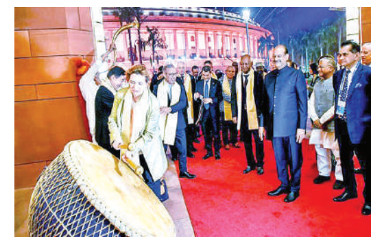
नई दिल्ली। पी20 प्रतिनिधियों के साथ नए संसद भवन का दौरा करते लोकसभा अध्यक्ष ओम बिरला।