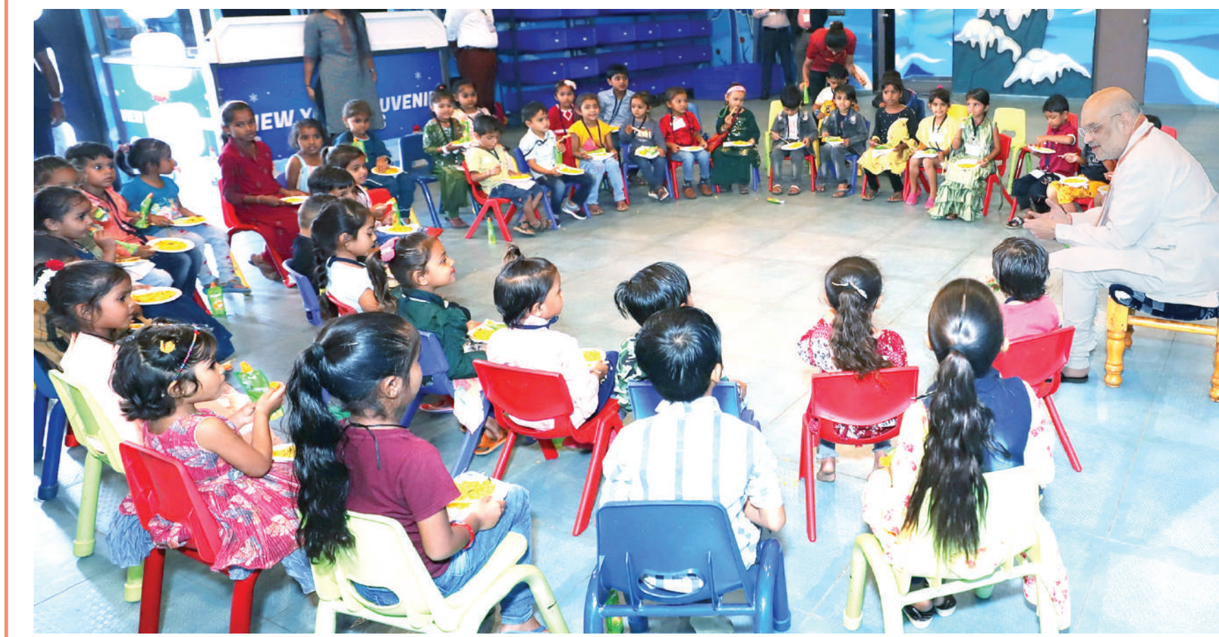
गांधीनगर। केंद्रीय गृह मंत्री अमित शाह शनिवार को गुजरात के गांधीनगर के आंगनवाड़ी में पहुंचे। फुरसत के लम्हों में गृह मंत्री ने गेमिंग जॉन में जाकर बच्चों से बातचीत की।