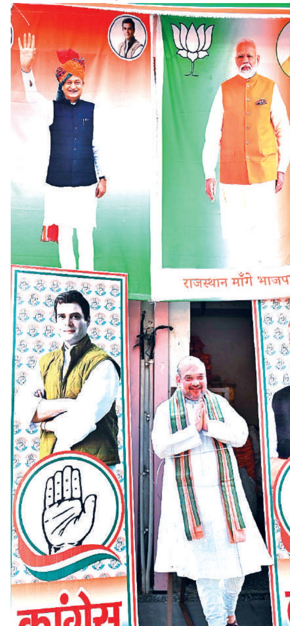
जयपुर। प्रदेश में आगामी विधानसभा चुनाव में प्रचार-प्रसार की सामग्री बनाना शुरू हो गई है। आचार संहिता लगते ही पार्टियों के वरिष्ठ नेताओं के बैनर और पोस्टर बनकर तैयार हो गए हैं। हालांकि, उम्मीदवारों की घोषणा नहीं होने से खरीददारी अभी बड़ी नहीं है।