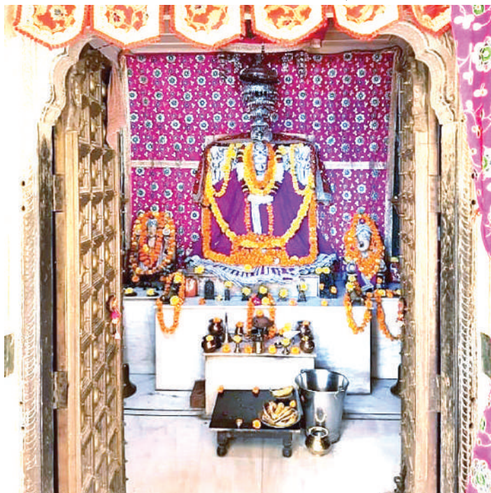
राजा सवाई प्रताप सिंह ने बनवाया था भव्य मंदिर