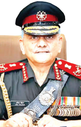
वहीं चीन मुखर होकर उभरेगा। इसके साथ ही उन्होंने सेना की तकनीकी, उसके काम करने के तरीके में बदलाव की वकालत की है। उन्होंने कहा है कि हालिया वैश्विक घटनाओं में भारत की भूमिका सहज ही बढ़ेगी ऐसी परिस्थितियों में सेना का विकास करना समय की मांग है। 21वीं सदी भारत की सदी है,

इसलिए सेना को देश की जरूरतों के अनुसार खुद को बदलना होगा। सीडीएस ने यहां आयोजित एयर चीफ मार्शल एलएम कात्रे