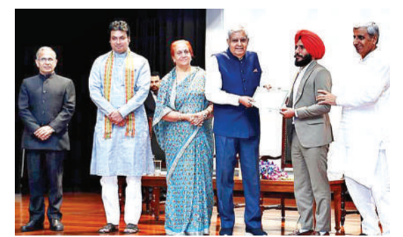
उपराष्ट्रपति जगदीप धनखड़ ने रविवार को नई दिल्ली में संसद भवन देखने आए हरियाणा के प्रगतिशील किसानों को सम्मानित किया।