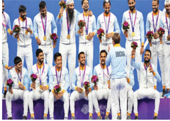
अब 1966, 1998, 2014 और 2023 में स्वर्ण पदक जीत चुकी है, जबकि नौ रजत और दो कांस्य भी जीते हैं।

एजेंसी। हांगकॉन्ग। भारतीय हॉकी टीम ने एशियाई खेलों के पुरुष हॉकी फाइनल में जापान को हराकर गोल्ड मेडल पर कब्जा जमाया है। भारत ने जापान को खिताबी मुकाबले में 5-1 से हराया। इससे पहले भारत ने 2014 में इंचियोन में पुरुष हॉकी में स्वर्ण पदक जीता था। भारत का एशियाई खेलों में ये चौथा स्वर्ण पदक है। शानदार फॉर्म में चल रही टीम इंडिया ने चौथी बार सोने का तमगा जीतकर अगले साल होने वाले पेरिस ओलंपिक का टिकट भी कटाया है। भारतीय टीम