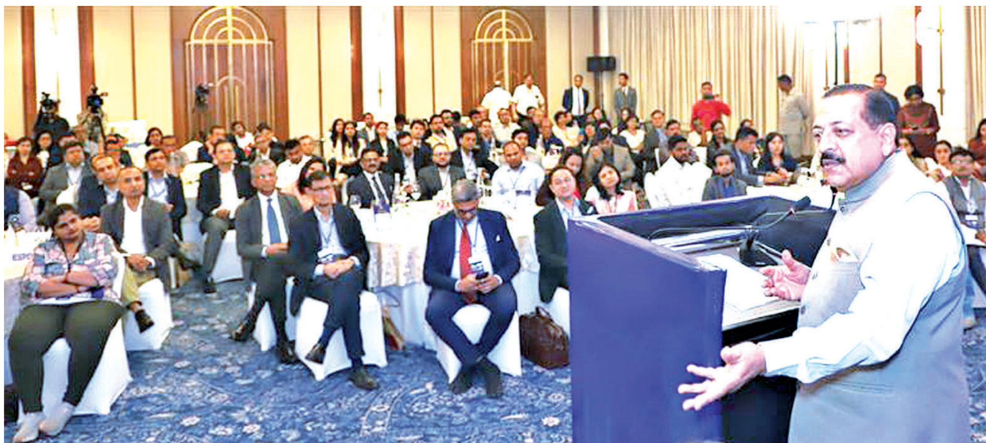
नई दिल्ली। विज्ञान और प्रौद्योगिकी, परमाणु ऊर्जा और अंतरिक्ष राज्य मंत्री (स्वतंत्र प्रभार) डॉ. जितेंद्र सिंह शुक्रवार को नई दिल्ली में भारतीय उद्योग परिषद द्वारा आयोजित 15वें ग्लोबल मेडटेक शिखर सम्मेलन 2023 को संबोधित करते हुए। सिंह ने कहा कि भारत में स्वास्थ्य सेवा क्षेत्र के 2025 तक बढ़कर 50 अरब डॉलर के आकार तक पहुंचने की उम्मीद है।