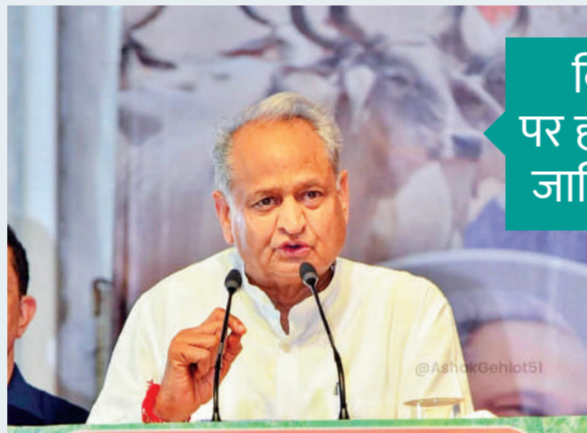
राजस्थान गोसेवा समिति द्वारा आयोजित गोसेवा सम्मेलन जयपुर (06 अक्टूबर 2023)

बेधड़क। जयपुर। चुनावी आचार संहिता लगने से पहले मुख्यमंत्री अशोक गहलोत ने एक बार फिर ऐलान करते हुए राज्य में 3 और नए जिलों की घोषणा कर दी है। मुख्यमंत्री ने शुक्रवार को जयपुर में गोसेवा सम्मेलन में घोषणा करते हुए कहा कि मालपुरा, सुजानगढ़ और कुचामन सिटी को भी जिला बनाया जाएगा। इसके बाद राजस्थान में अब कुल 53 जिले हो जाएंगे। गहलोत ने कहा कि इसे लेकर जल्द ही अधिसूचना जारी होगी। बाद में सीएम गहलोत ने सोशल मीडिया की जरिए भी अपने इस फैसले की जानकारी दी। उन्होंने लिखा कि जनता की मांग एवं उच्च स्तरीय समिति की अनुशंसा के अनुसार राजस्थान में तीन नए जिले और बनाए जाएंगे। उच्च स्तरीय समिति की सिफारिशों के अनुसार सीमांकन आदि परेशानियों को दूर किया जाता रहेगा। आचार संहिता लगने से पहले गहलोत की इस घोषणा को चुनावी लिहाज से अहम माना जा रहा है। सरकार ने बीते दिनों 19 नए जिले और तीन नए संभाग बनाने का ऐलान किया था।