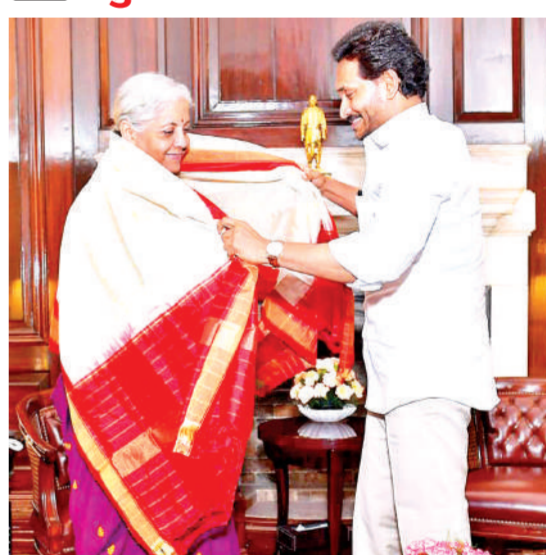
नई दिल्ली। आंध्र प्रदेश के मुख्यमंत्री वईएस जगन रेड्डी ने नई दिल्ली में केंद्रीय वित्त और कॉर्पोरेट मामलों की मंत्री निर्मला सीतारमण से मुलाकात की।