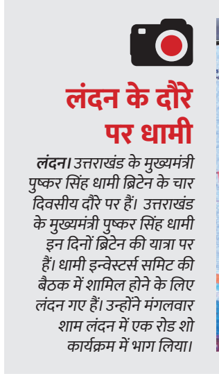
लंदन के दौर पर धामी

स्पष्टीकरण वास्तव में तर्कसंगत नहीं है। ज्ञात रहे कि भारत लगातार कह रहा है कि पूर्वी लद्दाख से लहता सीमा पर हालात सामान्य नहीं हैं एवं एलएसी पर शांति एवं सौहार्द दोनों देशों के द्विपक्षीय संबंधों को सामान्य बनाने के लिए अहम है। विदेश मंत्री ने कहा, ऐसे देश के साथ सामान्य होने की कोशिश करना बहुत कठिन है जिसने समझौते तोड़े हैं।