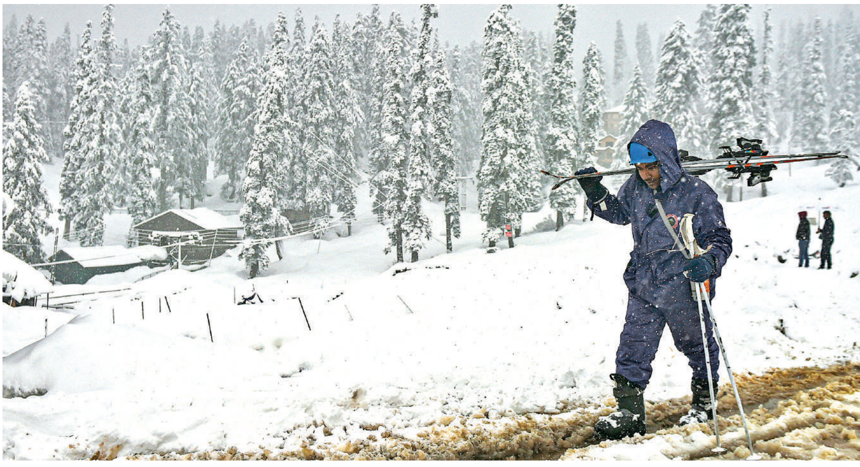
गुलमर्गा। जम्मू कश्मीर के पर्वतीय इलाकों में हिमपात हुआ है। गुलमर्ग में भारी हिमपात के बाद बर्फ से ढकी सड़क से गुजरता एक व्यक्ति।