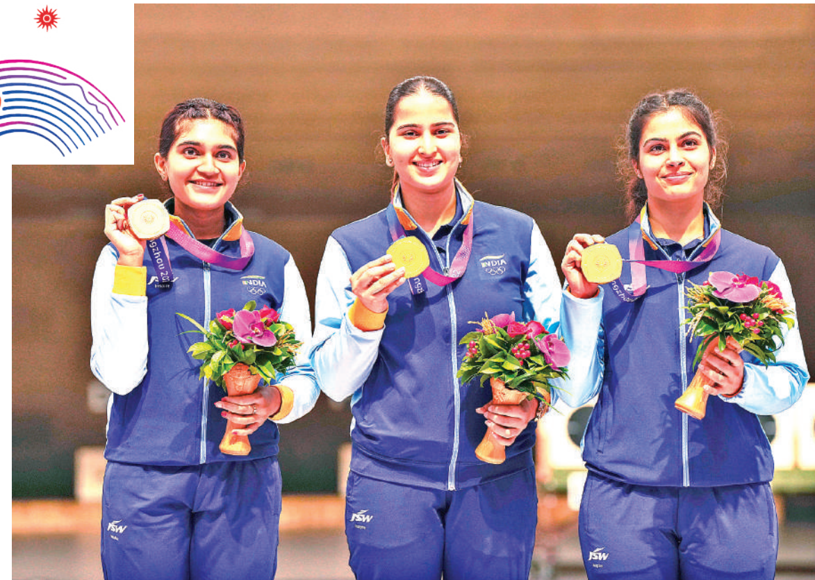
हंगझोउ। 25 मी. पिस्टल रेपिड टीम इवेंट में स्वर्णिम सफलता प्राप्त की इशा, रिदम और मनु भाकर ने।