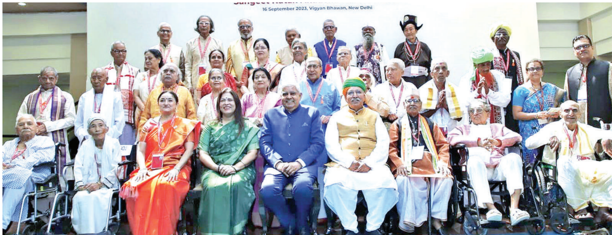
नई दिल्ली। उपराष्ट्रपति जगदीप धनखड़ ने शनिवार को 84 कलाकारों को संगीत नाटक अकादमी अमृत अवॉर्ड से सम्मानित किया। कला के विभिन्न क्षेत्रों के कलाकारों को इस दौरान सम्मानित किया गया। इनमें 70 पुरुष और 14 महिलाएं हैं। बता दें कि यह सम्मान 75 साल से ज्यादा के कलाकारों को दिया गया, जिन्हें आज तक कोई राष्ट्रीय सम्मान नहीं मिला है। सम्मानित होने वाले कलाकारों में राजस्थान के पांच कलाकारों भी शामिल हैं। सम्मान के तहत कलाकारों को एक लाख रुपए, एक ताम्रपत्र और अंगवस्त्र दिया गया। अवॉर्ड समारोह के दौरान केंद्रीय राज्य मंत्री अर्जुन राम मेघवाल और केंद्रीय राज्य संस्कृति मंत्री मीनाक्षी लेखी भी मौजूद रहीं।