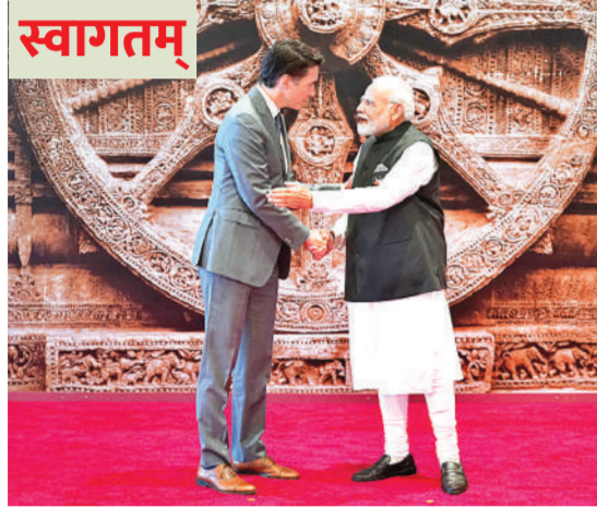
कनाडा के प्रधानमंत्री जस्टिन ट्रूडो।