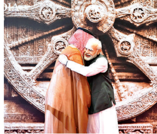
सऊदी अरब के क्राउन प्रिंस मोहम्मद बिन सलमान।