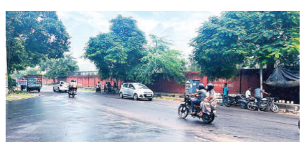
गया। दूसरी तरफ शेखावाटी के कई इलाकों में बारिश नहीं होने की वजह से फसलें सूखना शुरू हो गई हैं। कई जगह बाजरे की फसल सूखने की वजह से किसानों के सामने चारे का संकट खड़ा हो गया है। आगामी दिनों में बारिश की गतिविधियों में कमी आएगी। प्रदेश में एक दर्जन से अधिक जगह

बेधड़क। जयपुर प्रदेश में एक दर्जन से अधिक जगहों पर शनिवार को बारिश हुई। इसके बाद आमजन को गर्मी से हल्की राहत मिली। वहीं बारिश की बूंदें कई जगह फसलों के लिए वरदान बनकर बरसी। राज्य में पिछले दिनों से लगातार बढ़ रहे तापमान में शनिवार को हल्की गिरावट भी दर्ज की गई। शुक्रवार की तुलना में शनिवार को कई जगह तापमान में 5 डिग्री तक की गिरावट दर्ज की गई। शनिवार को राज्य में सर्वाधिक तापमान बाड़मेर में 40.3 डिग्री सेल्सियस रहा। इसके अलावा प्रदेश के अधिकांश जिलों में तापमान 35 से 40 डिग्री के बीच दर्ज किया