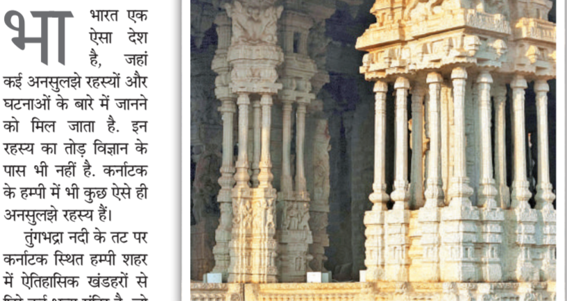
ठोस ग्रेनाइट से बने हैं ये स्तंभ

हम्पी के विट्टल मंदिर के संगीतमय स्तंभ शिल्प कौशल और इंजीनियरिंग का चमत्कार हैं। कर्नाटक के हम्पी में स्थित यह मंदिर अपनी शानदार वास्तुकला और समृद्ध सांस्कृतिक विरासत के लिए प्रसिद्ध है। 500 साल से अधिक पुराने मंदिर का मंत्रमूढ़ कर देने वाला संगीत सुनने के लिए पर्यटक वर्षों से यूनेस्को के विश्व धरोहर स्थल आते रहे हैं। इन स्तंभों को हल्के से प्रहार करने पर प्रत्येक स्तंभ से बांसुरी, तबला, मृदंगम और वाजा जैसे विभिन्न संगीत वाद्ययंत्रों जैसी एक अलग ध्वनि निकलती है। ये स्तंभ ठोस ग्रेनाइट से बने हैं, जो एक कठोर पत्थर है। खंभे अंदर से खोखले हैं, पतले स्तंभ संरचना को सहारा देते हैं। जब खंभों पर धीरे से प्रहार किया जाता है, तो कंपन छोटे स्तंभों के माध्यम से गुजरता है और खोखले कोर के भीतर गूँजता है, जिसके परिणामस्वरूप संगीतमय ध्वनियां उत्पन्न होती हैं।