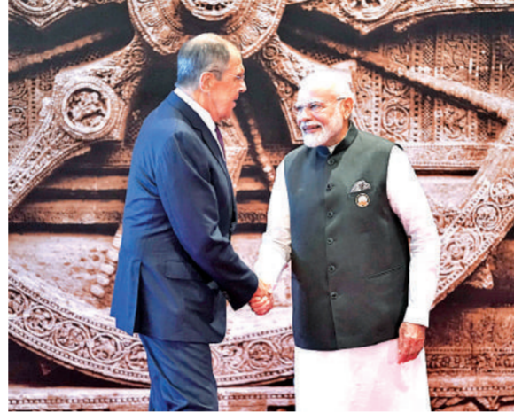
रूस के विदेश मंत्री सर्गेई लावरोव।