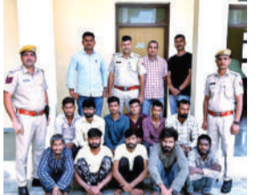
ये हुए गिरफ्तार