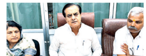
पानी लोगों को नहीं मिल पा रहा है। इसके साथ जिला मुख्यालय पर ही सड़कें खुदी पड़ी हैं। इसके संबंध में न तो पीपल्स डेवेलपमेंट ऑफ रूरल इंडिया के अधिकारी ध्यान दे रहे हैं। इसके साथ उन्होंने टोंक जिले में भाजपा की परिवर्तन संकल्प यात्रा की जानकारी देते हुए कहा कि 12 सितंबर को निवाई में प्रवेश करेगी। इसके बाद टोंक जिला मुख्यालय पर भी सभा होगी। उन्होंने कांग्रेस की राष्ट्रीय महासचिव प्रियंका गांधी वाड़ा के राजस्थान दौरे को लेकर कहा कि भाजपा की परिवर्तन संकल्प यात्रा से कांग्रेस बौखला गई है। इसके चलते निवाई में परिवर्तन यात्रा के प्रवेश करने से टोंक प्रियंका गांधी की जनसभा की जा रही है।

बेधड़क। टोंक जिले की निवाई विधानसभा क्षेत्र के लोगों की पेयजल समस्या अब जल्द खत्म होगी। स्थानीय सांसद सुखबीर सिंह जौनपुरिया ने निवाई में जल्द ही जनता जल योजना के तहत 135 करोड़ का टेंडर होने की जानकारी देते हुए कहा कि अब पीने का पानी मिलेगा। इसके साथ ही उन्होंने स्थानीय कलेक्टर समिति प्रशासन पर केंद्रीय योजनाओं को लेकर ध्यान नहीं देने का आरोप लगाते हुए कहा कि जब भी अधिकारियों से केंद्रीय योजना के क्रियान्वयन संबंधित जानकारी ली जाती है तो वे ध्यान नहीं देते। शहर में कई जगह पर पीने का