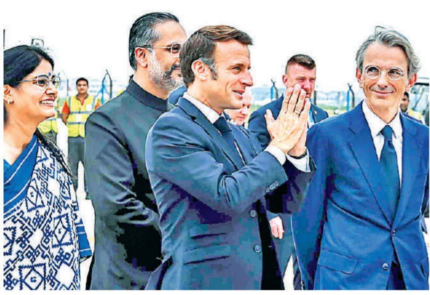
फ्रांस के राष्ट्रपति एमन्युएल मैक्रों का नई दिल्ली पहुंचने पर स्वागत किया गया।