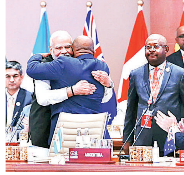
अफ्रीकी संघ के अध्यक्ष अजाली असौमनी पीएम मोदी से गले मिलते हुए।