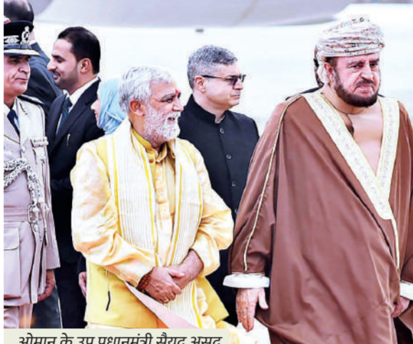
ओमान के उप प्रधानमंत्री सैयद असद