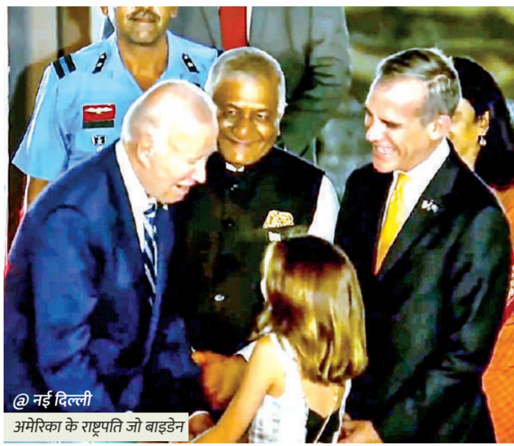
नई दिल्ली अमेरिका के राष्ट्रपति जो बाइडेन