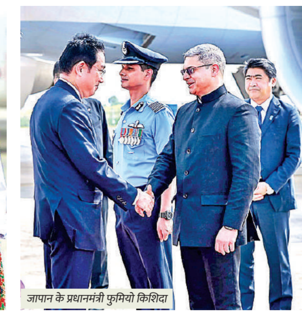
जापान के प्रधानमंत्री फुमियो किशिदा