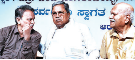
ने इस घटनाक्रम को लेकर कहा कि इसमें कुछ भी नया नहीं है। शिवकुमार ने कहा, वे ऐसा कर लें... पहले भी उन्होंने ऐसा किया था जब अशोक अन्ना (भाजपा नेता आर. अशोक) और कुमार अन्ना (कुमारस्वामी) पिछली भाजपा-जद (एस) गठबंधन सरकार में एक साथ आए थे। वे अपना अस्तित्व बचाने के लिए कुछ भी कर लें।

इस घटनाक्रम को लेकर कर्नाटक के मुख्यमंत्री सिद्धरमैया ने कहा कि वह लोकसभा चुनाव के लिए भाजपा और जद(एस) के बीच हुए चुनावी गठबंधन से चिंतित नहीं हैं। उन्होंने दावा किया कि जनता कांग्रेस पार्टी का समर्थन करेगी। सिद्धरमैया ने संवाददाताओं से कहा, चाहे गठबंधन होगा या वे अलग-अलग लड़ेंगे, मुझे इसकी परवाह नहीं है। हम लोगों से वोट करने की अपील करेंगे। लोग हमारे साथ हैं। वे हमें वोट देंगे। उपमुख्यमंत्री डी.के. शिवकुमार