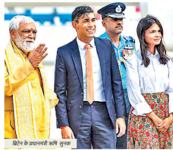
ब्रिटेन के प्रधानमंत्री ऋषि सुनक