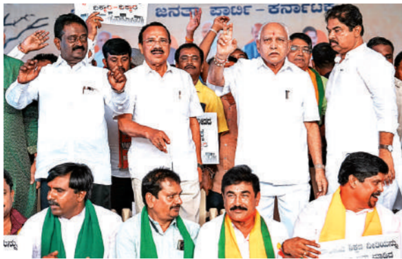
ने यहां संवाददाताओं से बातचीत में कहा, पूर्व पीएम देवेगौड़ा ने हमारे प्रधानमंत्री से मुलाकात की और उन्होंने चार सीट तय कर ली हैं। इसका स्वागत करता हूँ... भाजपा और जद (एस) के बीच तालमेल होगा।

एजेंसी। बेंगलुरु कर्नाटक के पूर्व मुख्यमंत्री बी.एस. येदियुरप्पा ने शुक्रवार को कहा कि भाजपा 2024 के लोकसभा चुनाव के लिए पूर्व प्रधानमंत्री एच.डी. देवेगौड़ा की पार्टी जनता दल (सेक्युलर) के साथ तालमेल करेगी। येदियुरप्पा की इस घोषणा ने राज्य में सियासी तापमान बढ़ा दिया है। भाजपा संसदीय बोर्ड के सदस्य येदियुरप्पा ने कहा कि चुनावी तालमेल के तहत जद (एस) कर्नाटक में 28 संसदीय क्षेत्रों में से चार पर चुनाव लड़ेगी। येदियुरप्पा