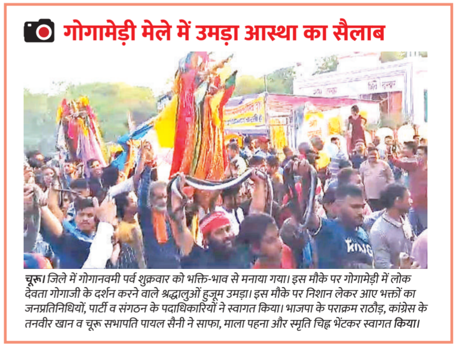
गोगामेड़ी मेले में उमड़ा आस्था का सैलाब