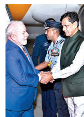
ब्राजील के राष्ट्रपति लुई लुला दा सिल्वा