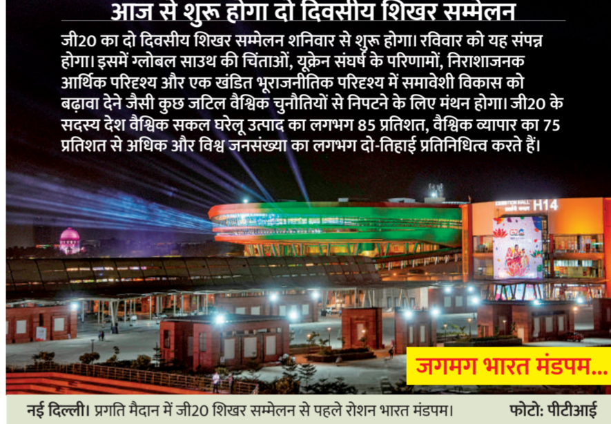
नई दिल्ली। प्रगति मैदान में जी20 शिखर सम्मेलन से पहले रोशन भारत मंडपम।

एजेंसी। नई दिल्ली। प्रधानमंत्री नरेन्द्र मोदी ने शुक्रवार को अमेरिकी राष्ट्रपति जो बाइडेन के साथ द्विपक्षीय वार्ता के बाद एक्स पर पोस्ट में कहा कि भारत और अमेरिका के बीच मित्रता वैश्विक भलाई को आगे बढ़ाने में बड़ी भूमिका निभाती रहेगी। उन्होंने कहा, बैठक 'बहुत सार्थक' रही, भारत एवं अमेरिका के बीच आर्थिक, दोनों देशों के लोगों के बीच संबंधों को आगे बढ़ाने के विषयों पर चर्चा हुई। इसके साथ ही जो बाइडेन ने एक्स पर कहा, 'मोदी से मिलकर बहुत अच्छा लगा। दोनों देशों में साझेदारी और मजबूत होगी।' यह मुलाकात प्रधानमंत्री मोदी की अध्यक्षता में होने वाले जी20 शिखर सम्मेलन में भाग लेने के लिए बाइडेन के शुक्रवार शाम नई दिल्ली पहुंचने के तत्काल बाद हुई।