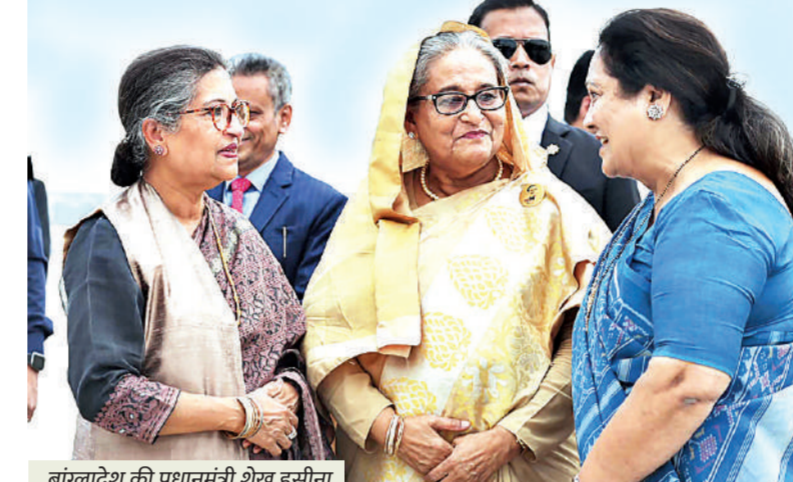
बांग्लादेश की प्रधानमंत्री शेख हसीना