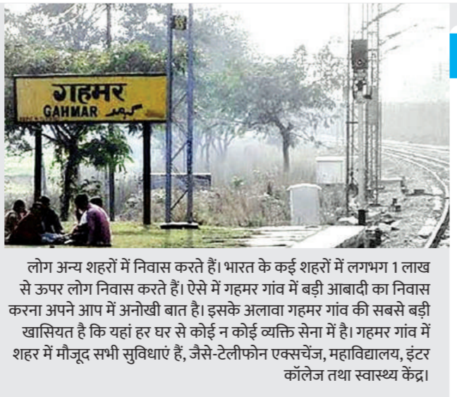
लोग अन्य शहरों में निवास करते हैं। भारत के कई शहरों में लगभग 1 लाख से ऊपर लोग निवास करते हैं। ऐसे में गहमर गांव में बड़ी आबादी का निवास करना अपने आप में अनोखी बात है। इसके अलावा गहमर गांव की सबसे बड़ी खासियत है कि यहां हर घर से कोई न कोई व्यक्ति सेना में है। गहमर गांव में शहर में मौजूद सभी सुविधाएं हैं, जैसे-टेलीफोन एक्सचेंज, महाविद्यालय, इंटर कॉलेज तथा स्वास्थ्य केंद्र।

एक लाख से ज्यादा जनसंख्या गहमर गांव भारत के उत्तर प्रदेश राज्य के गाजीपुर जिले का एक गांव है। यह न सिर्फ भारत का बल्कि एशिया महाद्वीप का सबसे बड़ा गांव है। यह बिहार की राजधानी पटना और मुगलसराय रेल मार्ग पर स्थित है। इस गांव के पश्चिम छोर पर कमरुच्छा माई जिन्हें मां कामाख्या के रूप में भी जाना जाता है, का मंदिर स्थित है। इस गांव की जनसंख्या की बात करें तो यहां करीब 1 लाख 20 हजार से अधिक लोग निवास करते हैं। इसके अलावा गांव के लगभग 50 हजार