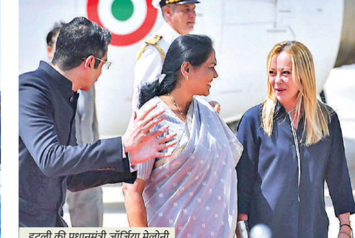
इटली की प्रधानमंत्री जोर्जिया मेलोनी

नई दिल्ली। जी-20 देशों की शिखर बैठक में भाग लेने के लिए वैश्विक नेता भारत पहुंच रहे हैं। नई दिल्ली पहुंचने पर उनका भावभीना स्वागत किया गया। विदेशी मेहमानों के आने का सिलसिला शुक्रवार देर रात तक जारी रहा।