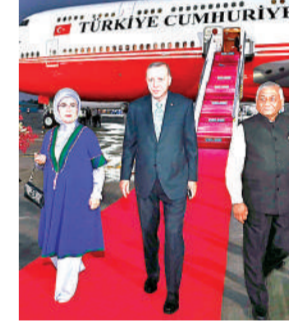
तुर्किये के राष्ट्रपति रेसेप तैयब एर्दोगन

नई दिल्ली। जी20 शिखर सम्मेलन की पूर्व संध्या पर राष्ट्रीय राजधानी खासकर नई दिल्ली जिले में सुरक्षा कड़ी कर दी गई है और पुलिस, अदृशिक बल तथा अन्य एजेंसियां शहर में कड़ी निगरानी रख रही हैं। शिखर सम्मेलन से पहले दिल्ली पुलिस ने अहम स्थानों पर सशस्त्र बलों को तैनात किया है तथा सीमावर्ती क्षेत्रों में गश्त बढ़ा दी है। दिल्ली पुलिस को 50,000 से अधिक सुरक्षा कर्मी, पुलिस सहायता प्रदान कर रहे हैं। एक वरिष्ठ अधिकारी ने कहा, हवाई अड्डे से होटलों तक और होटलों से जी20 शिखर सम्मेलन स्थलों तक विदेशी प्रतिनिधियों को दिल्ली पुलिस द्वारा अचूक सुरक्षा प्रदान की जाएगी।