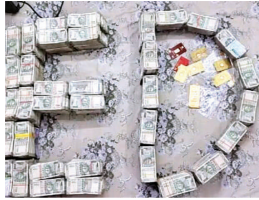
अन्य के हुई। इसमें जब्त की गई नकदी और सोने के अलावा अनेक दस्तावेज व हार्ड डिस्क, मोबाइल फोन आदि अनेक डिजिटल रिकॉर्ड भी जब्त किए गए हैं।