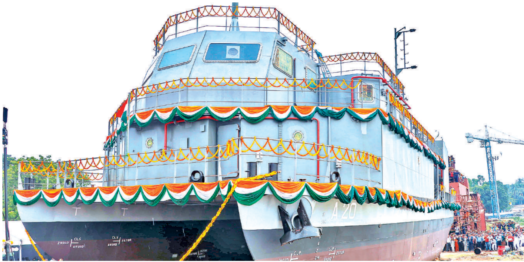
कोलकाता। टीटागढ़ रेल सिस्टम्स लिमिटेड (टीआरएसएल) ने गुरुवार को पश्चिम बंगाल के टीटागढ़ स्थित अपने शिपयार्ड में भारतीय नौसेना के लिए पहले डाइविंग सर्पोट क्राफ्ट (डीएससी) का अनावरण किया। कंपनी ने कहा कि टीआरएसएल भारतीय नौसेना के लिए इस तरह के पांच जहाज बना रही है। अधिकारियों के मुताबिक, सभी पांच डीएससी का कुल अनुबंध मूल्य लगभग 175 करोड़ रुपये था। डीएससी एक अत्याधुनिक जहाज है जो किसी भी वातावरण में नौवहन की सुविधा के लिए उन्नत तकनीकी क्षमताओं से लैस है। इसमें भारतीय नौसेना के गोताखोरों के लिए अत्याधुनिक उपकरण हैं।