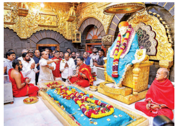
अहमदनगर। रक्षा मंत्री राजनाथ सिंह ने महाराष्ट्र के मुख्यमंत्री एकनाथ शिंदे और अन्य लोगों के साथ अहमदनगर जिले के शिरडी स्थित साई बाबा मंदिर में पूजा-अर्चना की।