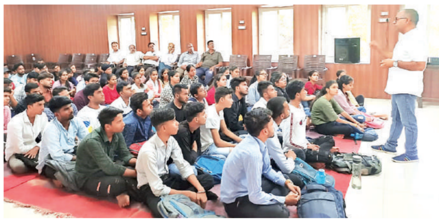
तक अंगदान पखवाड़ा मनाने का आदेश राज्य सरकार के अधीन सभी विभागों को दिया था। इसी आदेश के तहत शाइन इंडिया फाउंडेशन ने भी कोटा, बूंदी, बाग और झालावाड़ में अंगदान पखवाड़े के दौरान जागरूकता कार्यशालाओं का आयोजन किया गया। 14 दिनों

इसके साथ ही राजस्थान सरकार की अतिरिक्त मुख्य सचिव शुभा सिंह ने अंगदान के कार्यक्रम को प्रदेशभर में महोत्सव के रूप में बनाने के लिए 3 से 17 अगस्त