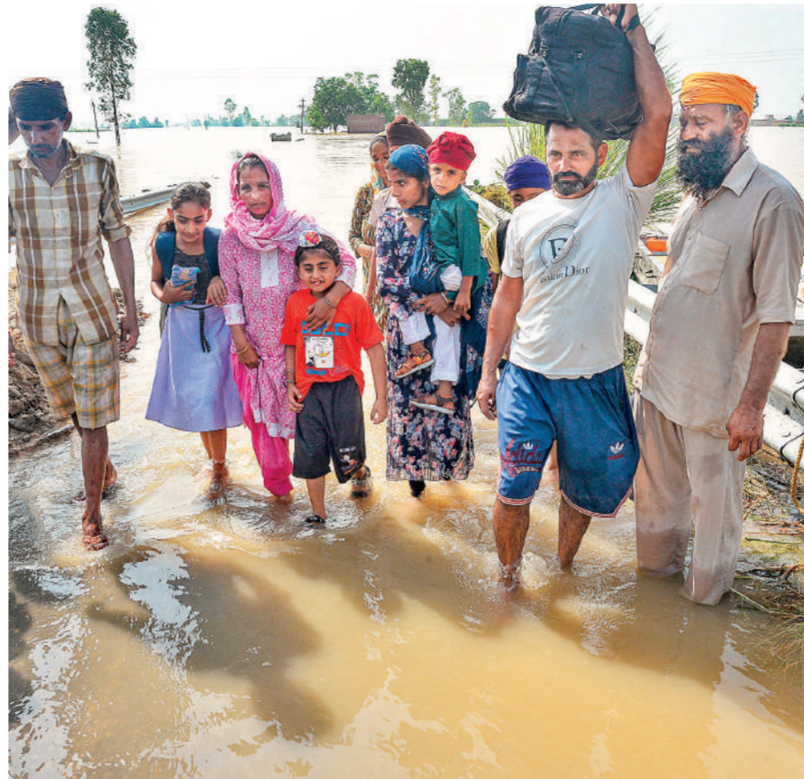
जालंधर। भारी बारिश व बाखड़ा नंगल बांध से अतिरिक्त पानी छोड़ जाने से पंजाब के कई जिले बाढ़ की चपेट में हैं। भारी बारिश के कारण ब्यास नदी में उफान के कारण जालंधर जिले के कई इलाके जलमग्न हो गए। बाढ़ प्रभावित इलाकों से सुरक्षित स्थानों की ओर जाते लोग।