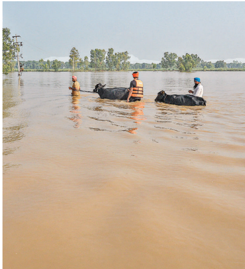
जालंधर। भारी बारिश व बाखड़ा नंगल बांध से अतिरिक्त पानी छोड़ जाने से पंजाब के कई जिले बाढ़ की चपेट में हैं। भारी बारिश के कारण ब्यास नदी में उफान के कारण जालंधर जिले के कई इलाके जलमग्न हो गए। बाढ़ प्रभावित इलाकों से सुरक्षित स्थानों की ओर जाते लोग।