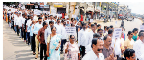
चिकमगलुर। मणिपुर में जारी हिंसा के विरोध में कर्नाटक के चिकमगलुर में प्रदर्शन करते ईसाई समुदाय के लोग।

एजेंसी। इंपाल। मणिपुर में करीब डेढ़ सप्ताह बाद शुक्रवार तड़के फिर हिंसा की घटनाएं हुईं। ताजा घटना में शुक्रवार को उखरूल जिले के कुकी थोवाई गांव में भारी गोलीबारी के बाद तीन लोगों के शत-विक्षत शव मिले। अधिकारियों ने बताया कि हिंसा के हालिया दौर में तांगखुल नगाओं के प्रभुत्व वाले उखरूल जिले में पहली बार हमला हुआ है।