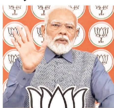
तीन परियोजनाओं को प्राथमिक तौर पर लें

एजेसी। नई दिल्ली। प्रधानमंत्री नरेंद्र मोदी ने शुक्रवार को भाजपा के 'जिला पंचायत सदस्यों से विभिन्न विकास पहलों को जन-आंदोलन बनाने के लिए काम करने का आग्रह किया और कहा कि 2047 तक भारत को विकसित देश बनाने के लिए हर गांव, तहसील और जिले में विकास का दीपक जलाना है। गुजरात, महाराष्ट्र और मध्य प्रदेश सहित कई राज्यों के स्थानीय निकाय सदस्यों की क्षेत्रीय पंचायती राज परिषद को वर्चुअल रूप से संबोधित करते हुए उन्होंने कहा कि 'सबका साथ, सबका विकास' भाजपा के लिए केवल एक नारा नहीं है और उन्हें इसे हर पल आत्मसात करना चाहिए। यह सम्मेलन दादर और नगर हवेली और दमन एवं दीव में आयोजित किया गया। प्रधानमंत्री के संबोधन के दौरान भाजपा के अध्यक्ष जेपी नन्दा भी मौजूद थे। पहले मुख्यमंत्री और फिर प्रधानमंत्री के रूप में अपने अनुभव का हवाला देते हुए