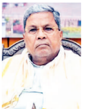
आयोग यह करेगा जांच

एजेसी। बेंगलुरु। कर्नाटक सरकार ने राज्य में पूर्ववर्ती भाजपा नीत सरकार के दौरान सार्वजनिक परियोजनाओं के लिए 40 प्रतिशत कमीशन की मांग किए जाने के आरोपों की न्यायिक जांच का आदेश दिया है।