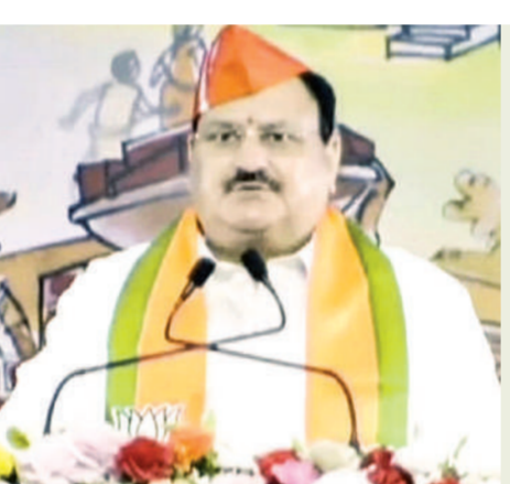
तीन परियोजनाओं को प्राथमिक तौर पर लें

प्रधानमंत्री ने जिला पंचायत सदस्यों से हर साल तीन परियोजनाओं को प्राथमिकता के तौर पर लेने के लिए बैठकें आयोजित करने का आग्रह किया। उन्होंने यह भी कहा कि स्थानीय निकायों के लिए कोष कई गुना बढ़ गया है और संसाधन कोई बाधा नहीं हैं। मोदी ने परिसंपत्ति निर्माण के लिए मनरेगा बजट के एक हिस्से का उपयोग करने पर भी जोर दिया। उन्होंने कहा, पहले, काम करना चाहिए तथा लोगों का समर्थन प्राप्त करके इसे सफल बनाने के लिए हरसंभव प्रयास करना चाहिए। मोदी ने कहा कि