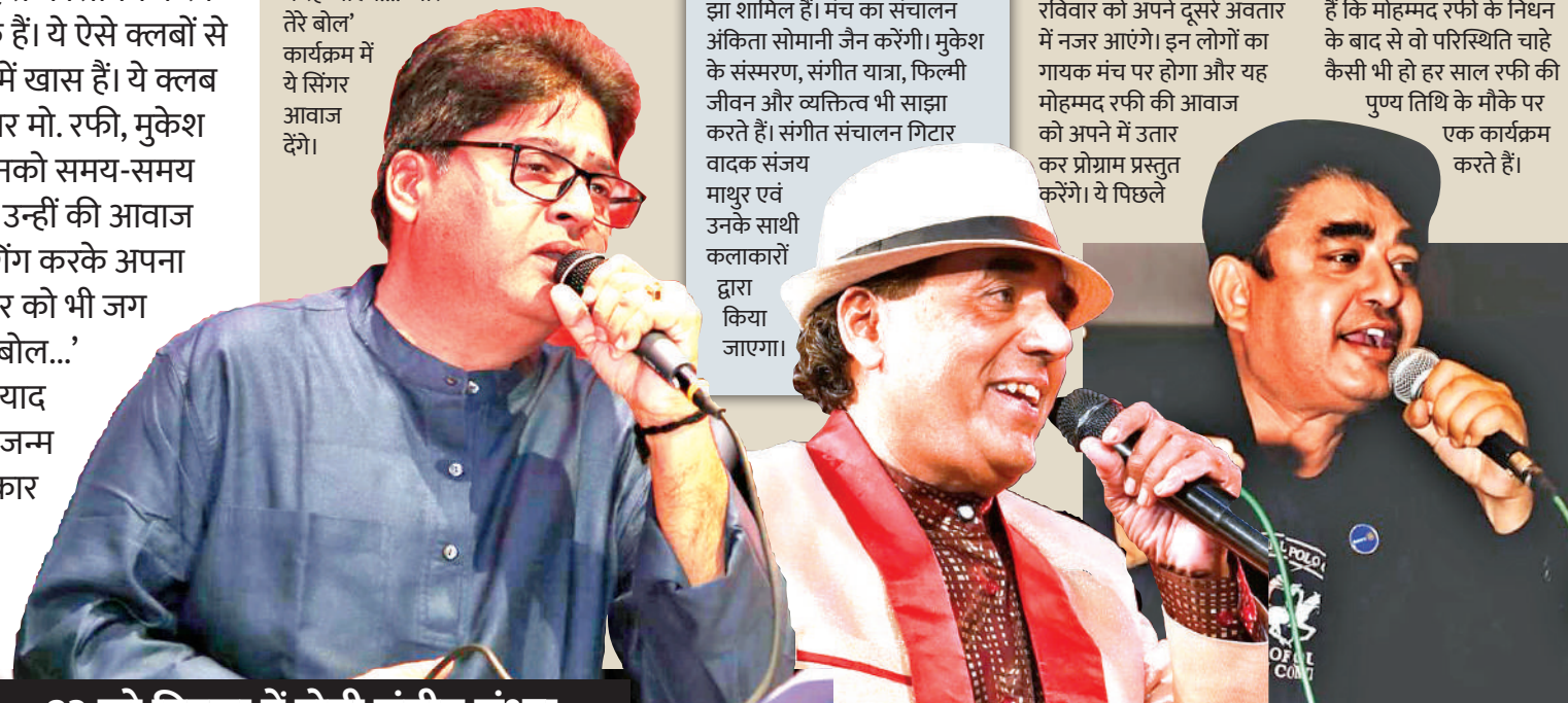
23 को बिड़ला में होगी संगीत संध्या