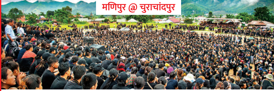
मणिपुर @ चुराचांदपुर

मणिपुर सरकार ने कहा... मुख्य साजिशकर्ता सहित चार गिरफ्तार