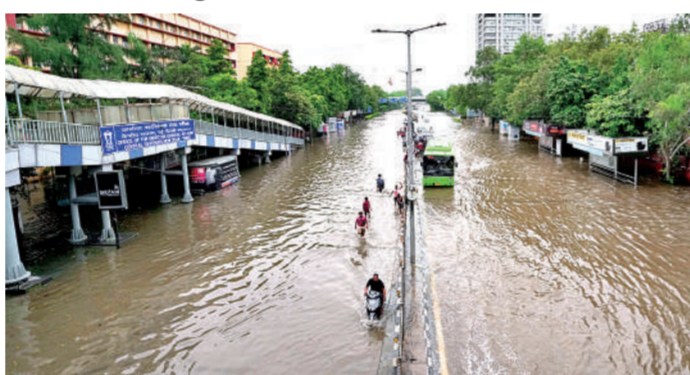
बारिश की नहीं, आरोप-प्रत्यारोपों की झड़ी

एजेंसी। नई दिल्ली। दिल्ली में यमुना नदी में जलस्तर घट रहा है और शहर में बाढ़ग्रस्त इलाकों में भी हालत में सुधार हो रहा है। लेकिन शनिवार को कई इलाकों में फिर हुई बारिश ने लोगों की चिंता बढ़ा दी। दूसरी ओर राष्ट्रीय राजधानी में बाढ़ को लेकर सियासी पार चढ़ गया है। भाजपा और आप में आरोप-प्रत्यारोप शुरू हो गए हैं। दोनों पार्टियों ने एक दूसरे की सरकारों को बाढ़ के लिए जिम्मेदार ठहराया है।