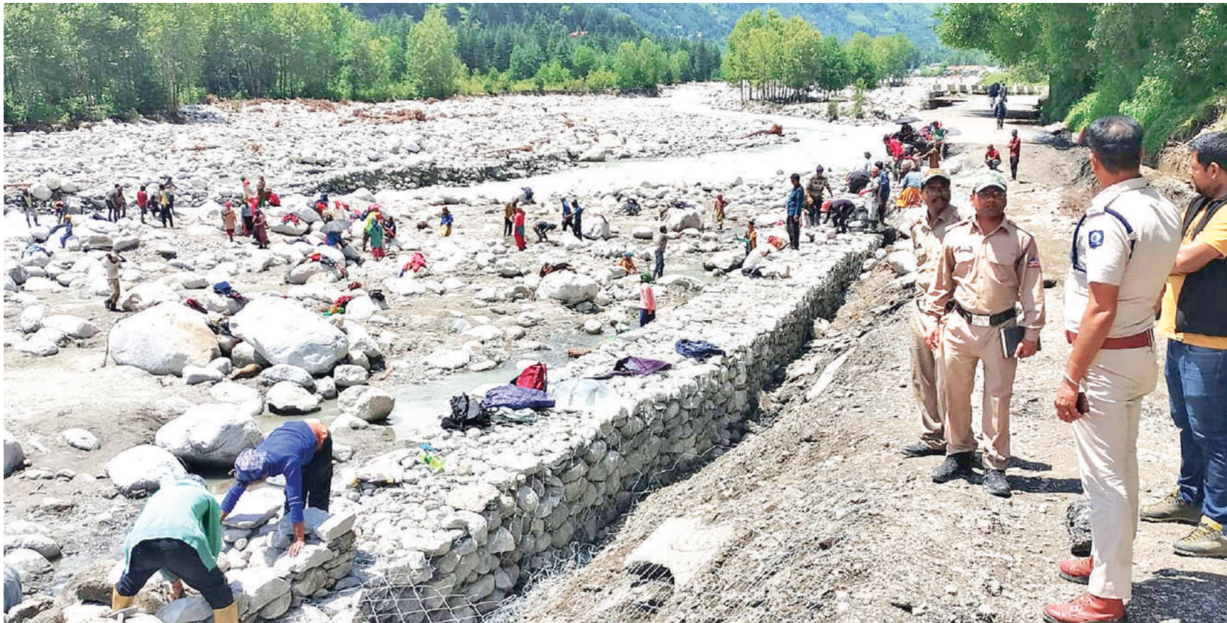
सोलना हिमाचल प्रदेश में हाल में हुई अतिभारी बारिश व बाढ़ से राज्य में व्यापक नुकसान हुआ है। इससे शहरों व विभिन्न राजमार्गों को बहुत नुकसान पहुंचा है। जिनके अब ठीक किया जा रहा है। मनाली में भारी बारिश से क्षतिग्रस्त हुए मनाली-लेह राजमार्ग को दुरुस्त करने में लगी सीमा सड़क संगठन की टीम व अन्य लोग।