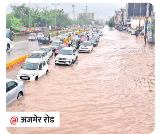
@ अजमेर रोड

शहर में भारी बारिश के दौरान विभिन्न क्षेत्रों में जलभराव की स्थिति उत्पन्न होने पर जिला कलेक्टर प्रकाश राजपुरोहित ने प्रभावित क्षेत्रों का निरीक्षण किया। उन्होंने सीकर रोड, देहर के बालाजी, निवारू रोड, झोटावाड़ा, पांच्यावाला, सिरसी रोड, गिरधारीपुरा, अजमेर रोड, जवाहर नगर और परकोटे क्षेत्र का निरीक्षण किया गया। उनके साथ एसडीएम शंकर लाल सैनी भी उपस्थित रहे।