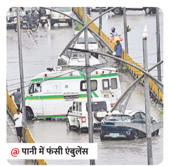
@ पानी में फंसी एंबुलेंस