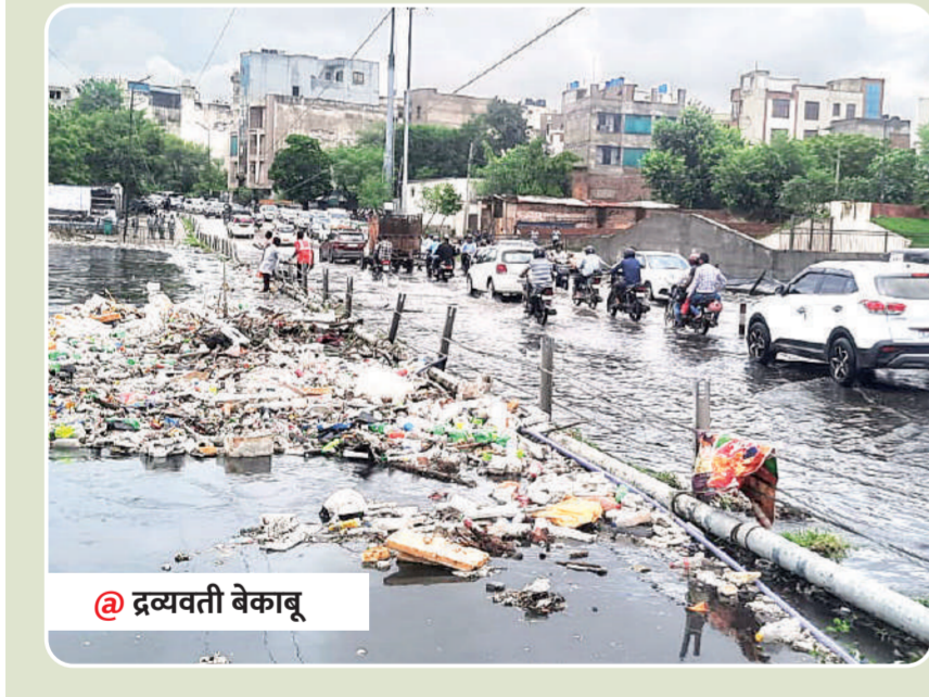
@ द्रव्यवती बेकाबू

बारिश से द्रव्यवती नदी भी ओवरफ्लो होकर सड़क पर बहने लग गई। इससे महारानी फार्म पर वाहनों को जाम लग गया। सहकार मार्ग पर नव निर्मित बिल्डिंग की जमीन धंस गई। मौके पर काम कर रहे मजदूरों के तुरंत बाहर निकलने से बड़ा हादसा टल गया।