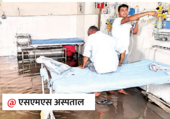
@ एसएमएस अस्पताल