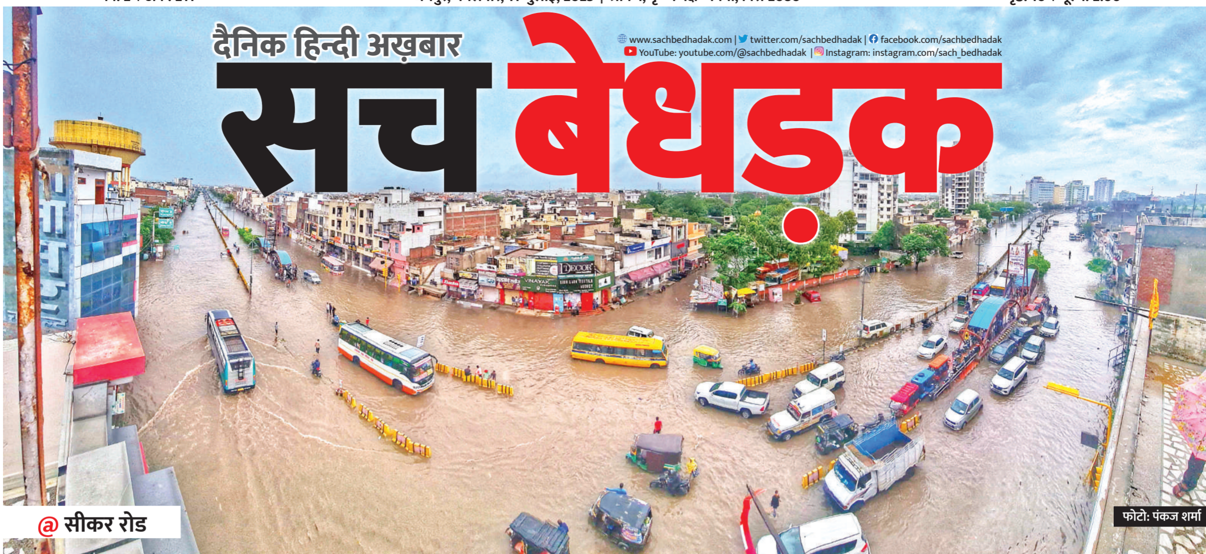
@ सीकर रोड