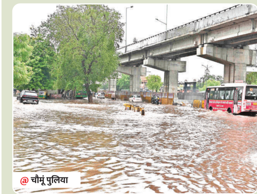
@ चौमूं पुलिया

सीकर रोड, एमआई रोड, परकोटे के सुभाष चौक, ब्रह्मपुरी, जौहरी बाजार, सिरसी रोड, खिरणी फाटक, वैशाली नगर, सी स्कीम, मानसरोवर, अजमेर रोड, दिल्ली रोड के इलाके कई इलाके जलमग्न हो गए। सड़कों पर पांच फीट से अधिक पानी होने के कारण कई वाहनों के इंजन जाम हो गए।