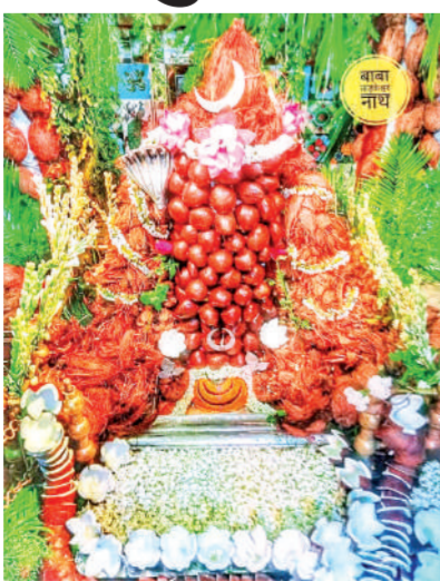
के प्रमुख तीर्थ गलता से कांबड़िए जल लेकर आए और भगवान शिव का जलाभिषेक किया।

श्रावण मास के पहले सोमवार पर छोटी काशी शिवमय हो गई। सुबह से हुई बारिश के बीच भी दिनभर मंदिरों में महादेव को जल चढ़ाने के लिए भक्तों का तांता लगा रहा। अलसुबह से शहर के प्रमुख ताड़केश्वर, झाड़खंड, जंगलेश्वर महादेव, चमलकेश्वर, भूतेश्वर महादेव, धूलेश्वर सहित अन्य शिवालयों में हर-हर महादेव का उद्घोष के बीच जलाभिषेक करने की भक्तों में होड़ नजर आई। मंदिर प्रबंधनों की ओर से भक्तों के लिए विशेष व्यवस्था की गई। पूजन सामग्री भी कुछ मंदिरों में निशुल्क मुहैया करवाई गई। ताड़केश्वर महादेव मंदिर में नारियल की विशेष झांकी सजाई गई। वहीं शहर