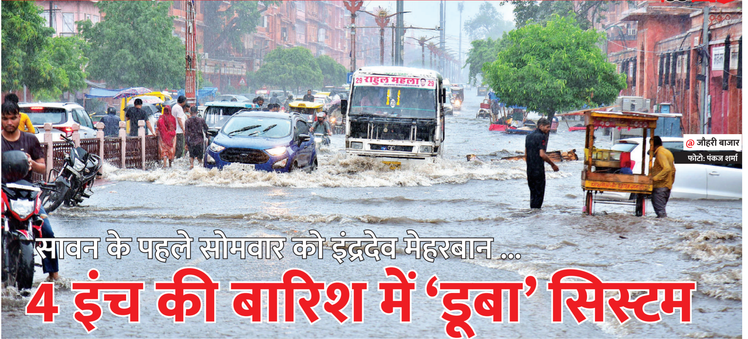
@ जौहरी बाजार