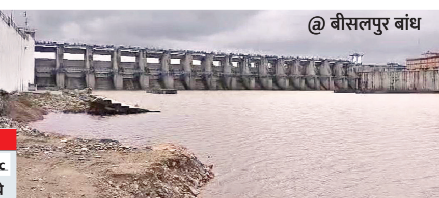
@ बीसलपुर बांध

प्रदेश में पिछले दो दिनों से लगातार हो रही बारिश के कारण दो जगहों पर चार लोगों की बिजली गिरने और डूबने से मौत हो गई। चित्तौड़गढ़ जिले में बिजली गिरने से दो लोगों की मौत हो गई, जबकि सवाईमाधोपुर व सीकर में अलग-अलग हादसों में पानी में डूबने से तीन युवकों की मौत हो गई।