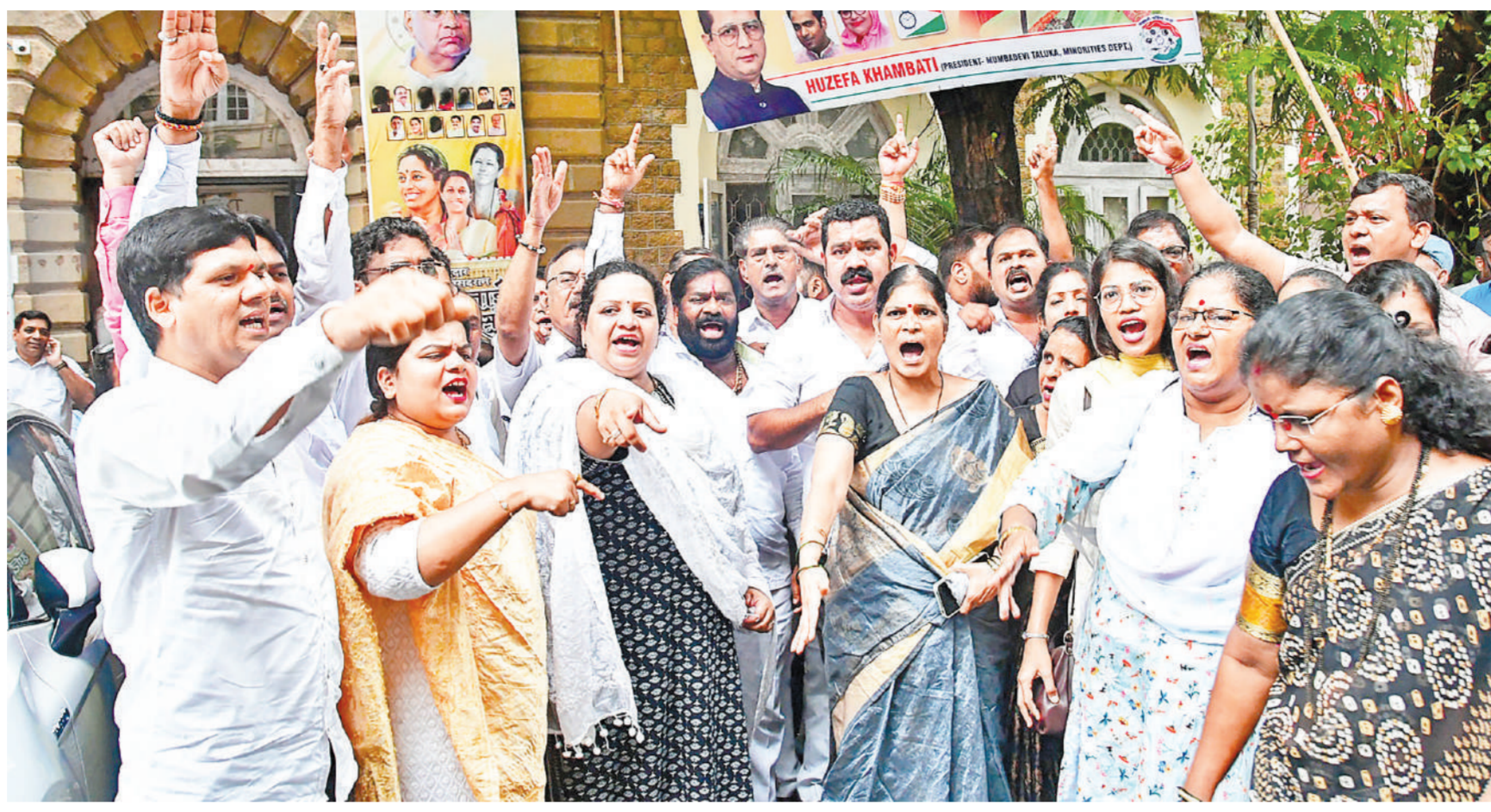
मुंबई। राकांपा नेता अजित पवार और कई अन्य पार्टी नेताओं के रविवार को एकनाथ शिंदे नीत सरकार में शामिल होने के विरोध में मुंबई में स्थित पार्टी के मुख्यालय के बाहर प्रदर्शन करते हुए राकांपा समर्थक।