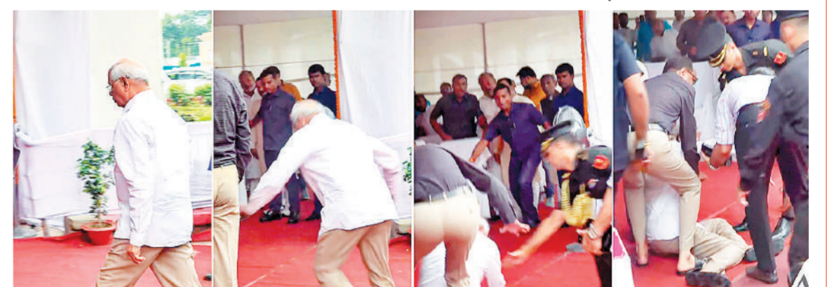
पटना। बिहार के राज्यपाल राजेंद्र किशनाथ आलेंकर गुरुवार को यहां एक समारोह स्थल की ओर जाते समय फिसल कर गिर गए, लेकिन वह बाल-बाल बच गए और उन्हें कोई चोट नहीं आई। राज्य की ओर से यहां स्वतंत्रता सेनानी मुंगेरी लाल की पुण्य तिथि पर उन्हें श्रद्धांजलि देने के लिए इस समारोह का आयोजन किया गया था। मौके पर मौजूद एक अधिकारी ने कहा कि जब राज्यपाल फिसलकर गिरे तो वहां मौजूद सुरक्षाकर्मियों और अधिकारियों ने उन्हें तुरंत उठाया। उन्हें कोई चोट नहीं आई और सुरक्षाकर्मियों की सहायता से वह तुरंत उठ गए। आलेंकर बाद में कार्यक्रम स्थल की ओर चले गए जहां बिहार के मुख्यमंत्री नीतीश कुमार और उनके कैबिनेट सहयोगियों सहित अन्य प्रतिष्ठित अतिथि भी मौजूद थे।