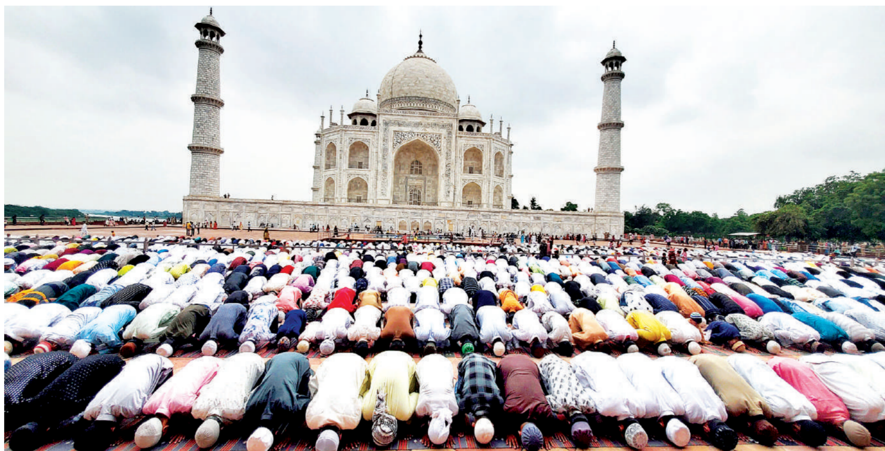
आगरा। यूपी में ईद उल अजहा (बकरीद) हर्षोल्लास के साथ मनाया गया। मुस्लिमों ने मस्जिदों और ईदगाह में नमाज पढ़ने के बाद एक दूसरे को बधाई दी। उन्होंने कुर्बानी में शिरकत की और बधाई देने एक दूसरे के घर गए। मुख्यमंत्री योगी आदित्यनाथ ने ईद उल अजहा के अवसर पर लोगों को बधाई और शुभकामनाएं दी हैं। आगरा के ताजमहल पर बड़ी संख्या में लोगों ने नमाज अदा की और देश की शांति और समृद्धि के लिए प्रार्थना की।