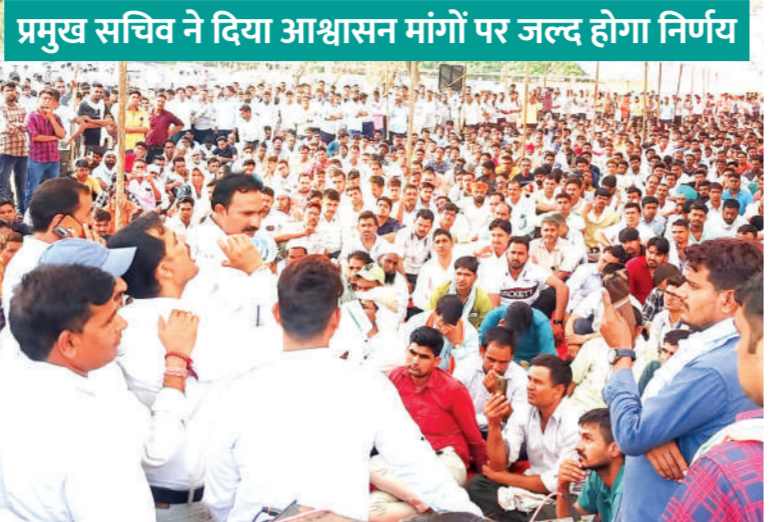
प्रमुख सचिव ने दिया आश्वासन मांगों पर जल्द होगा निर्णय

बेधड़क | जयपुर राजस्थान विद्युत तकनीकी कर्मचारी एसोसिएशन के तत्वावधान में राजस्थान राज्य विद्युत निगम के कर्मचारियों ने गुरुवार को अपनी मांगों को लेकर विरोध प्रदर्शन किया। विद्युत भवन के सामने प्रदर्शन में आरवीएनएल, आरवीपीएनएल, जेवीवीएनएल, एवीवीएनएल और जेडीवीवीएनएल के कर्मचारी शामिल हुए। एक दिवसीय संकितिक धरने में पांचों कंपनियों के हजारों की संख्या में तकनीकी सहायकों ने एवं हेल्परो ने भाग लिया।