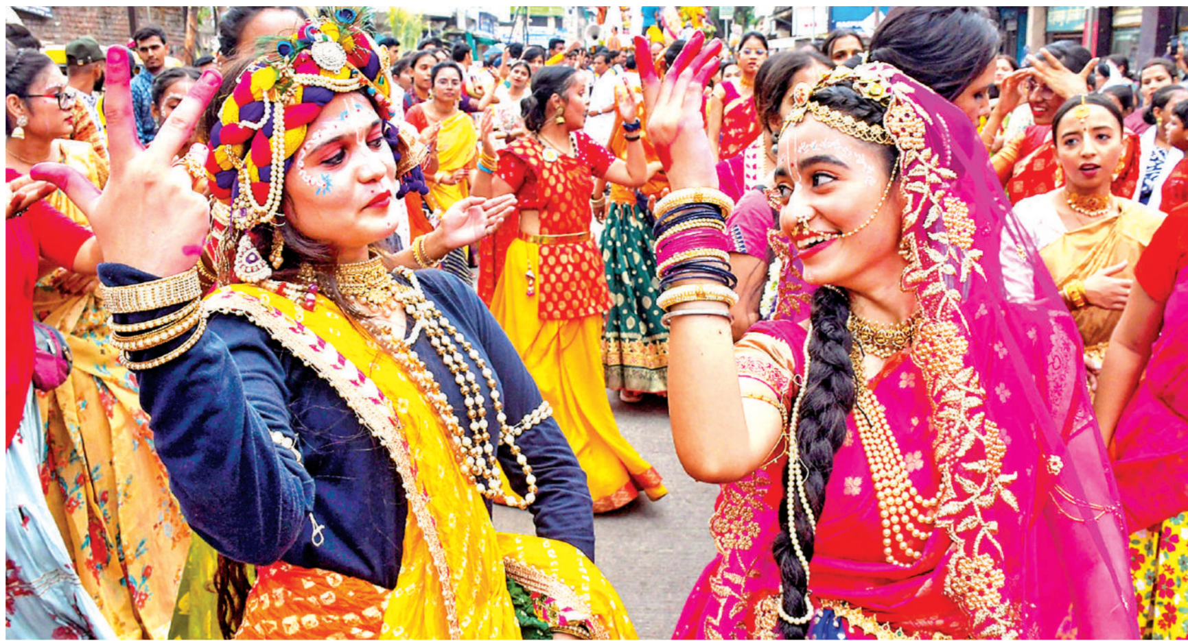
नागपुर। इंटरनेशनल सोसाइटी फॉर कृष्णा कॉन्शियसनेस (इस्कॉन) द्वारा आयोजित जगन्नाथ रथ यात्रा में भगवान कृष्ण और राधा के रूप में सजे भक्त।