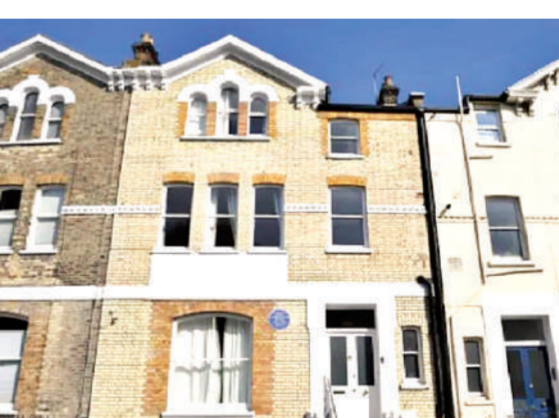
खरीदा था। वर्ष 2020 में इस घर को संग्रहालय में तब्दील किया गया और इसे लोगों के लिए खोल दिया गया। भारतीय संविधान के

उत्तर लंदन में किंग हेनरीज रोड पर स्थित 31 लाख पाउंड कीमत के इस तीन मंजिला घर को 2015 में राज्य सरकार ने संग्रहालय बनाने के उद्देश्य से