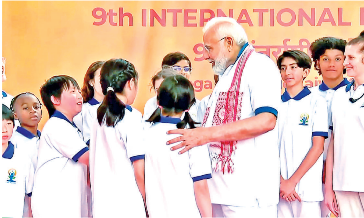
न्यूयॉर्क। नौवें अंतरराष्ट्रीय योग दिवस पर बुधवार को पीएम नरेंद्र मोदी के नेतृत्व में ऐतिहासिक योग सत्र हुआ। इस दौरान पीएम ने योग में शामिल हुए बच्चों से बातचीत की। -पीटीआई