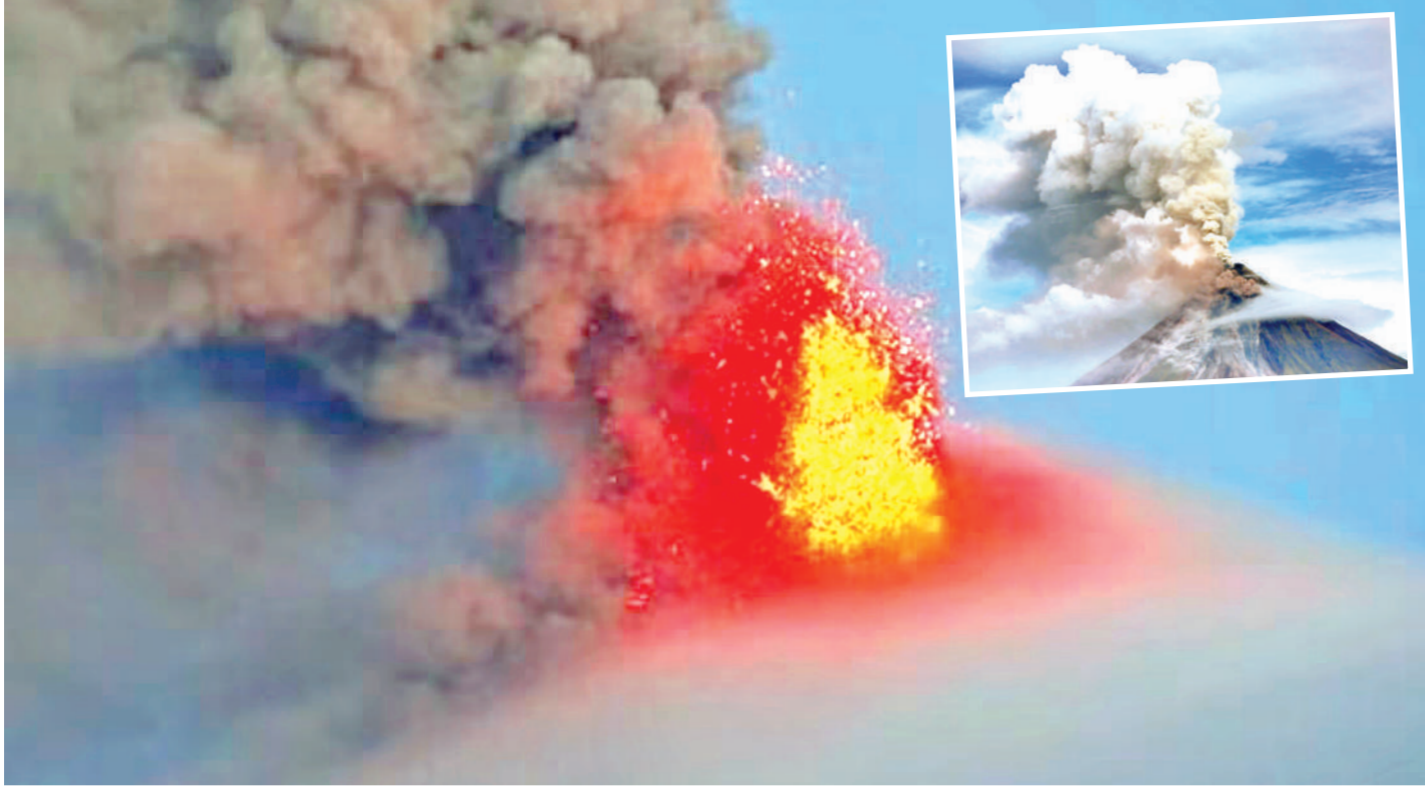
लेगास्प्री। फिलीपीन के सबसे सक्रिय ज्वालामुखी 'मायोन' से सोमवार को लावा निकलने लगा, जो धीरे-धीरे ढलान से नीचे की ओर आ रहा है। ज्वालामुखी में किसी भी वक्त विस्फोट होने की आशंका के मद्देनजर हजारों लोगों को सुरक्षित स्थानों पर जाने को कहा गया है। ज्वालामुखी के धक्के और इससे लावा निकलने की गतिविधि पिछले सप्ताह तेज हुई थी, जिसके बाद 'मायोन' के छह किलोमीटर के दायरे में रहने वाले 12,600 से अधिक लोगों ने सुरक्षित स्थानों पर पनाह ली।