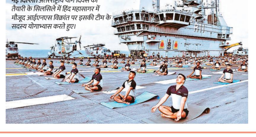
नई दिल्ली। अंतरराष्ट्रीय योग दिवस की तैयारी के सिलसिले में हिंद महासागर में मौजूद आईएनएस विक्रान्त पर इसकी टीम के सदस्य योगाभ्यास करते हुए।