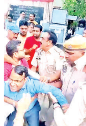
के प्रतिनिधियों ने कई आश्वासन दिए लेकिन पूरे नहीं हुए। अब आश्वासन नहीं फैसला चाहिए।