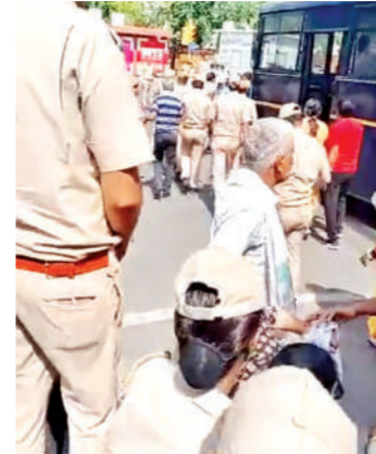
इधर, वन कर्मचारी बैठे अनशन पर